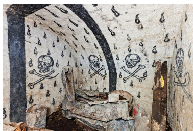
Vue d'ensemble vers le sud-est. IVR52_20165300346NUCA