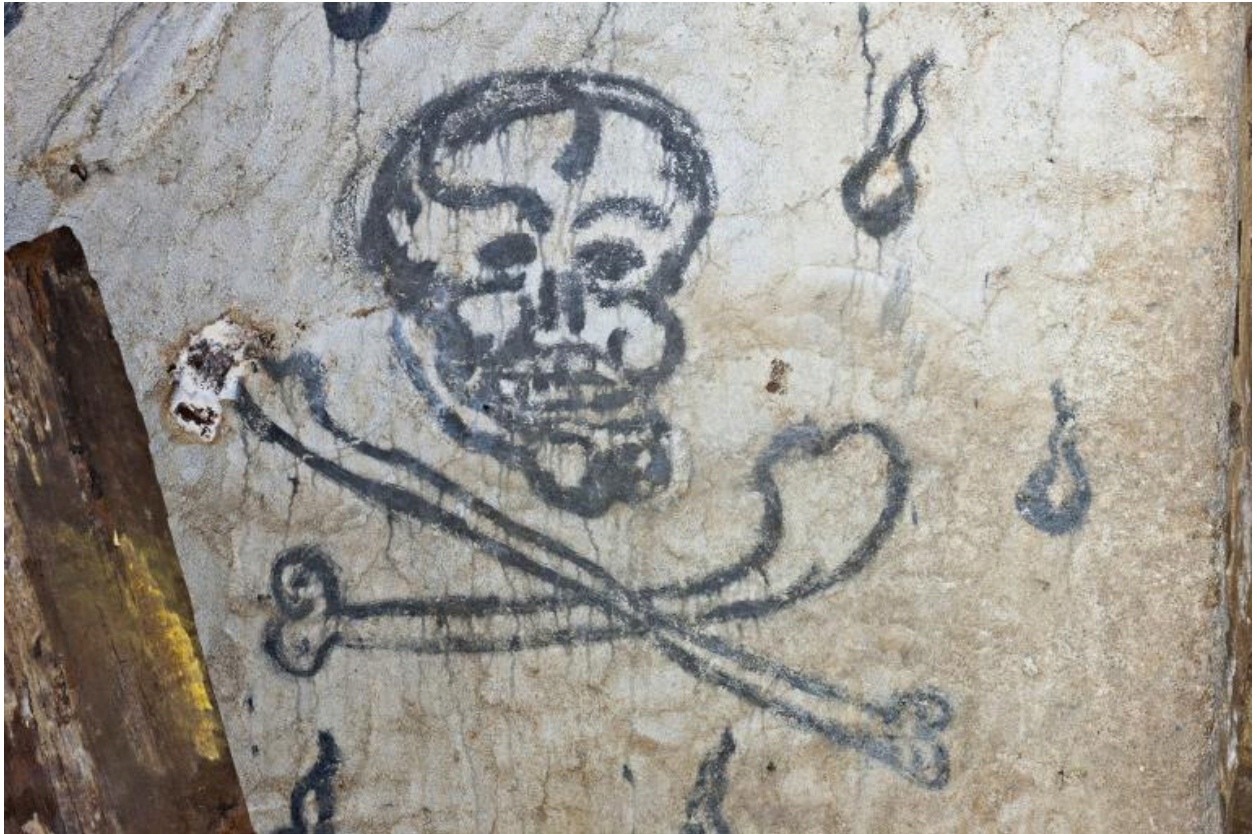
Mur ouest, partie sud. Crâne et tibias.