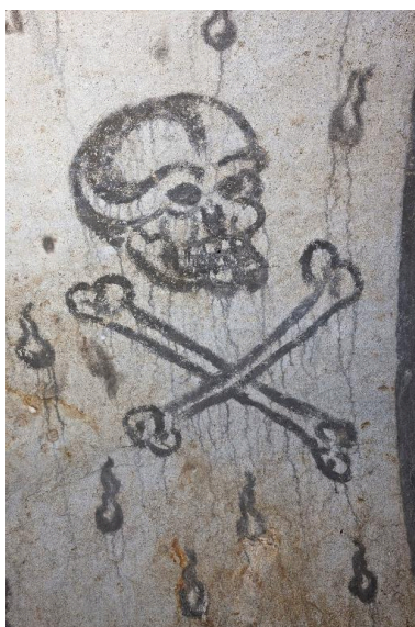
Paroi nord, partie ouest. Crâne et tibias. IVR52_20165300356NUCA