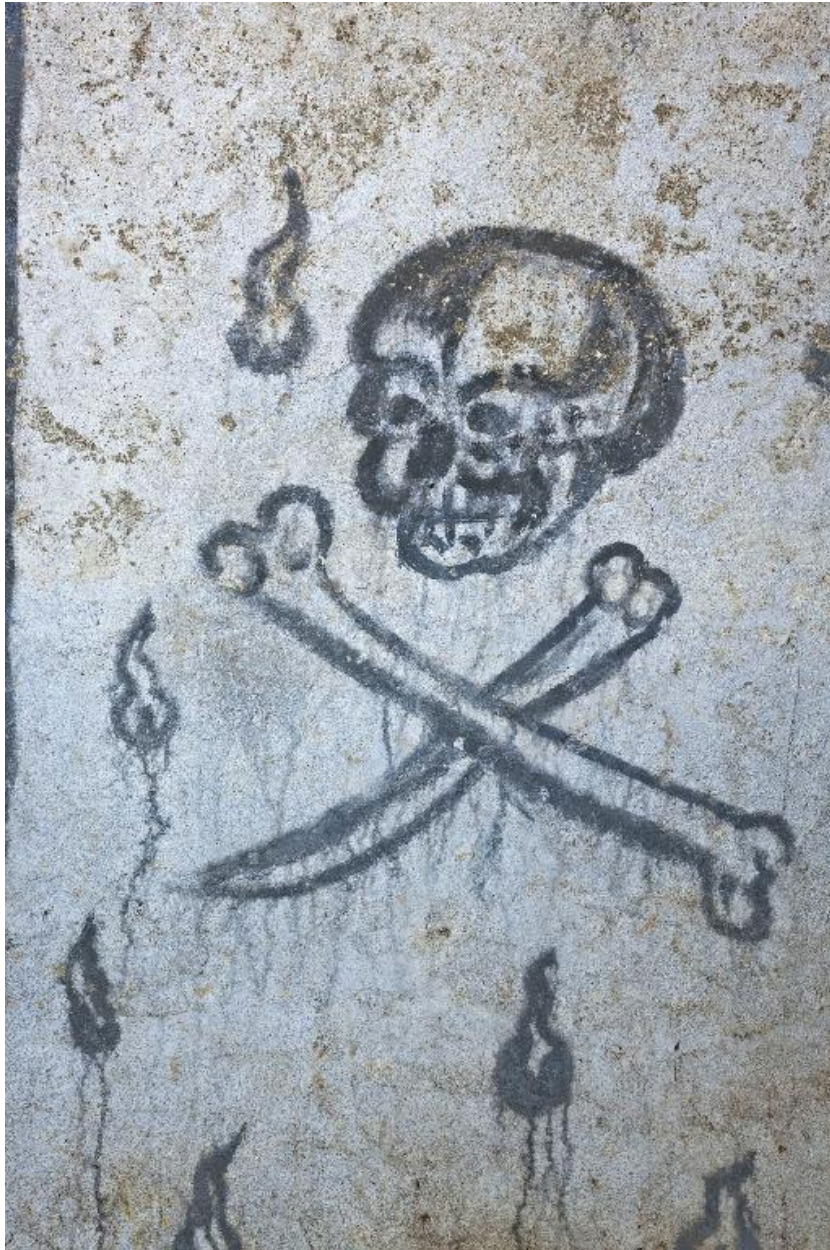
Paroi nord, partie est. Crâne et tibias.