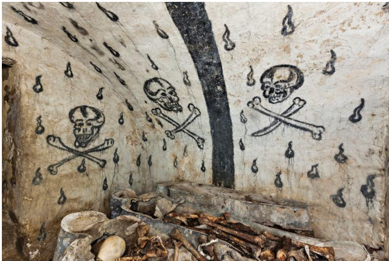
Vue d'ensemble vers le nord-ouest