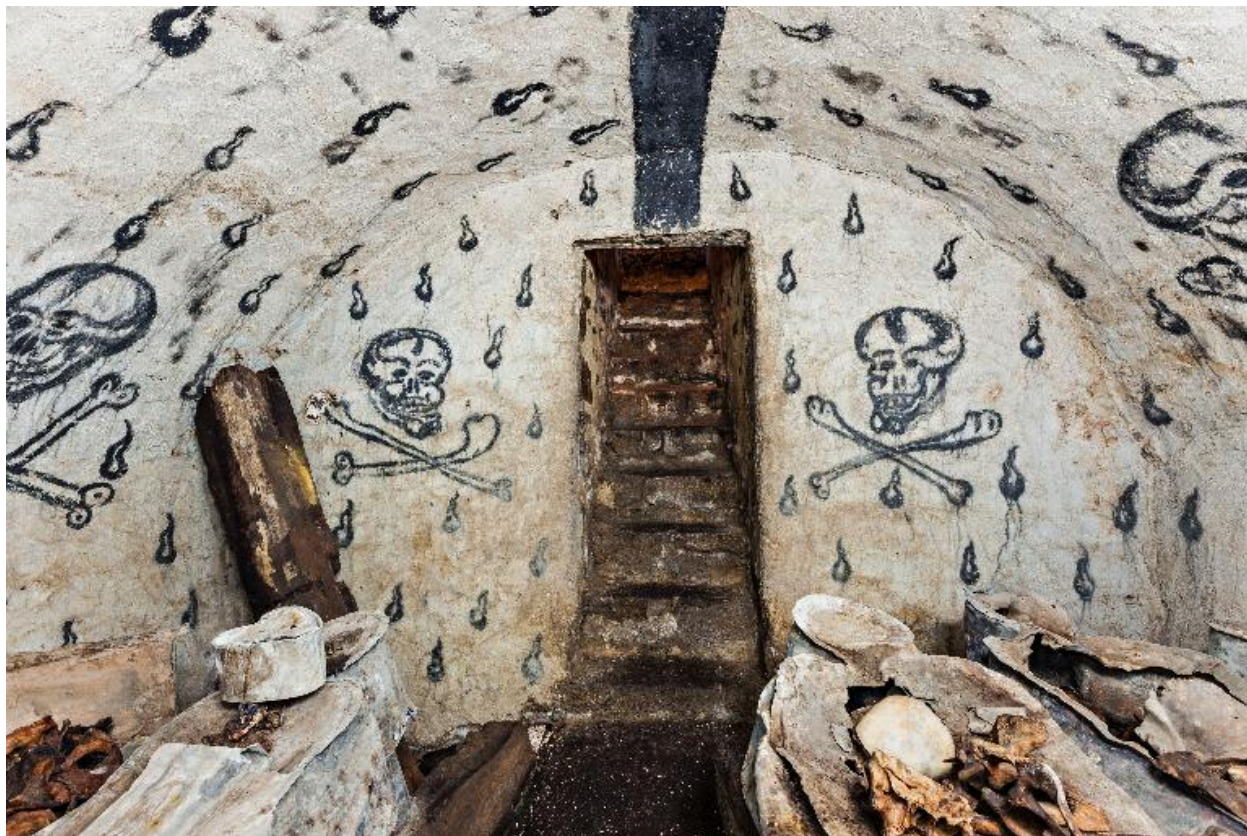
Vue d'ensemble vers l'ouest.