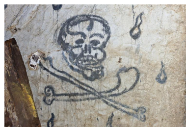
Mur ouest, partie sud. Crâne et tibias. IVR52_20165300360NUCA