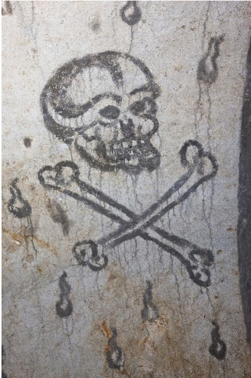
Paroi nord, partie ouest. Crâne et tibias.