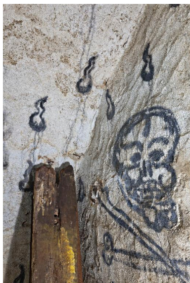
Angle sud-ouest. Marques des coups de truelles sur l'enduit et recouvrements des passes d'enduit dans l'angle. IVR52_20165300361NUCA