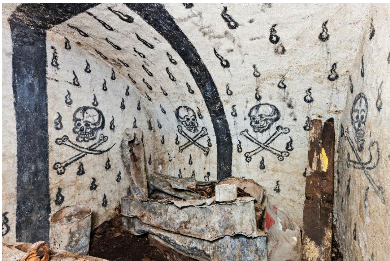
Vue d'ensemble vers le sud-est.