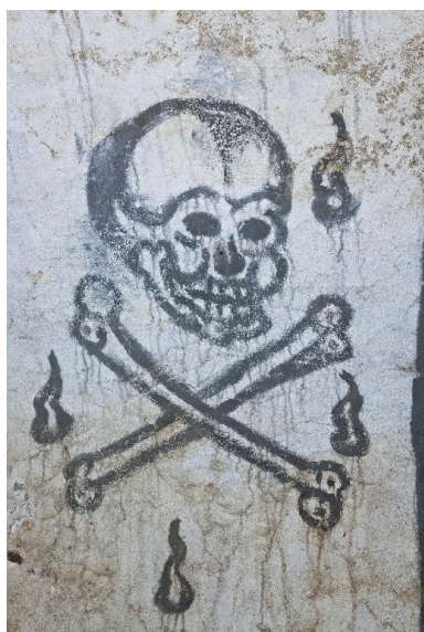
paroi sud, partie est. Crâne et tibias. IVR52_20165300357NUCA