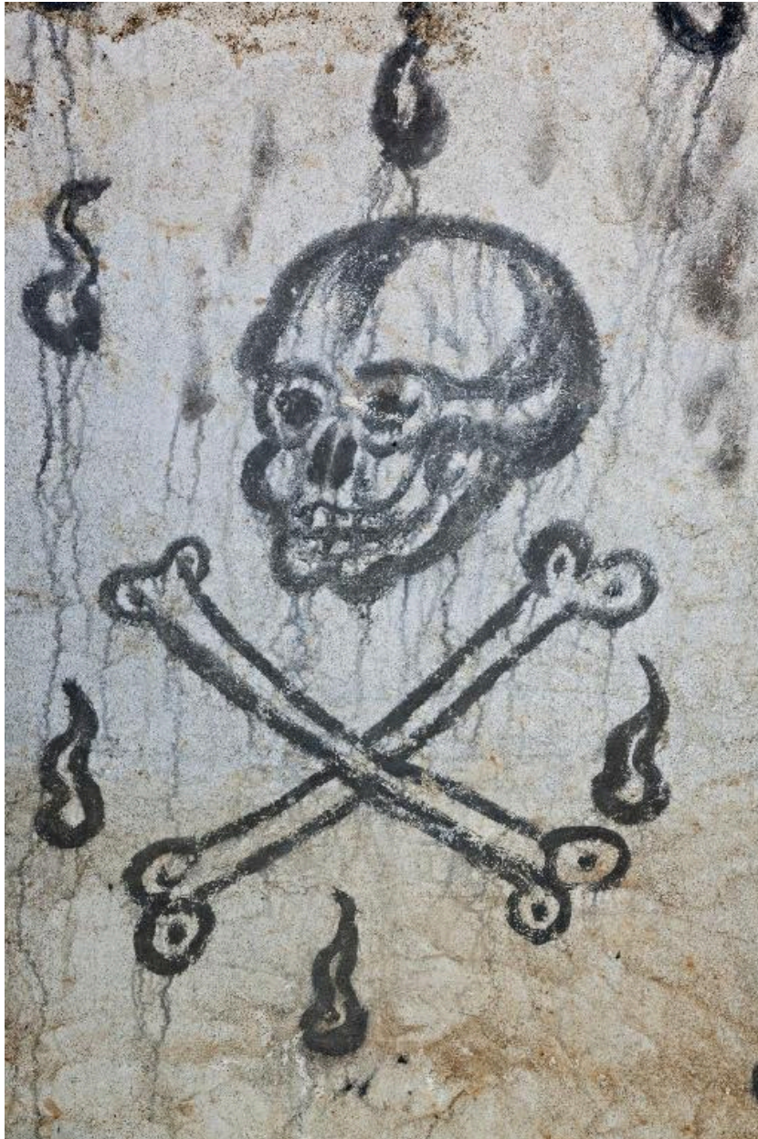
Paroi sud, partie ouest. Crâne et tibias.