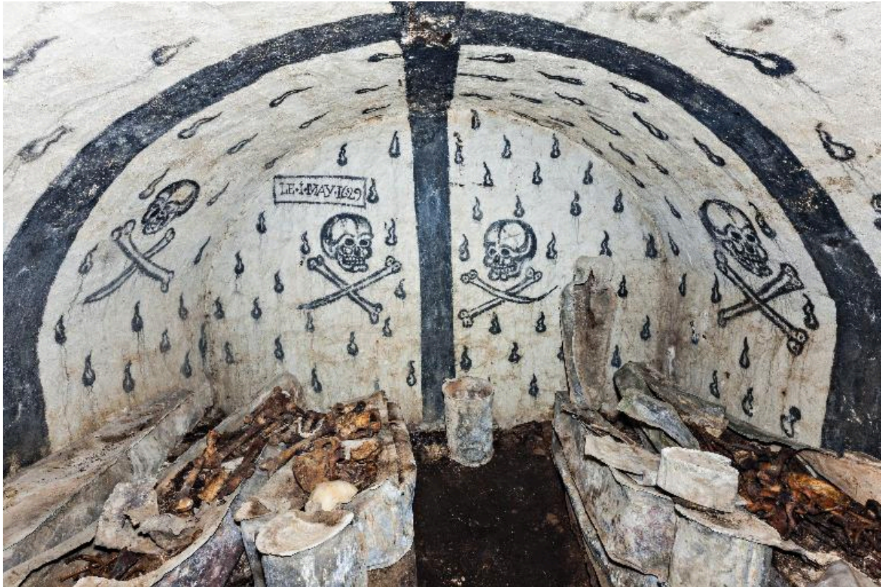
Vue d'ensemble vers l'est.