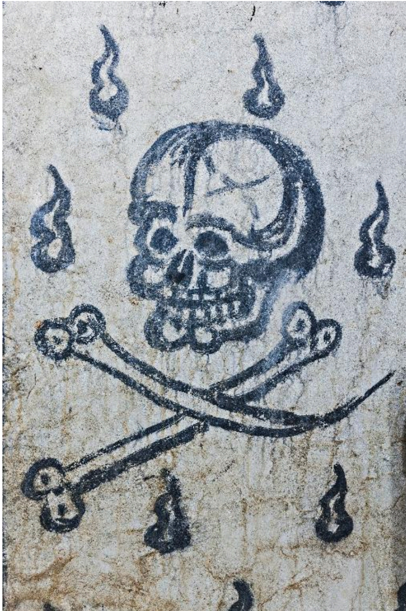
Mur est, partie sud. Crâne et tibias.