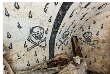
Vue d'ensemble vers le sud-ouest. IVR52_20165300350NUCA