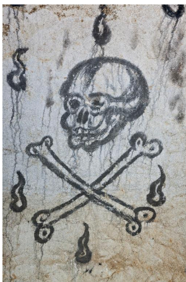
Paroi sud, partie ouest. Crâne et tibias. IVR52_20165300358NUCA