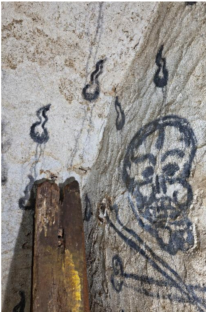
Angle sud-ouest. Marques des coups de truelles sur l'enduit et recouvrements des passes d'enduit dans l'angle.