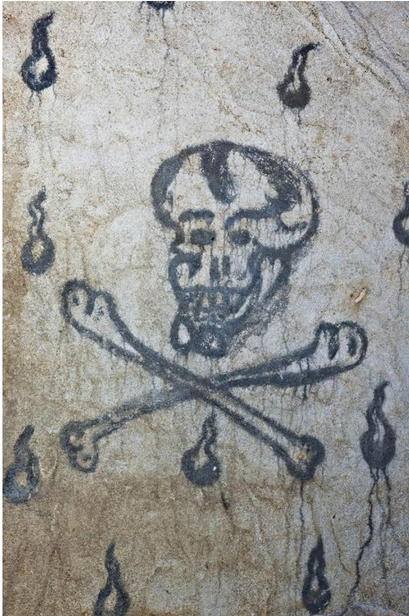
Mur ouest, partie nord. Crâne et tibias.