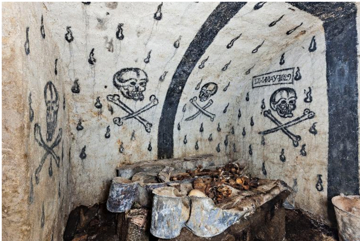
Vue d'ensemble vers le nord.