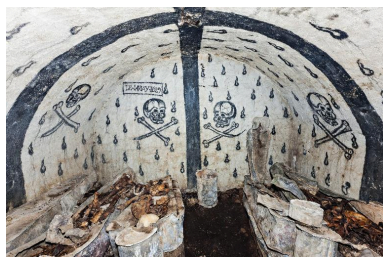
Vue d'ensemble vers l'est. IVR52_20165300348NUCA