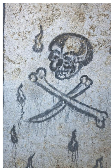
Paroi nord, partie est. Crâne et tibias. IVR52_20165300355NUCA