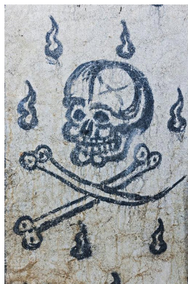
Mur est, partie sud. Crâne et tibias.