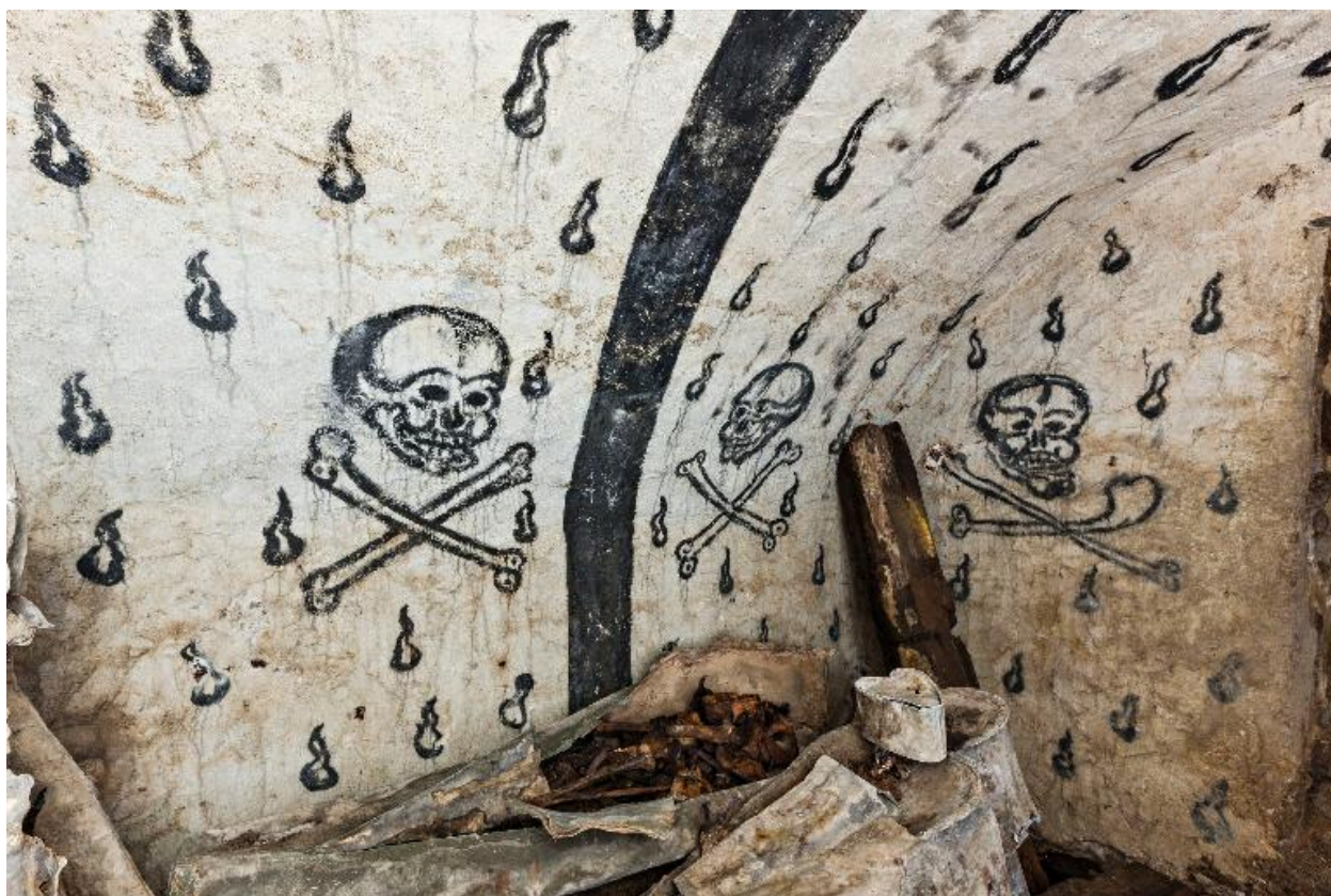
Vue d'ensemble vers le sud-ouest.