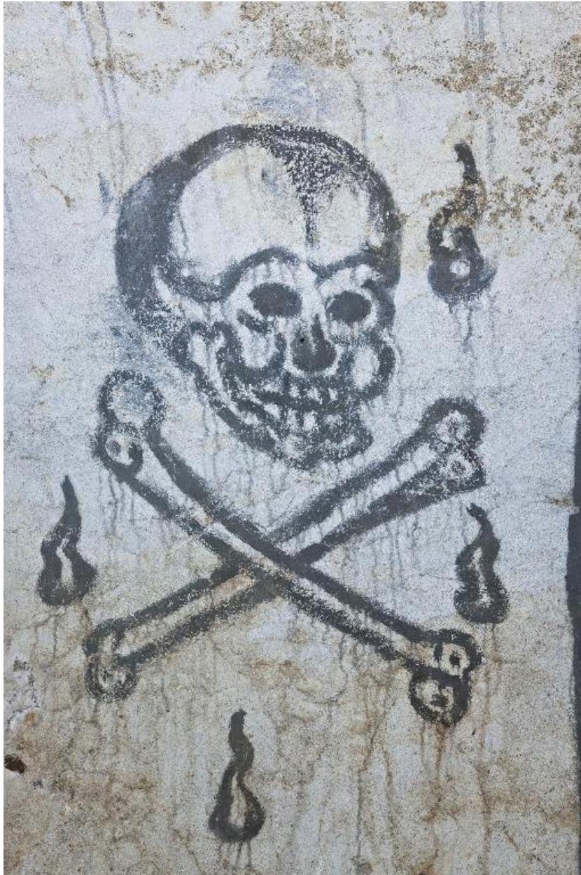
paroi sud, partie est. Crâne et tibias.