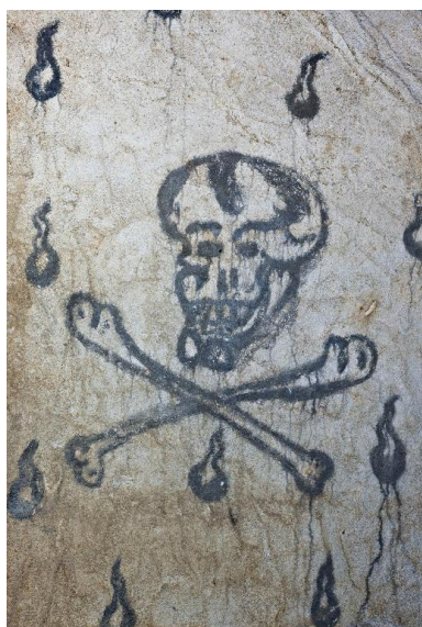
Mur ouest, partie nord. Crâne et tibias.