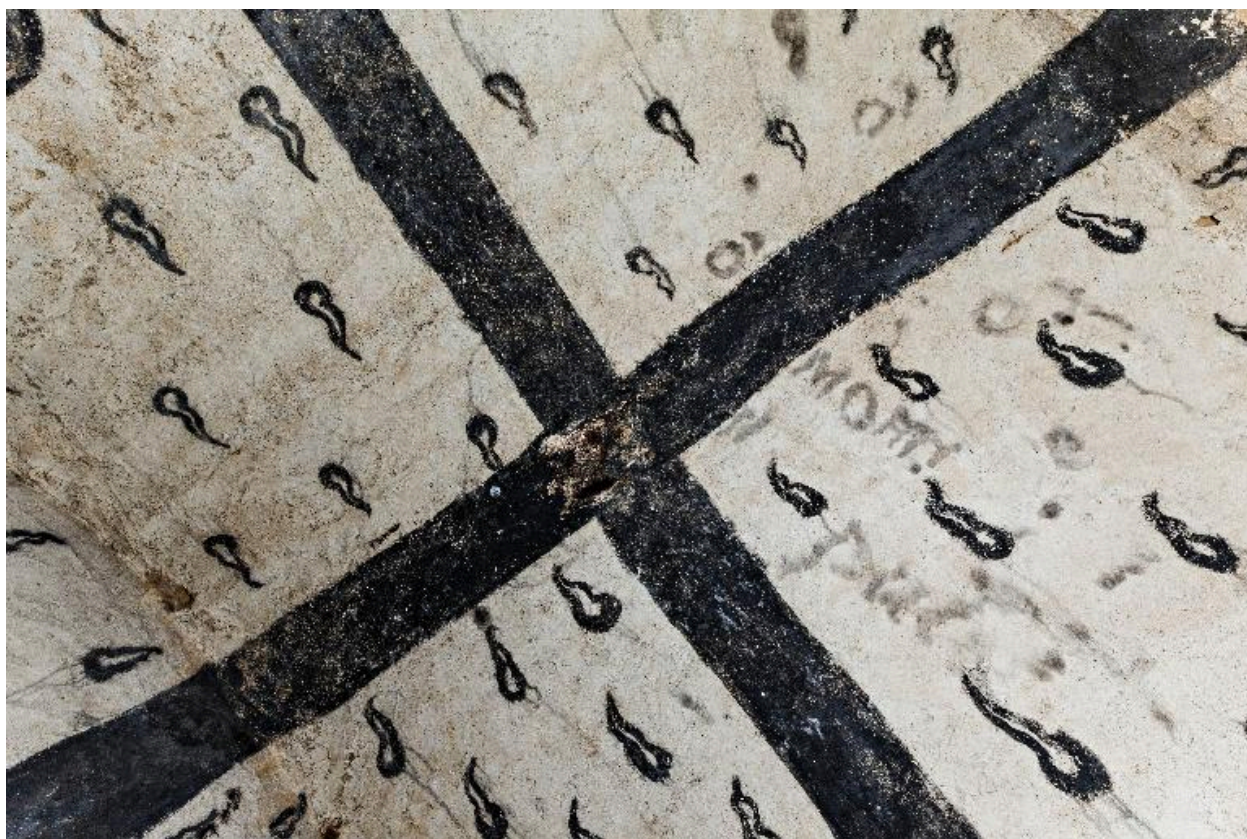
Vue d'ensemble de la voûte depuis l'angle nord-ouest.