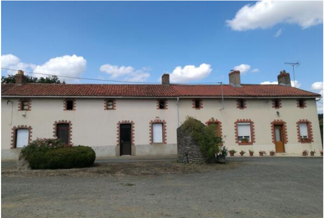
Ferme de la Challière. Vue des logis.