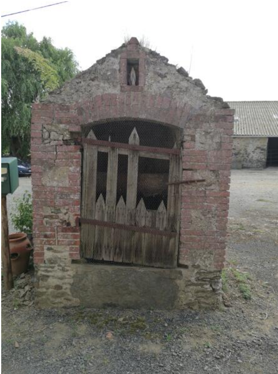
Ferme de la Challière. Vue du puits.