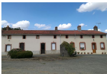
Ferme de la Challière. Vue des logis.