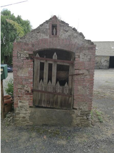
Ferme de la Challière. Vue du puits.