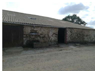
Ferme de la Challière. Vue de l'étable. IVR52_20244901175NUCA