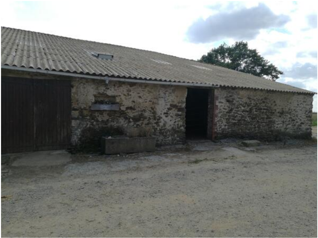
Ferme de la Challière. Vue de l'étable.