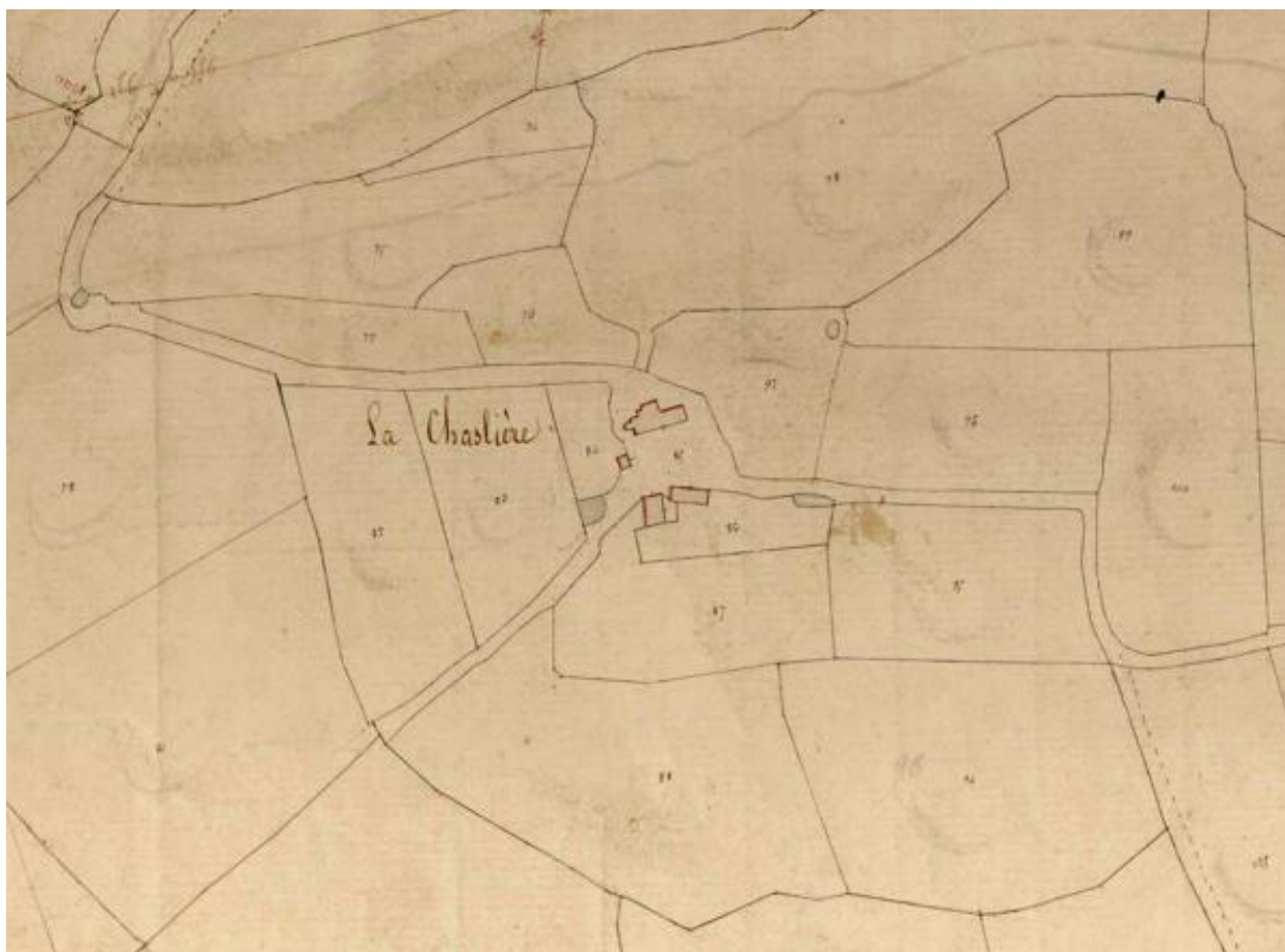
La Challière. Extrait du plan cadastral de 1827, section B1. (Archives départementales de Maine-et-Loire, 3 P 4/24/4).