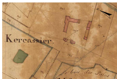
Extrait du plan cadastral de 1819, section D2, parcelle n° 393. IVR52_20084404164NUCA