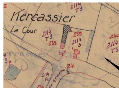
Extrait du plan cadastral réformé de 1962, section D2, parcelle n° 239. IVR52_20054401657NUCA