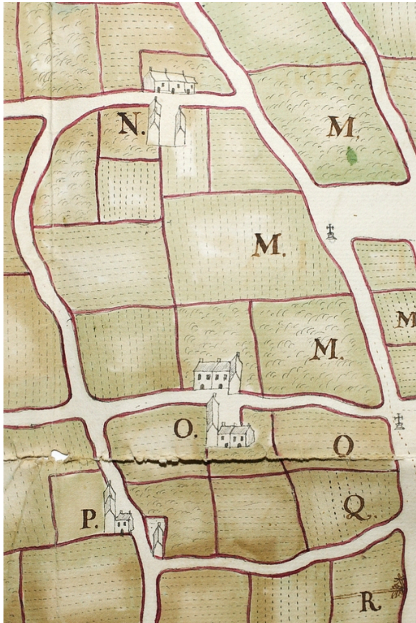
Maison et terre de Kercassié, fief du Roi. (P). Plan terrier toisé et dessiné par V. Lhermite du Croisic. 1753.