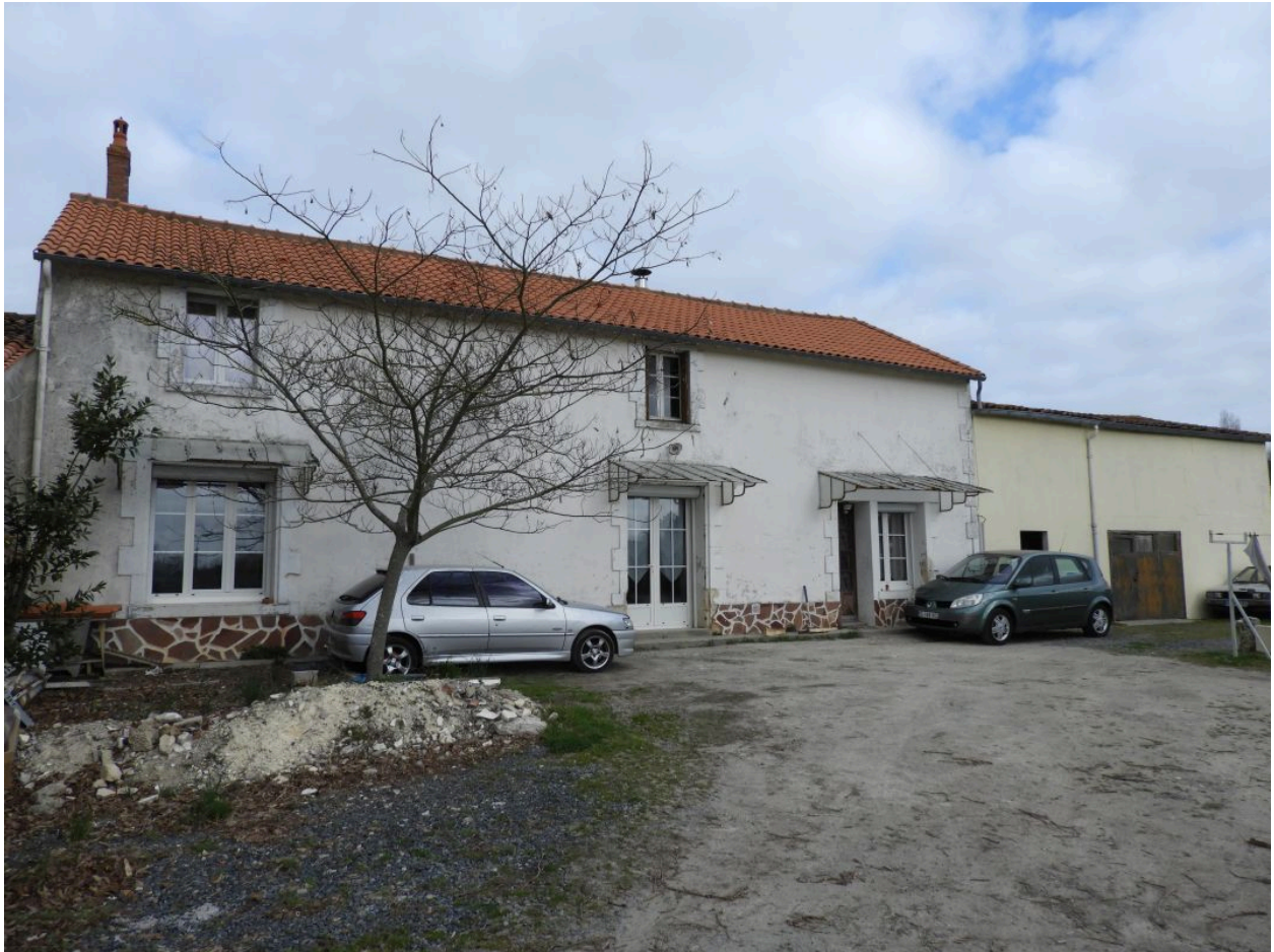
L'ancienne laiterie vue depuis le sud.