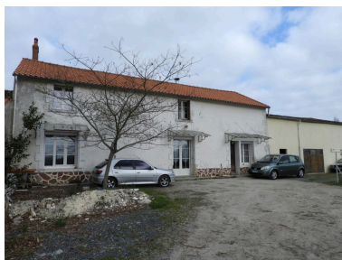
L'ancienne laiterie vue depuis le sud.