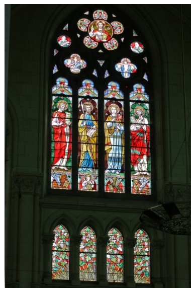
Vue d'ensemble de la verrière. IVR52_20065300392NUCA