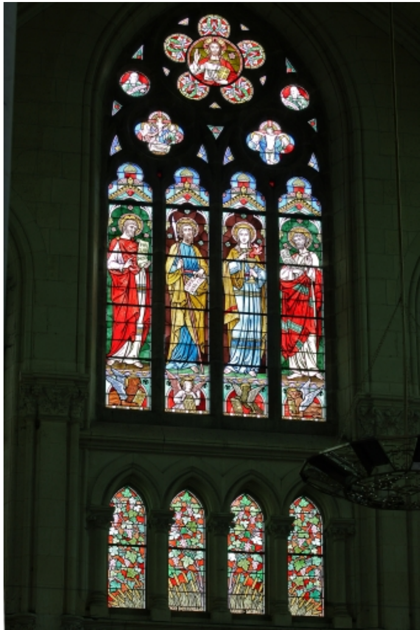
Vue d'ensemble de la verrière.