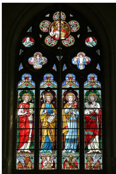
Partie supérieure de la verrière : les évangélistes.