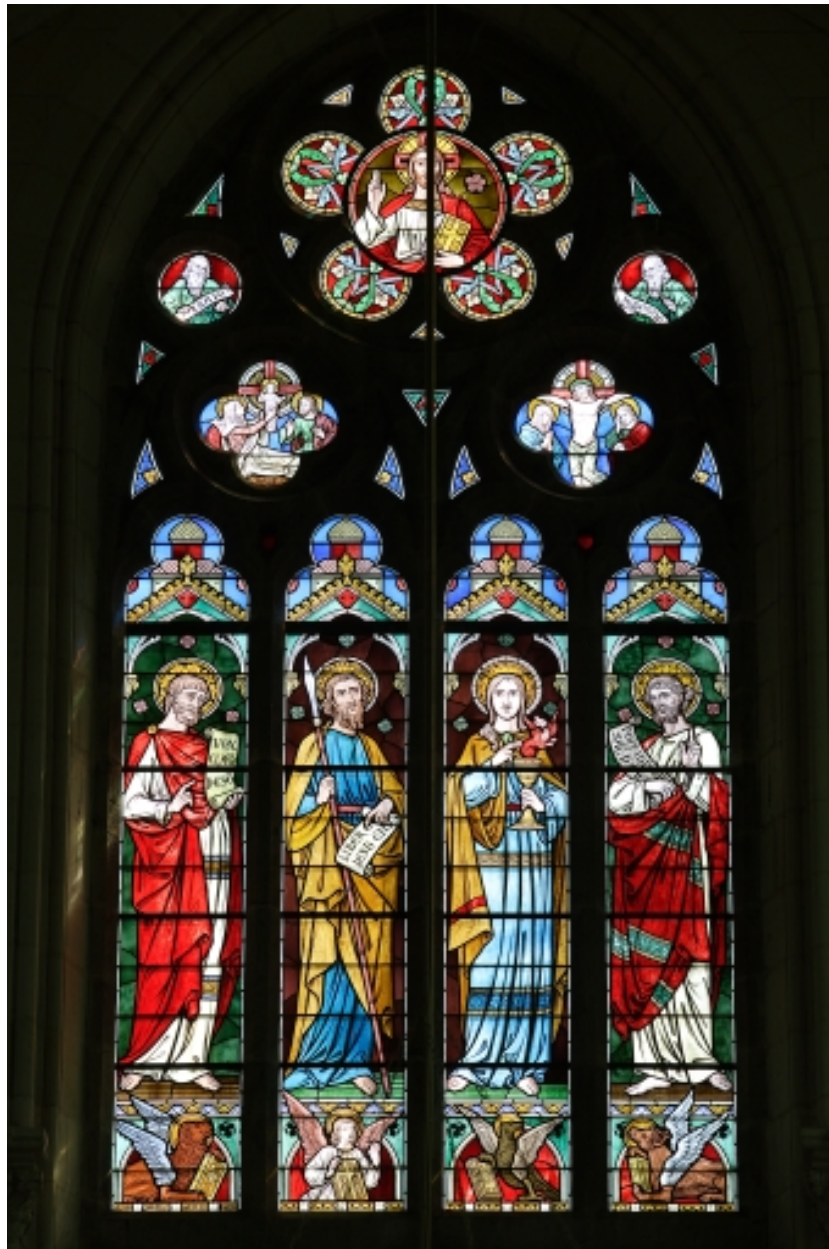
Partie supérieure de la verrière : les évangélistes.