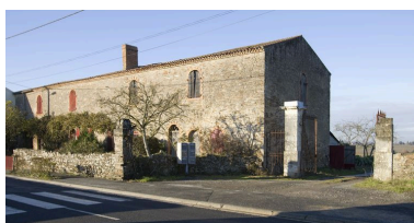
La borderie et l'entrée de la Cantrie.