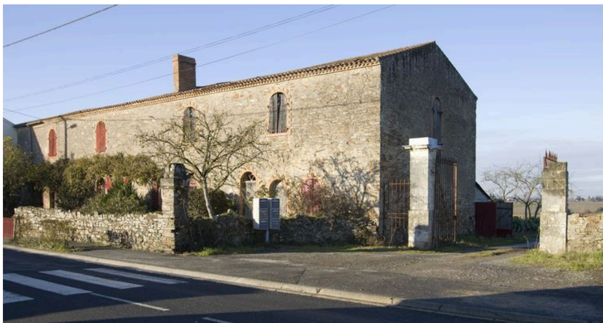
La borderie et l'entrée de la Cantrie.