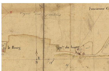
Cadastre 1827, section A dite de la Cantrie. IVR52_20104403074NUCA