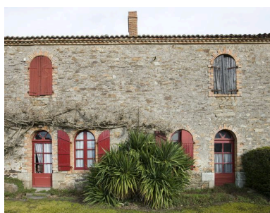
Détail des ouvertures. IVR52_20114400098NUCA