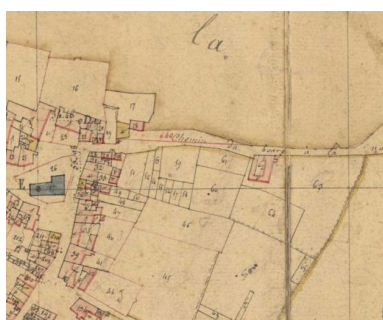
Cadastre 1827, section B dite du bourg. IVR52_20104403073NUCA