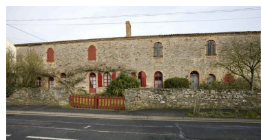
La borderie de la Barrière, maison double. IVR52_20114400097NUCA