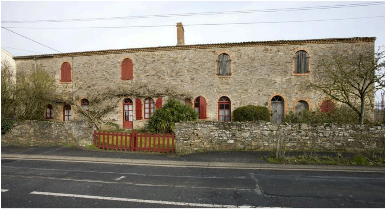
La borderie de la Barrière, maison double.