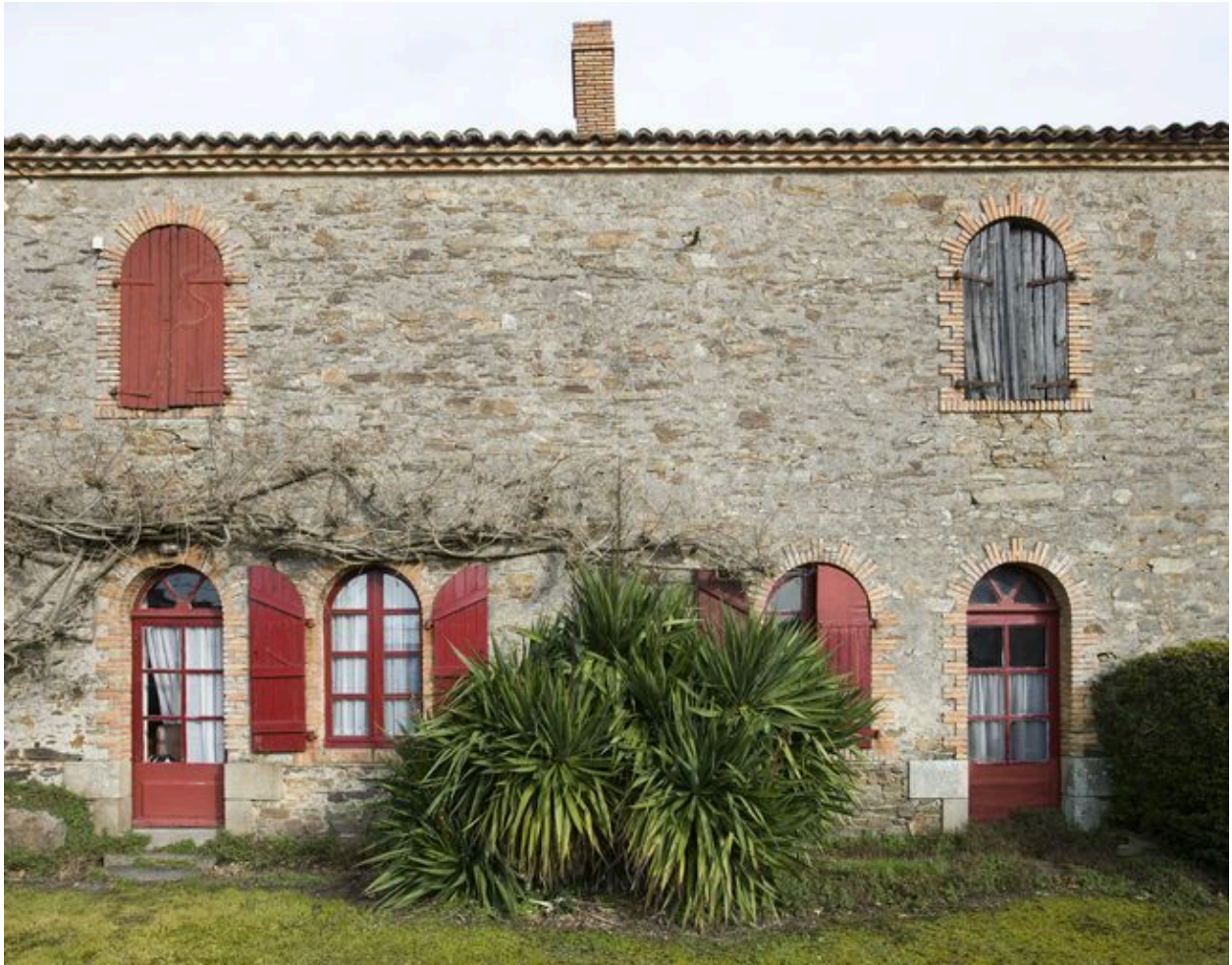
Détail des ouvertures.