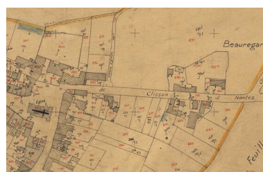
Cadastre rénové 1952. IVR52_20104403075NUCA