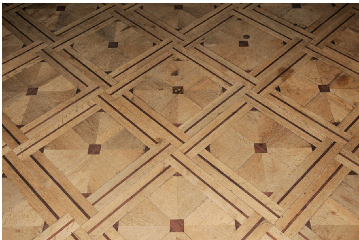
Détail du parquet du vestibule.