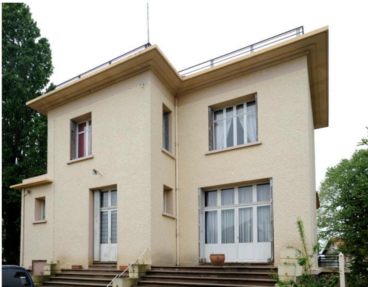
Maison d'Auguste Repussard : façade sud-est.