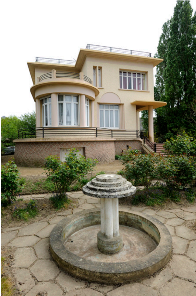
Maison d'Auguste Repussard et son jardin, vue depuis le nord-ouest.