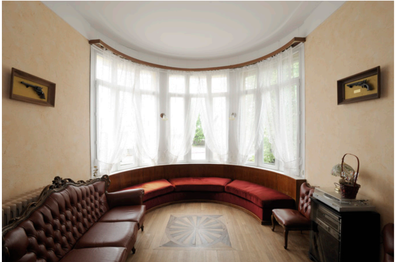
Pièce de réception : le bow-window.