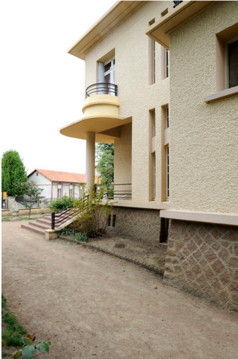
Maison d'Auguste Repussard : façade sud-ouest.