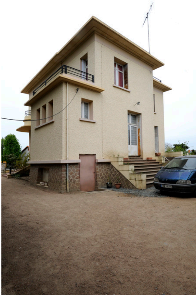
Maison d'Auguste Repussard : façade nord-est.