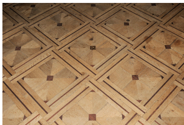
Détail du parquet du vestibule. IVR52_20114900166NUCA