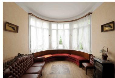
Pièce de réception : le bow-window. IVR52_20114900162NUCA