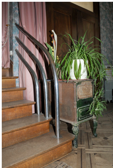
Escalier situé dans le vestibule.