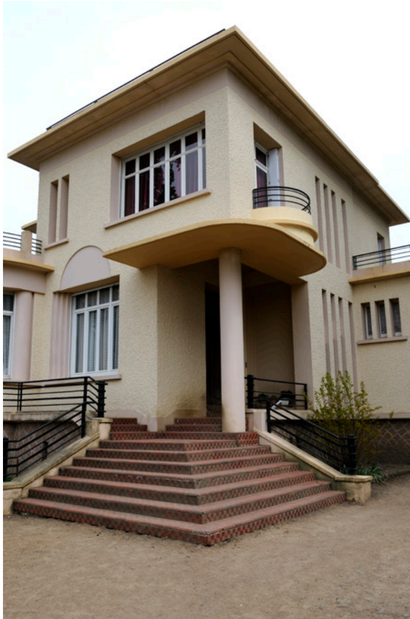
Maison d'Auguste Repussard : entrée principale.