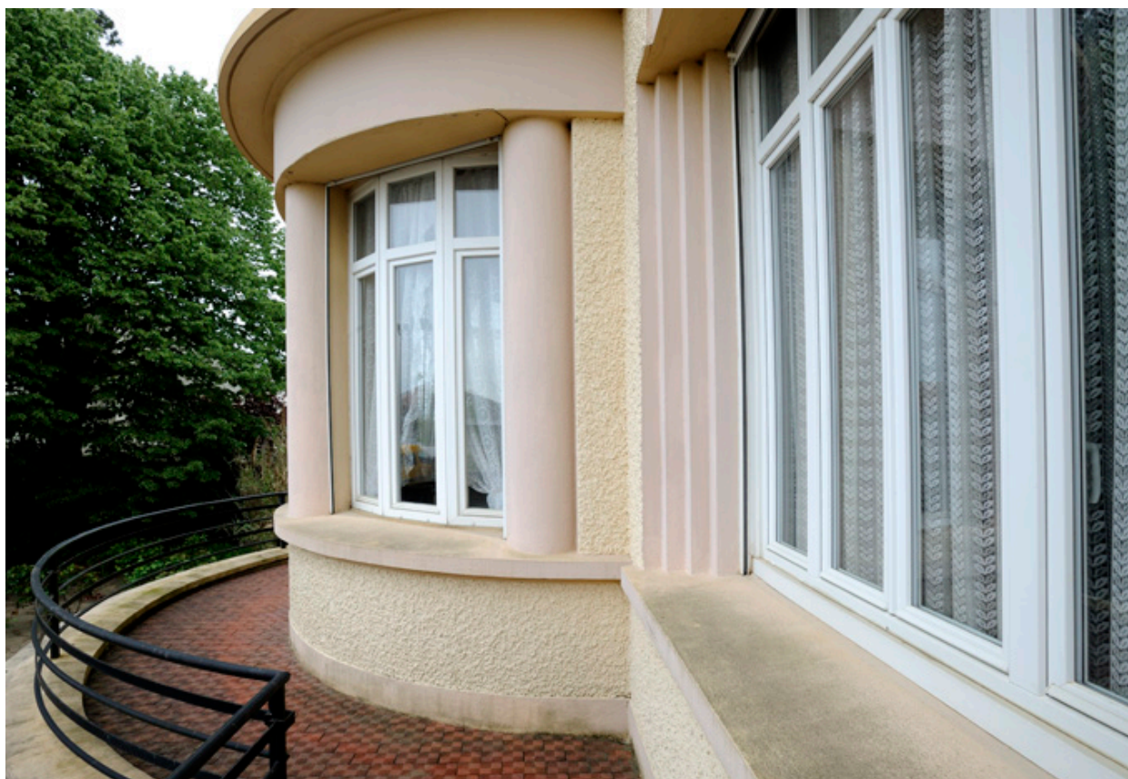
Maison d'Auguste Repussard : le bow-window.