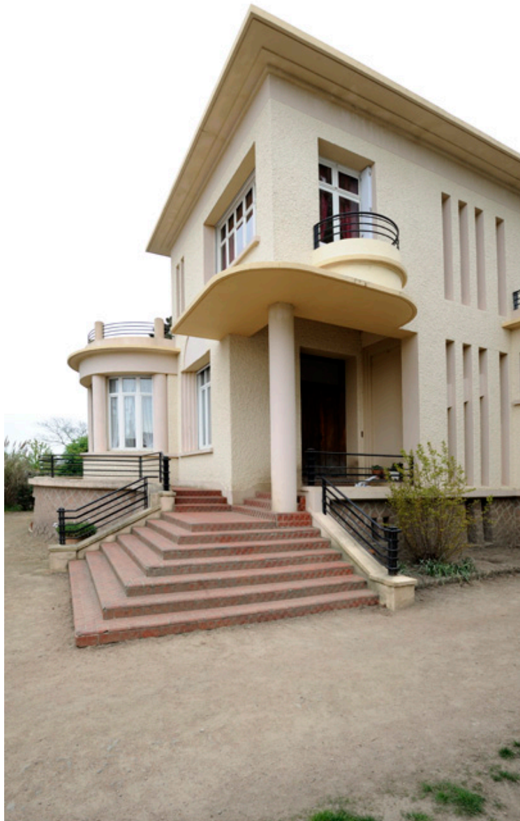
Maison d'Auguste Repussard : détail du perron.