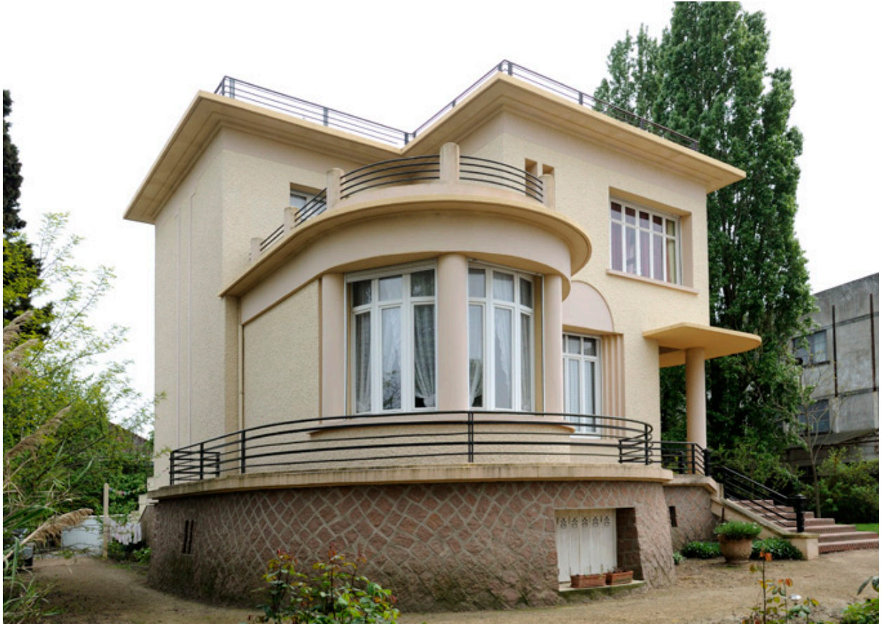
Maison d'Auguste Repussard, vue depuis le nord-ouest.