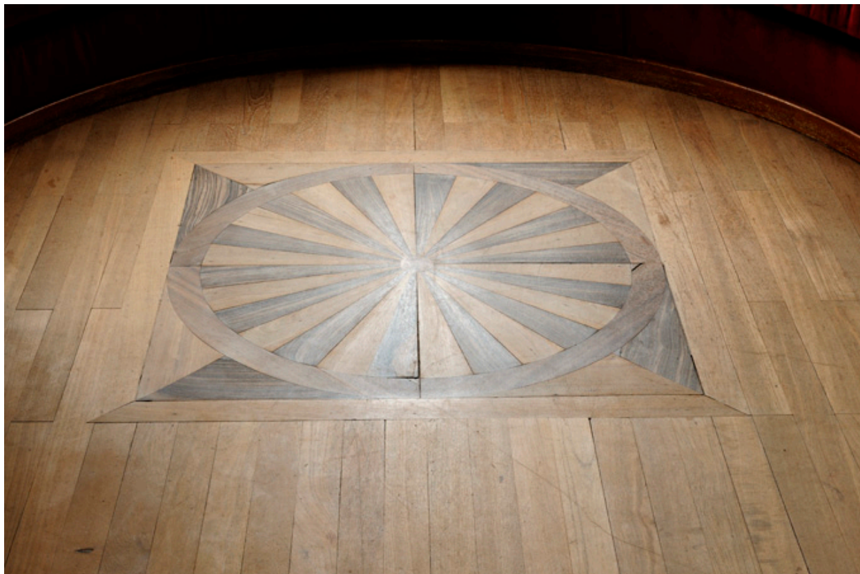
Pièce de réception : détail du parquet.