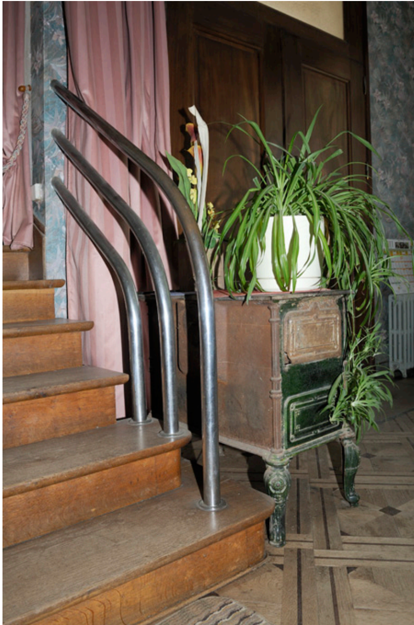
Escalier situé dans le vestibule.