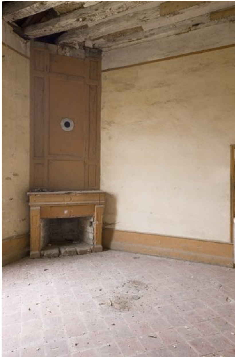
Porte d'entrée en bois, décorée de motifs floraux.