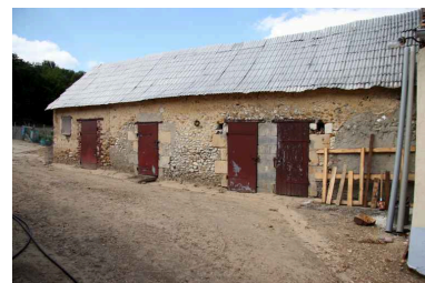
Les toits à poutres. IVR52_20067206984NUCA