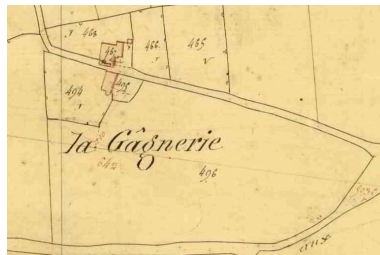
Plan de situation en 1846.