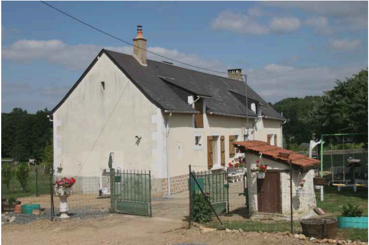
La première maison limite XVIIIe-XIXe siècle.