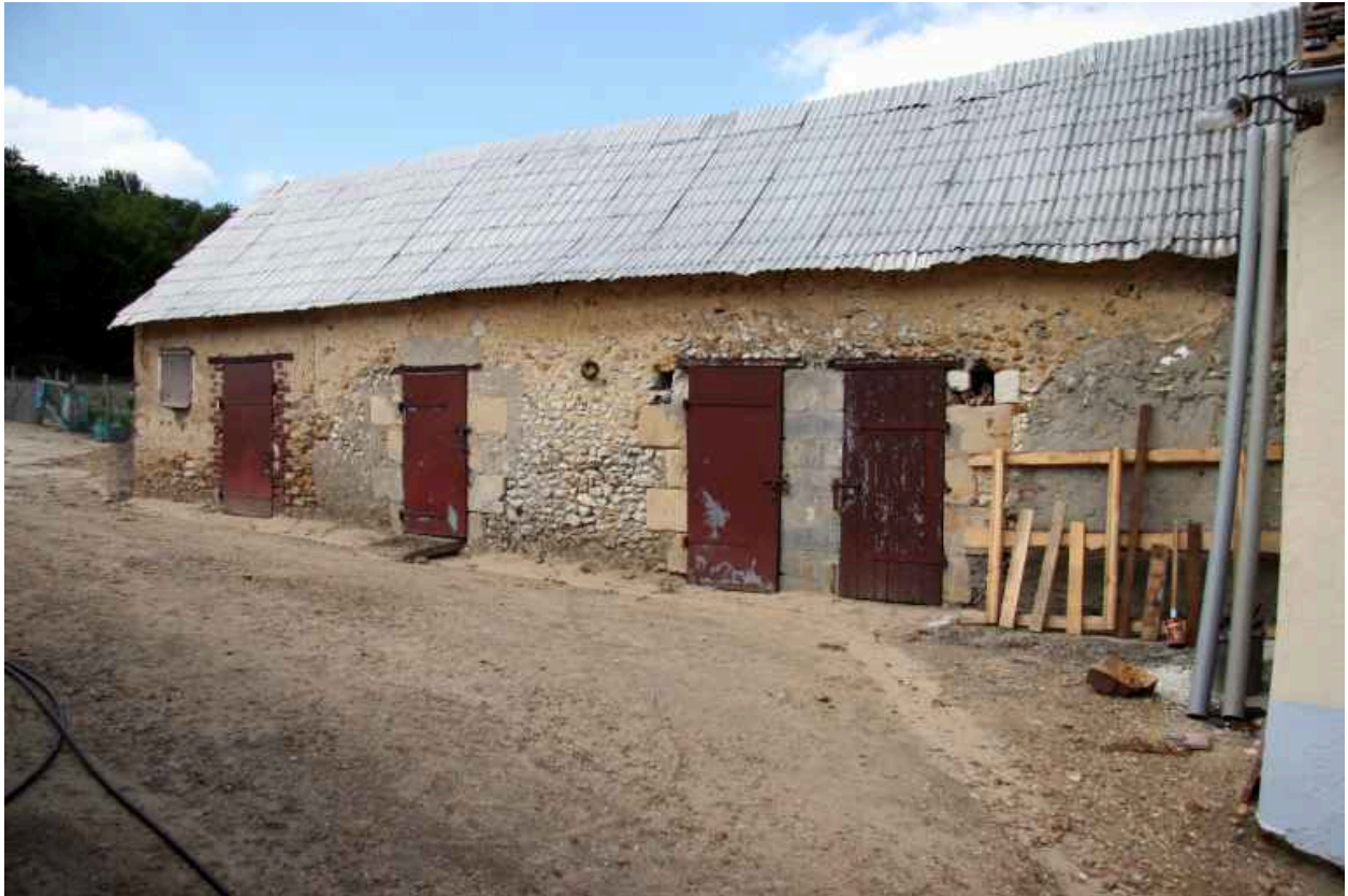
Les toits à porcs.