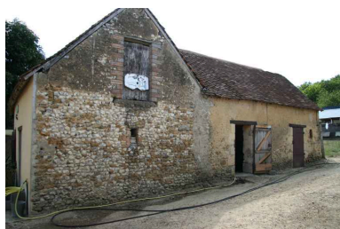
Les dépendances. IVR52_20067206985NUCA