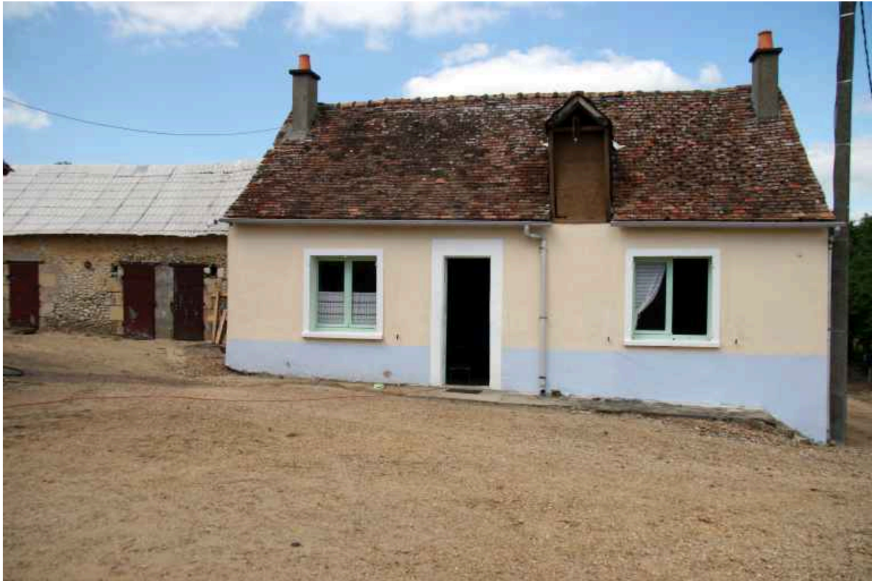
La deuxième maison construite au milieu du XIXe siècle.