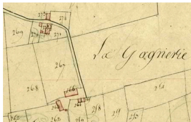
Plan de situation en 1811. IVR52_20057204220NUCA