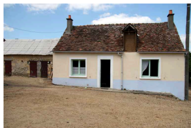
La deuxième maison construite au milieu du XIXe siècle. IVR52_20067206982NUCA