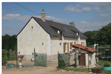
La première maison limite XVIIIe-XIXe siècle.