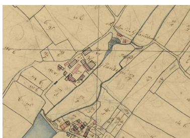
Superposition des cadastres actuel et napoléonien : manoir de Glandsemé, étang et moulin.

Dess. Marion Seure IVR52_20205300217NUDA