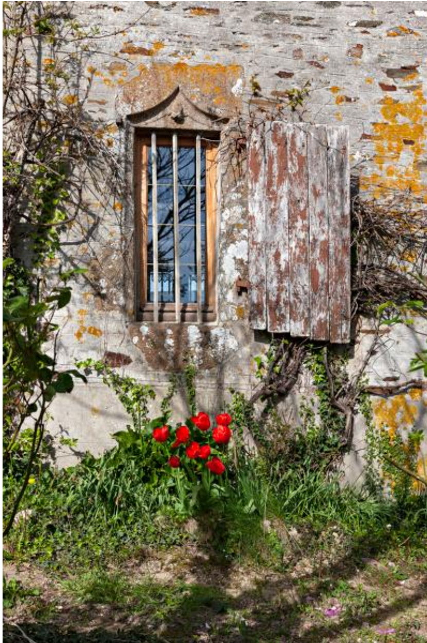
Fenêtre du rez-de-chaussée de la façade nord du manoir de Glandsemé.