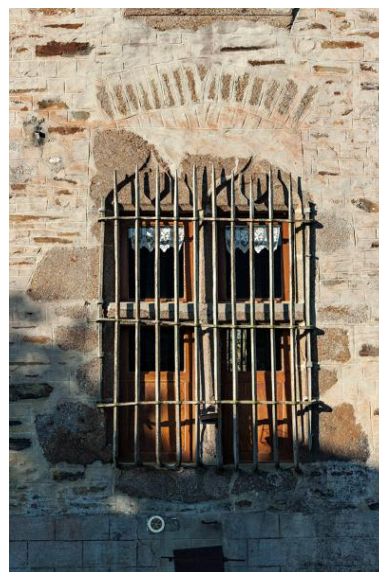
Croisée du rez-de-chaussée de la façade nord. IVR52_20195300518NUCA