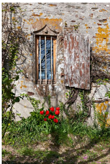
Fenêtre du rez-de-chaussée de la façade nord du manoir de Glandsemé. IVR52_20195300458NUCA