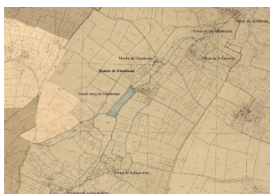
Répartition des villages et fermes dépendant du manoir du Glandsemé le long de la rivière du Glandsemé, sur le cadastre napoléonien.

Dess. Marion Seure IVR52_20205300217NUDA