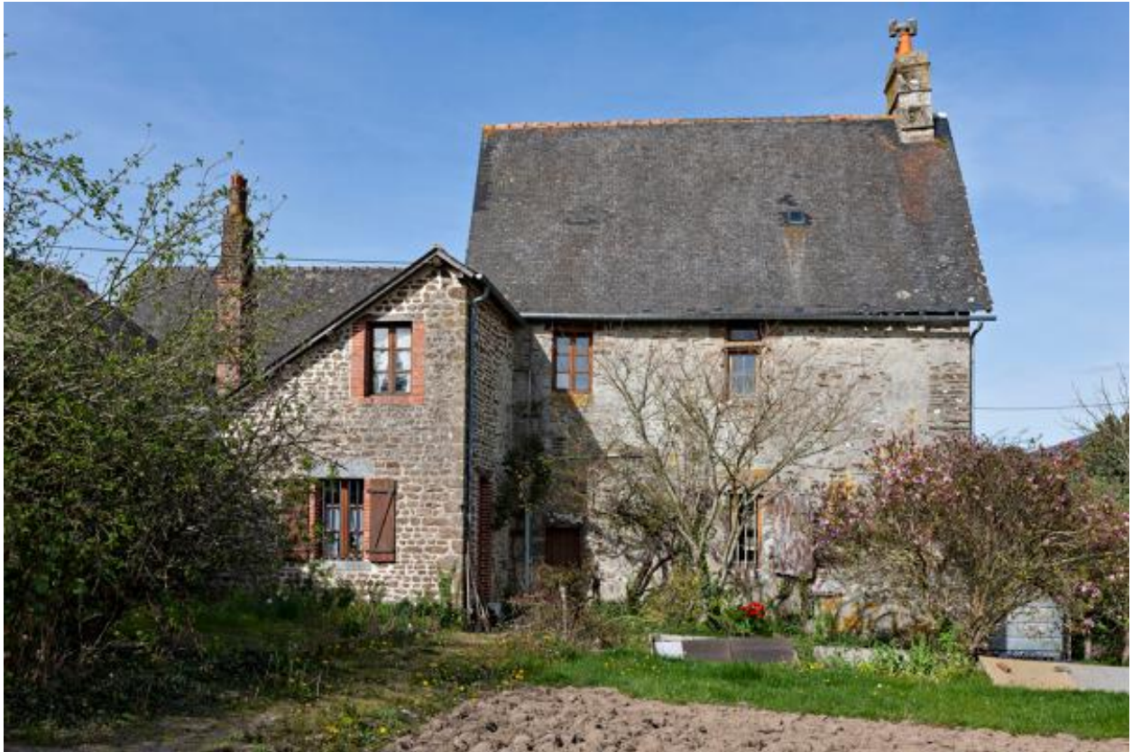
Façade nord du manoir de Glandsemé.