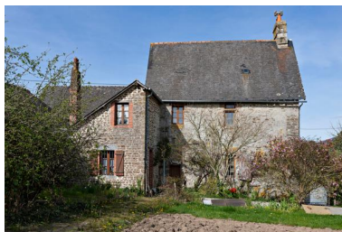
Façade nord du manoir de Glandsemé. IVR52_20195300457NUCA