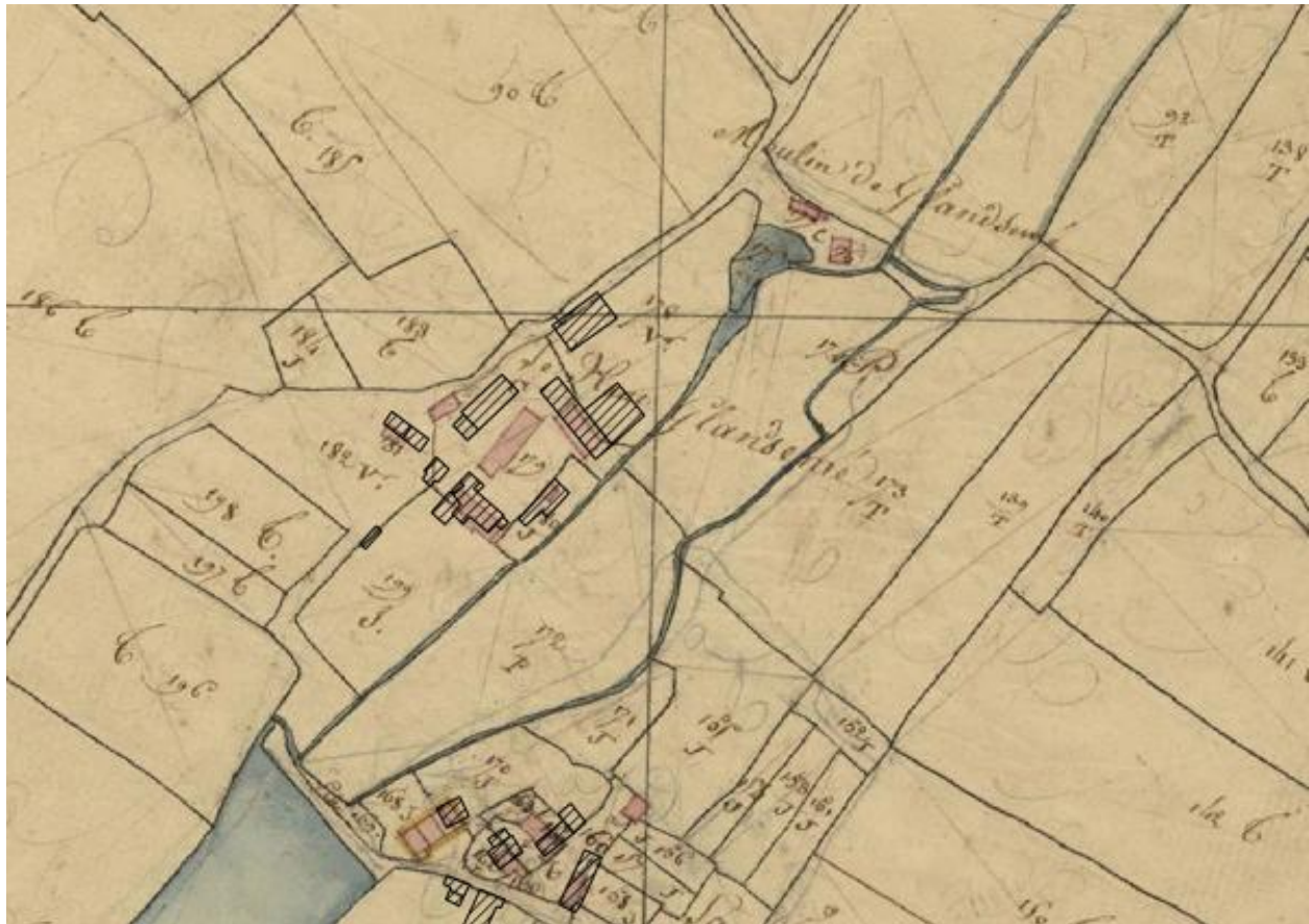
Superposition des cadastres actuel et napoléonien : manoir de Glandsemé, étang et moulin.