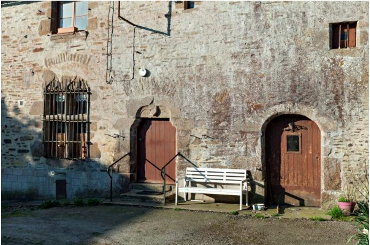
Rez-de-chaussée de la façade sud du manoir de Glandsemé.