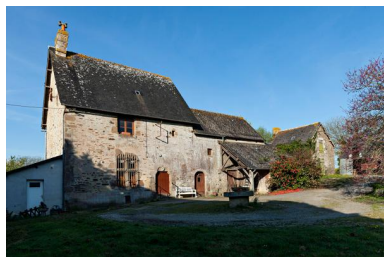
Façade sud du manoir de Glandsemé.