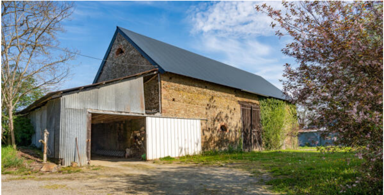
Manoir du Haut-Glandsemé, grange fermant la cour au nord-ouest