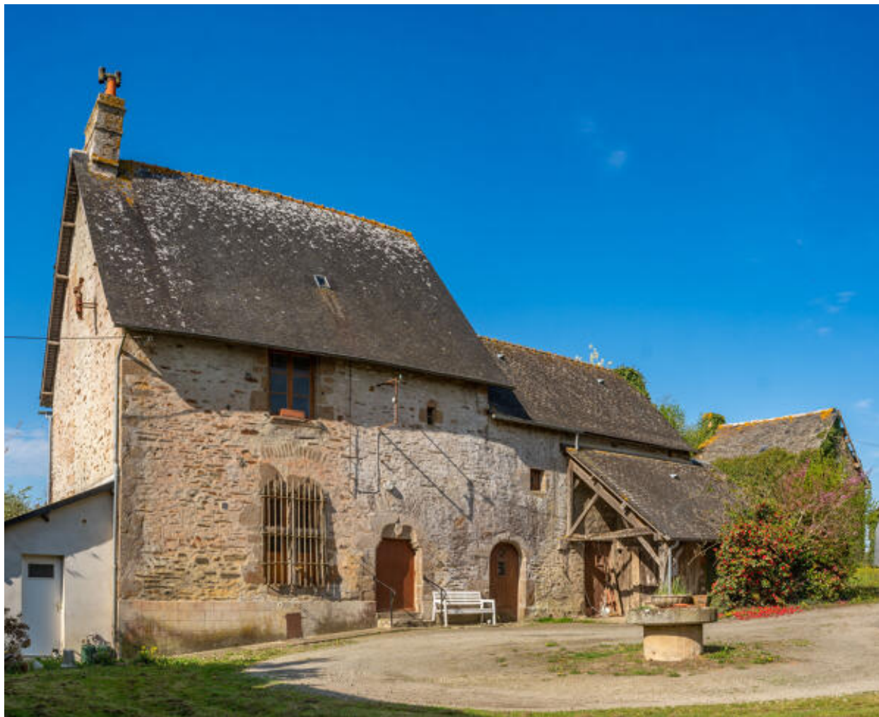
Manoir du Haut-Glandsemé, vue d'ensemble