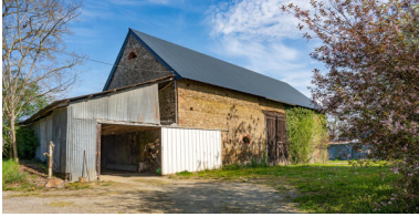
Manoir du Haut-Glandsemé, grange fermant la cour au nord-ouest IVR52_20225300628NUCA