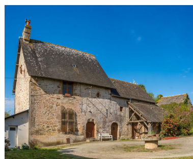
Manoir du Haut-Glandsemé, vue d'ensemble