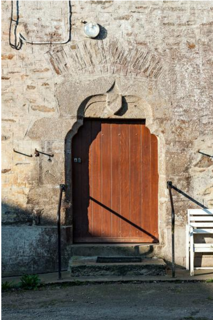
Porte de la façade nord.