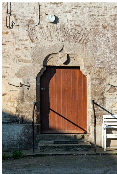
Porte de la façade nord.