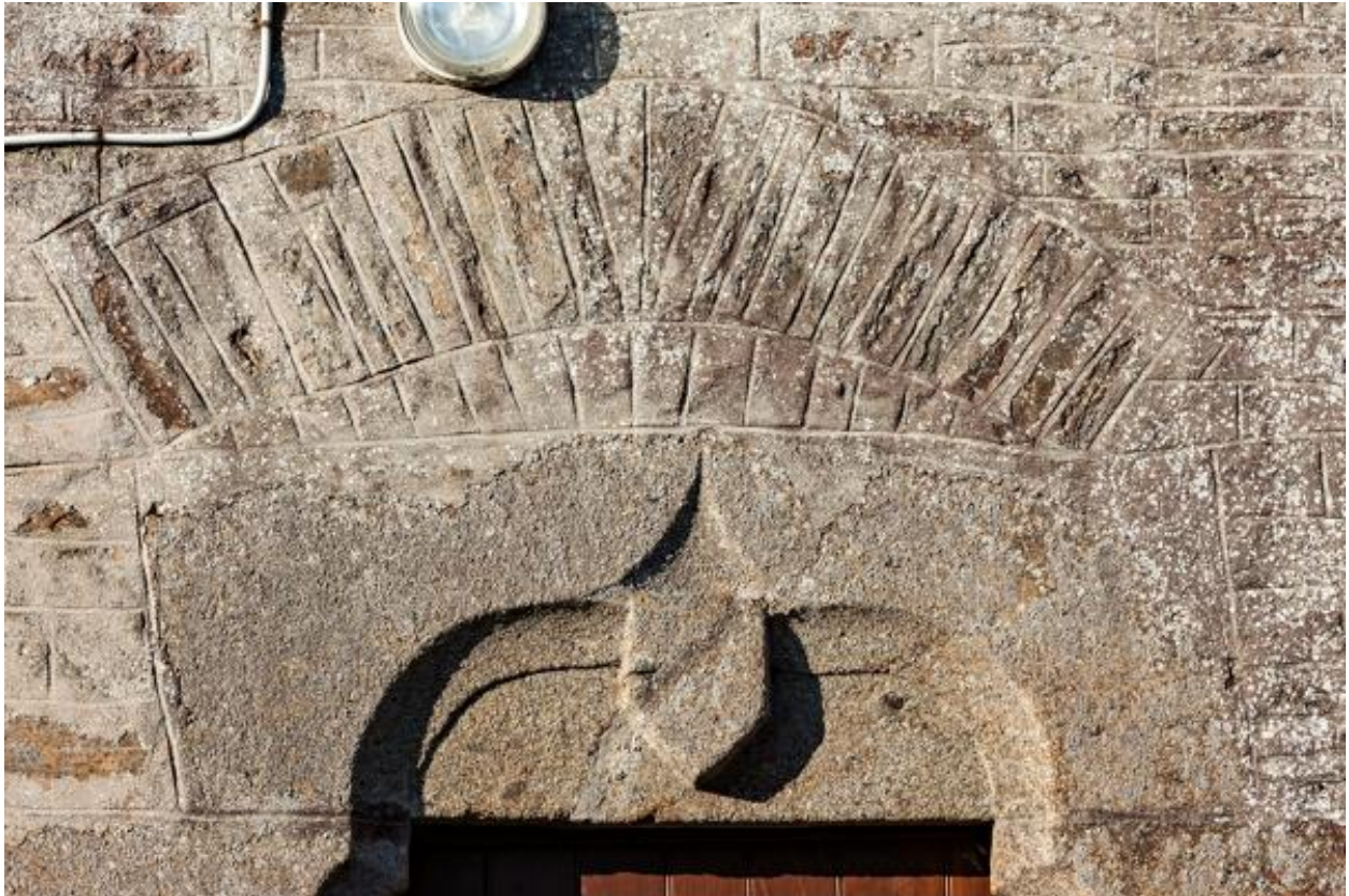
Détail de l'écu fruste et de l'accolade du linteau de la porte nord.