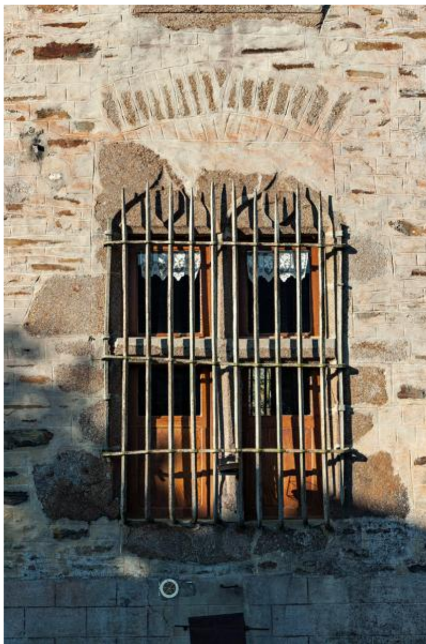
Croisée du rez-de-chaussée de la façade nord.