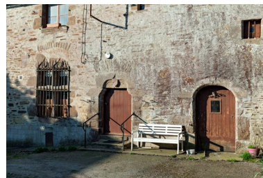
Rez-de-chaussée de la façade sud du manoir de Glandsemé. IVR52_20195300521NUCA