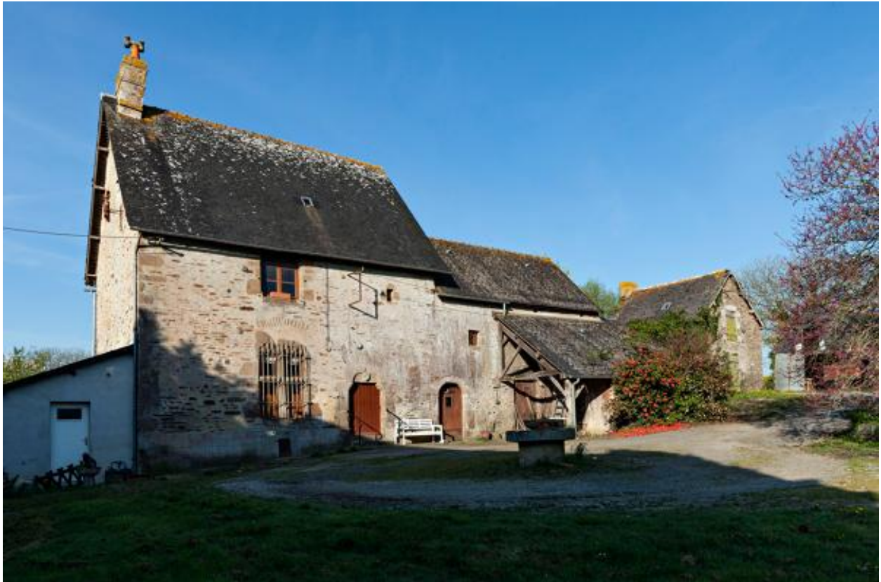
Façade sud du manoir de Glandsemé.