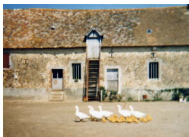
Photographie, années 1960 : le logis-étable. Autr. Yves Bellayer, Phot. François Lasa