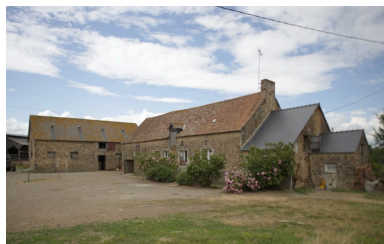
L'étable à vaches- grange et le logis-étable. IVR52_20055301976NUCA