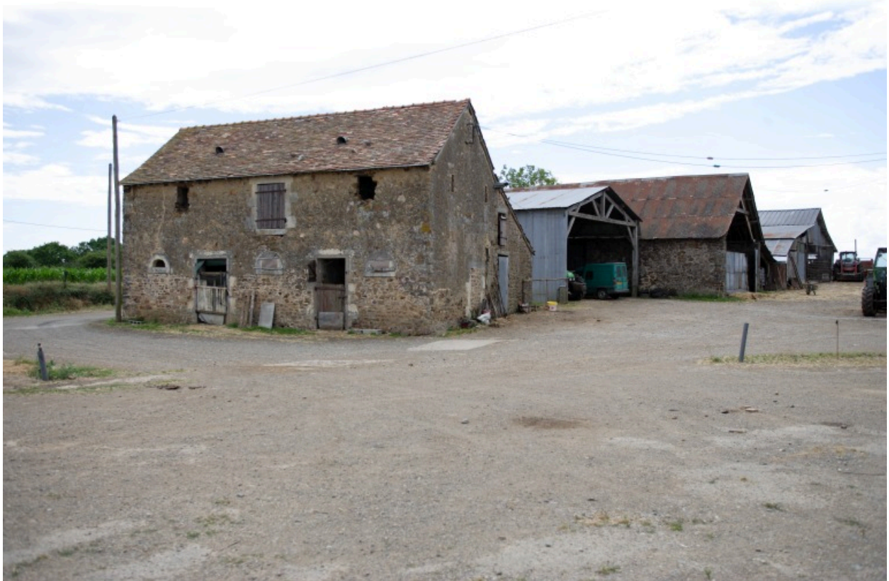
L'étable à chevaux et la remise.