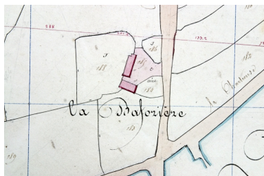
Extrait du plan cadastral de 1842, section B3. Autr. Auteur inconnu, IVR52_20045302755NUCA