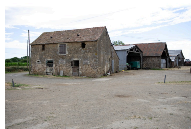
L'étable à chevaux et la remise. IVR52_20055301974NUCA