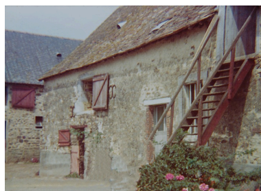
Photographie, années 1960 : la partie étable du logis-étable. Autr. Yves Bellayer, Phot. François Lasa