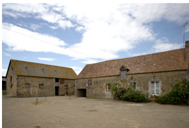
L'étable à vaches- grange et le logis-étable. IVR52_20055301975NUCA