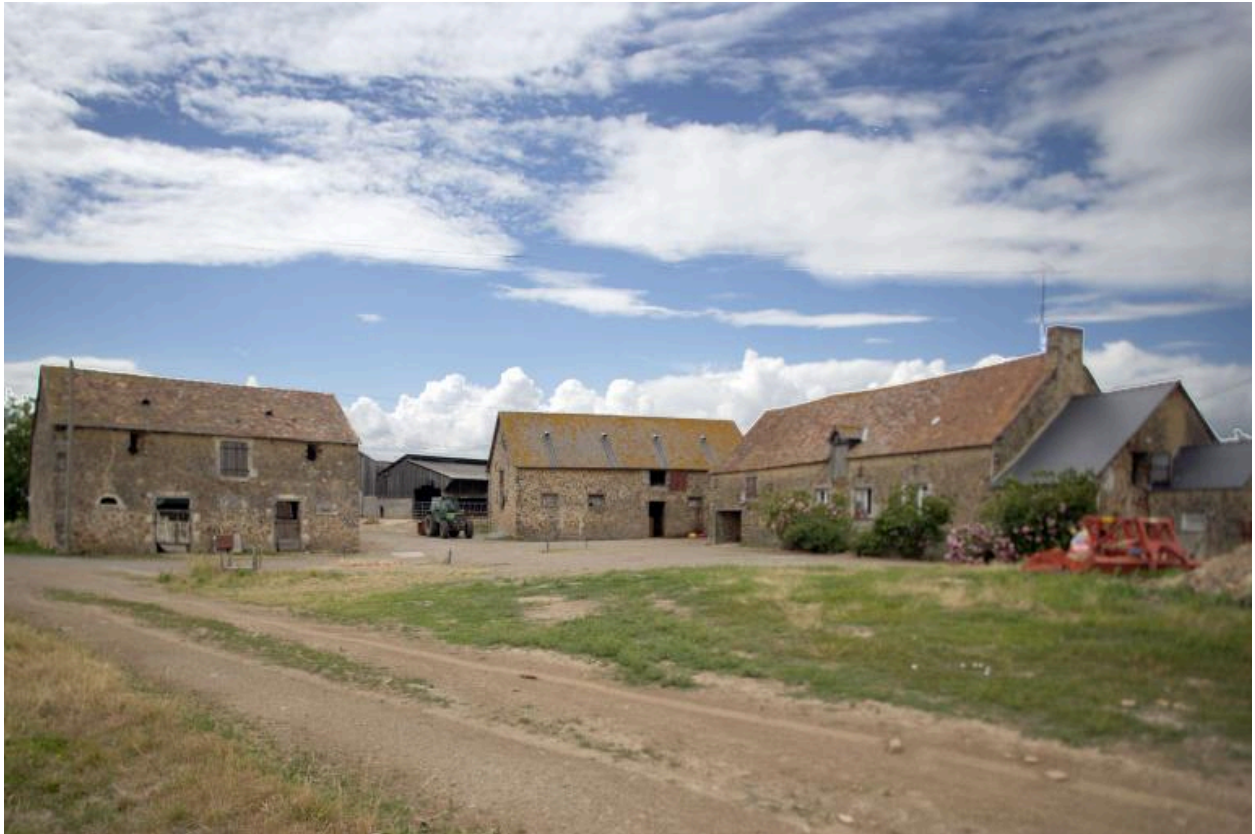
Vue d'ensemble depuis le chemin à l'est : l'étable à chevaux, l'étable à vaches-grange, le logis-étable.