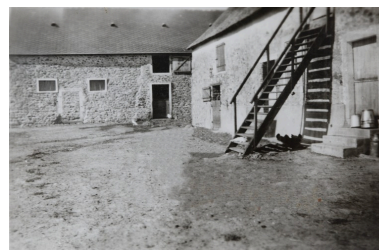
Photographie, années 1960 : l'étable à vaches-grange et le logis-étable.