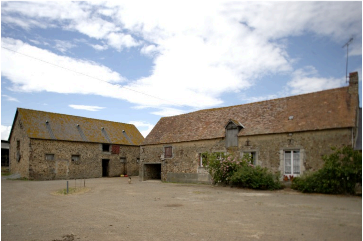
L'étable à vaches-grange et le logis-étable.