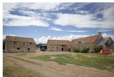
Vue d'ensemble depuis le chemin à l'est : l'étable à chevaux, l'étable à vaches-grange, le logis-étable.