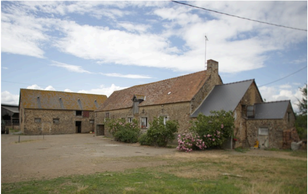
L'étable à vaches-grange et le logis-étable.