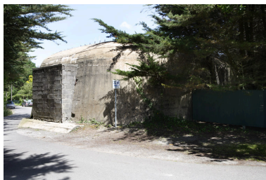
Vue d'ensemble. IVR52_20084402122NUCA