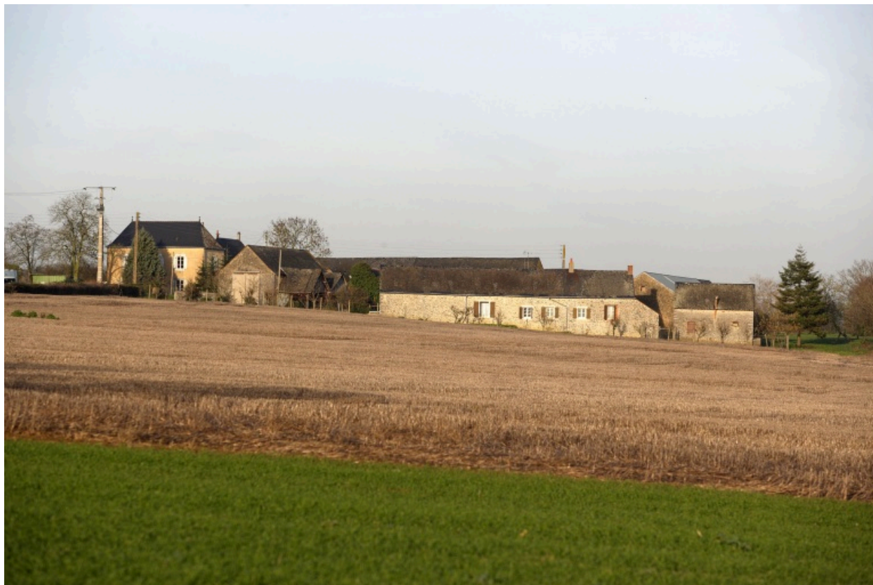
L'écart des Bignonnets vu depuis le sud-ouest.