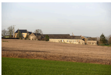
L'écart des Bignonnets