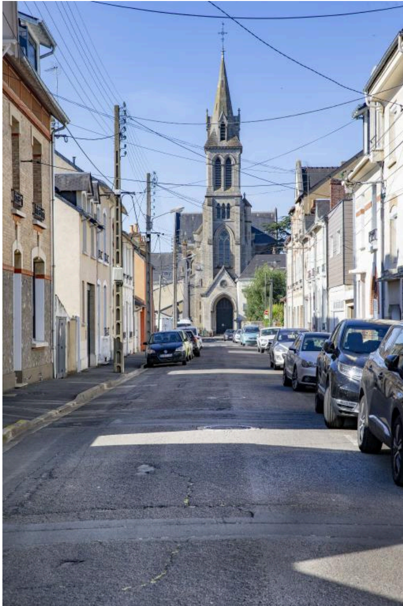
Vue de l'église Saint-Pavin, rue Gallieni.