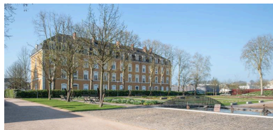
Vue du bâtiment principal de la caserne Chanzy. IVR52_20197200439NUCA