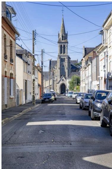
Vue de l'église Saint- Pavin, rue Gallieni.