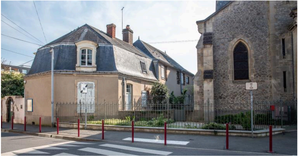
Presbytère Saint-Pavin depuis la rue.