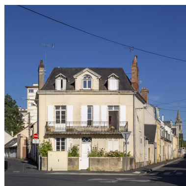
Vue de l'ancienne mairie de Saint- Pavin-des-Champs depuis la place. IVR52_20197201831NUCA