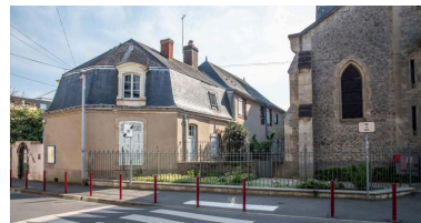
Presbytère Saint-Pavin depuis la rue.