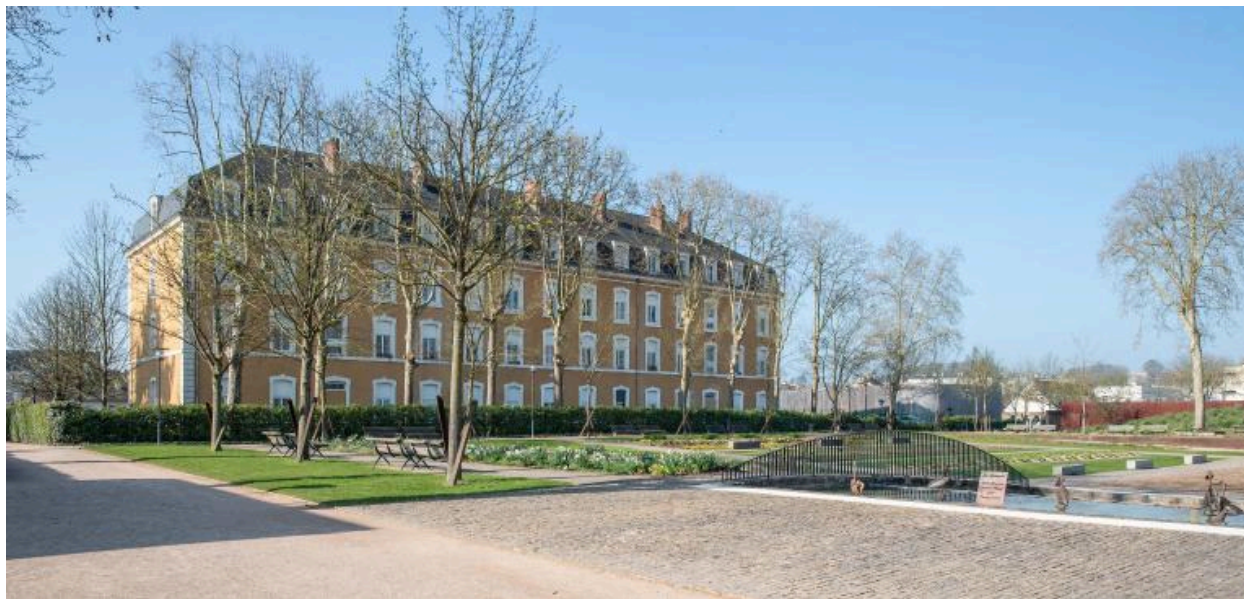
Vue du bâtiment principal de la caserne Chanzy.