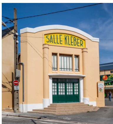
Vue de la salle Kléber.