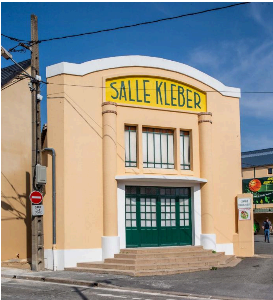
Vue de la salle Kléber.