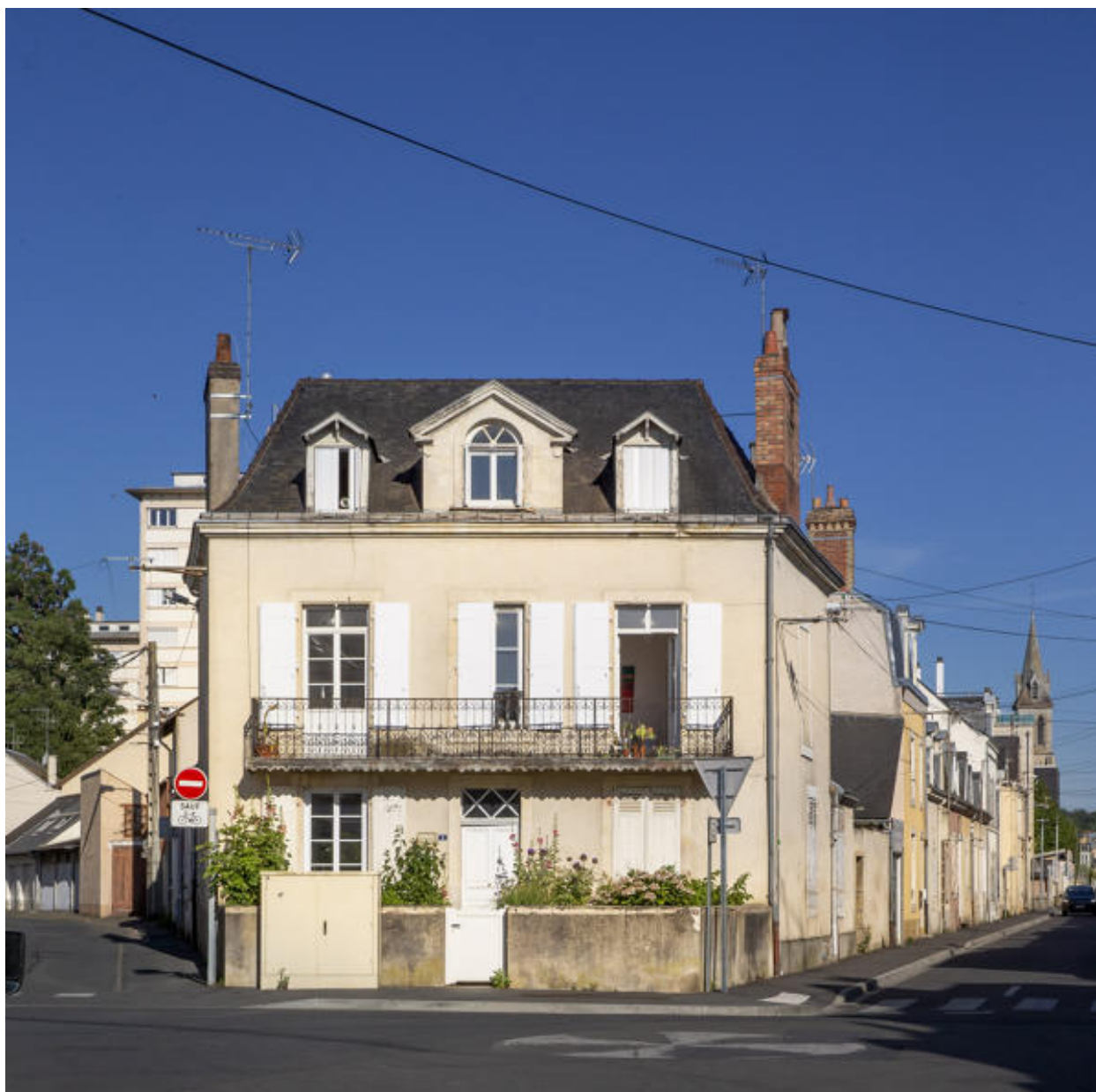
Vue de l'ancienne mairie de Saint-Pavin-des-Champs depuis la place.