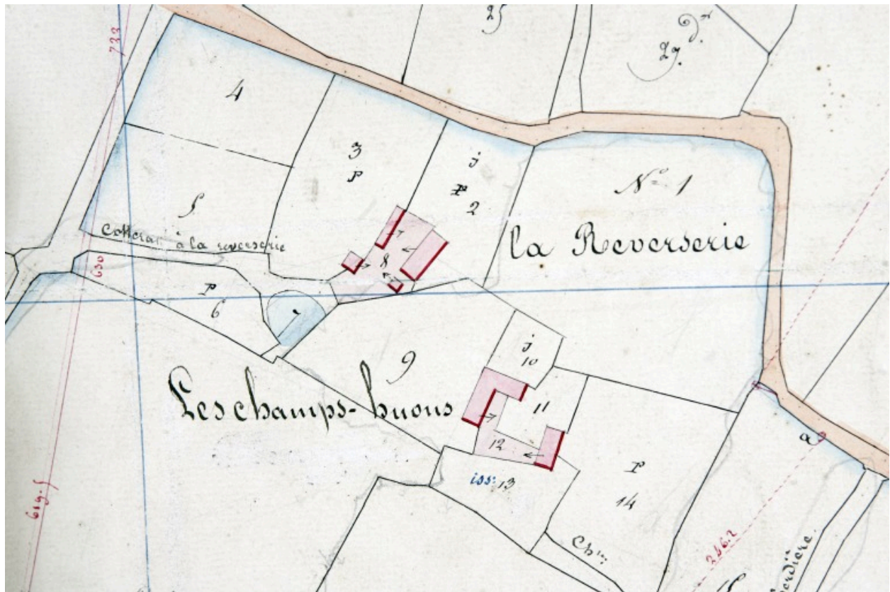
Extrait du plan cadastral de 1838, section G3.