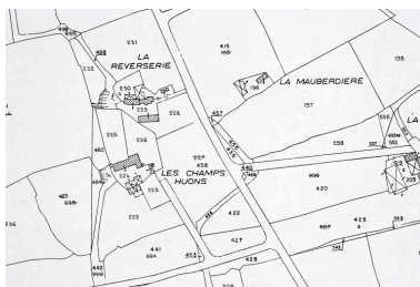
Extrait du plan cadastral révisé en 1966, réédité en 1982 et régulièrement mis à jour entre 1982 et 2006, section G3.