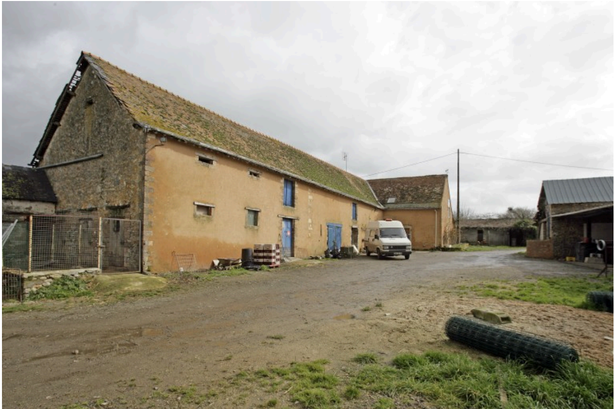
Vue d'ensemble depuis le sud-ouest. A gauche le logis-étable-grange, à droite la remise.