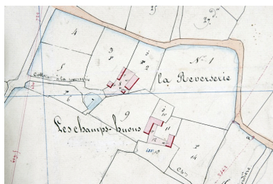
Extrait du plan cadastral de 1838, section G3. IVR52_20065302323NUCA