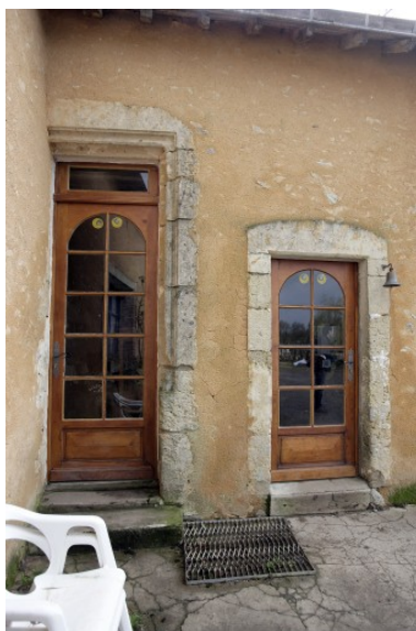
Détail de l'élévation ouest du logis : la porte et la fenêtre.