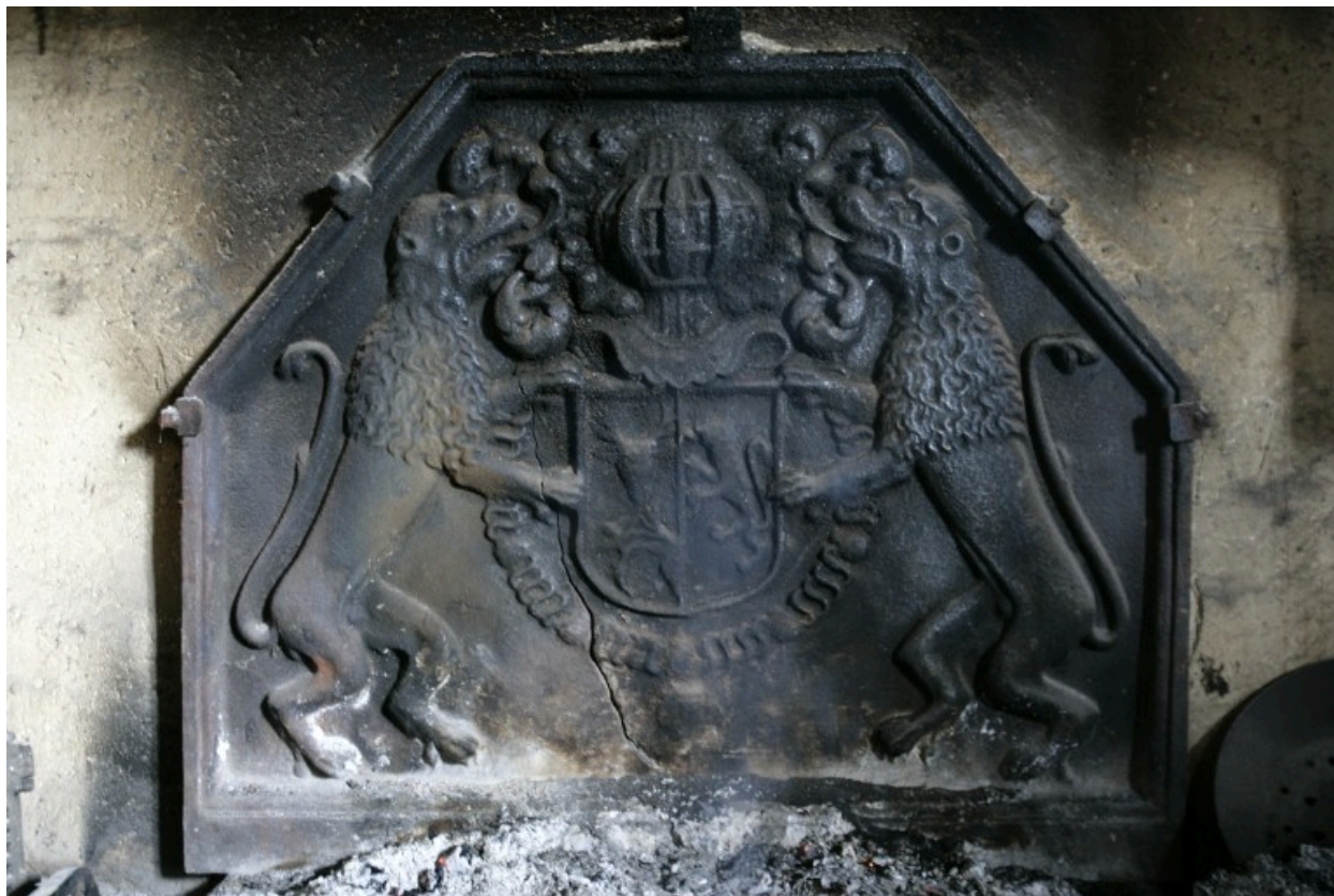
La plaque de la cheminée.