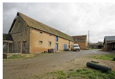
Vue d'ensemble depuis le sud-ouest. A gauche le logis-étable- grange, à droite la remise. IVR52_20075301410NUCA