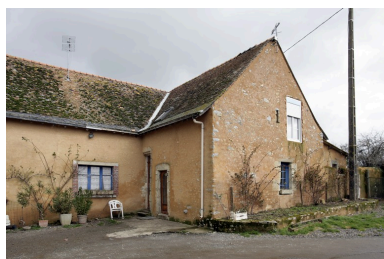
Le logis vu depuis le sud-ouest. IVR52_20075301409NUCA