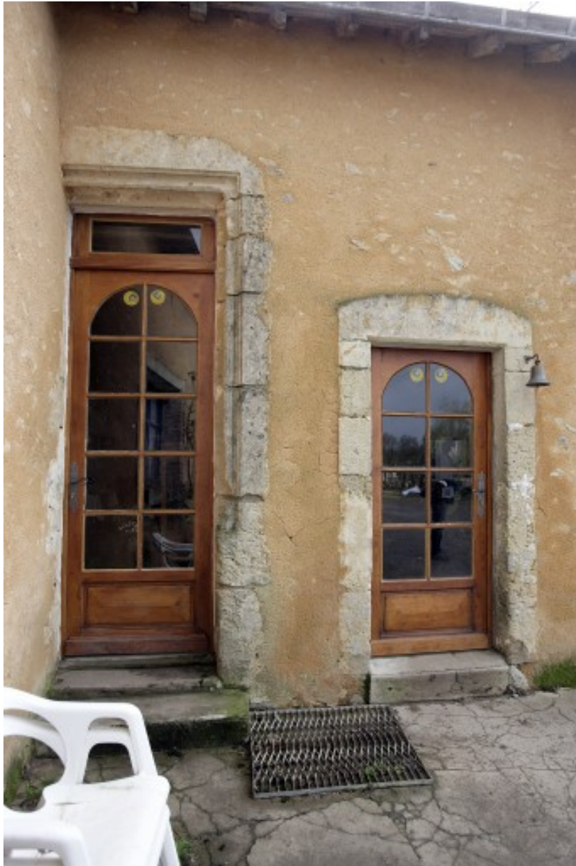
Détail de l'élévation ouest du logis : la porte et la fenêtre.