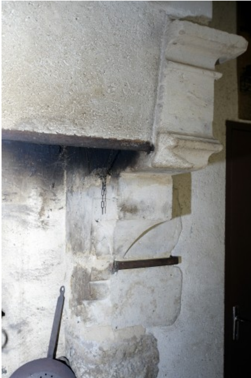
Détail de la cheminée : le corbeau droit.