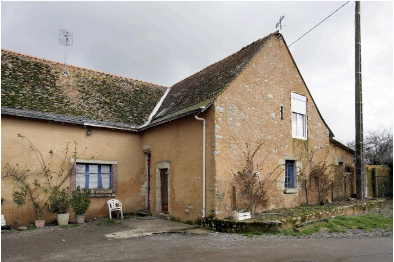
Le logis vu depuis le sud-ouest.