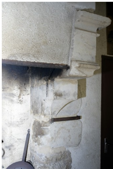
Détail de la cheminée : le corbeau droit. IVR52_20075301413NUCA