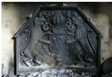
La plaque de la cheminée. IVR52_20075301412NUCA