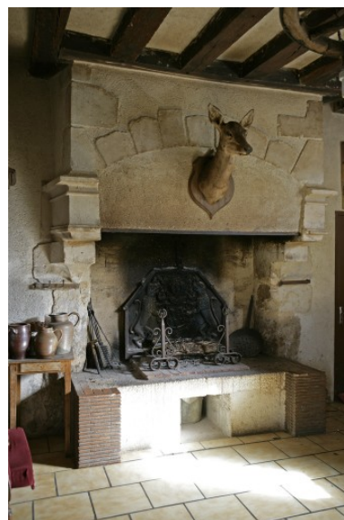
La cheminée. IVR52_20075301411NUCA