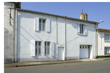
Vue d'ensemble de la façade antérieure.