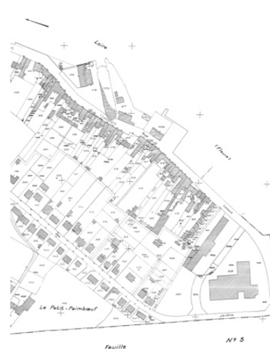
Plan cadastral, 1999, extrait. IVR52_20034400119NUCA