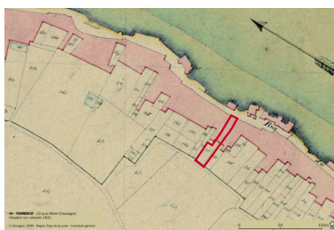
Situation sur cadastre 1810. IVR52_20094400287NUDA