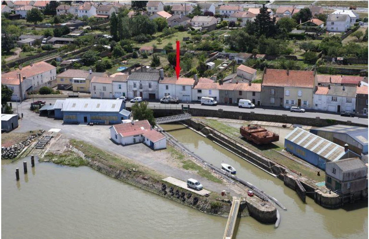
Situation sur la vue aérienne, 2010.