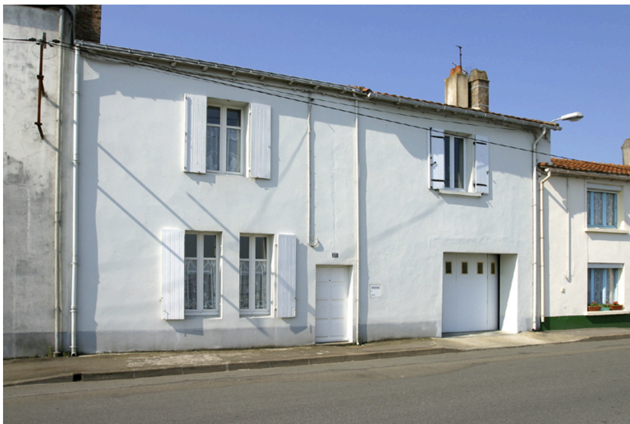
Vue d'ensemble de la façade antérieure.