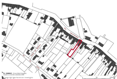
Situation sur données cadastrales 2008.