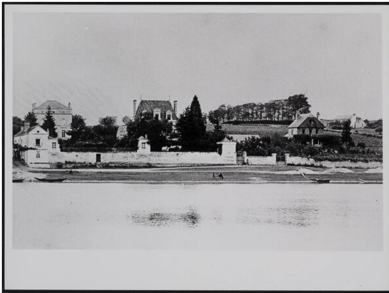
Vue du quai de la Noë. La villa Les Marguerites (au centre) et Le Chalet (à droite). Photographie. Vers 1900.