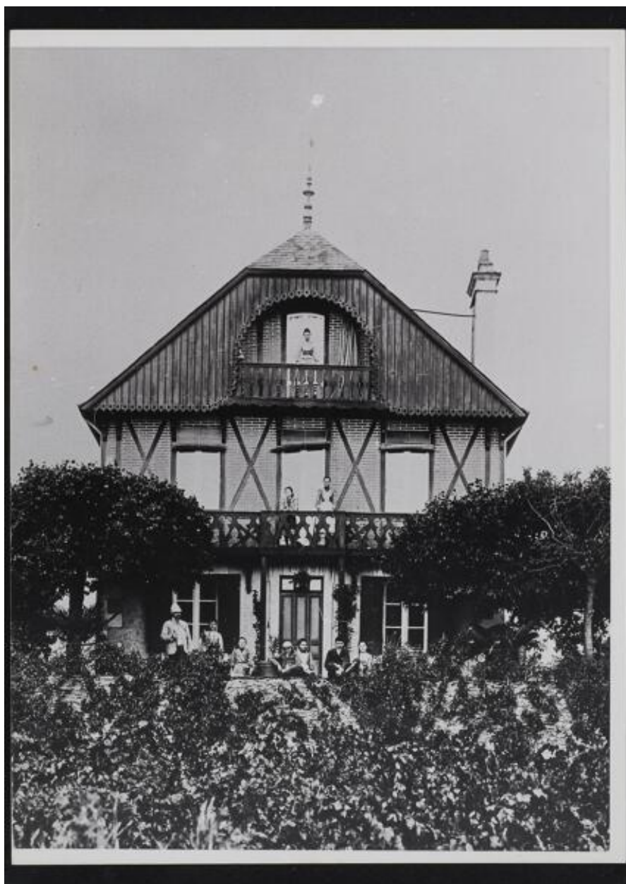
Le Chalet. Photographie. 1er quart du 20e siècle. (Archives départementales de Maine-et-Loire, 392 J).