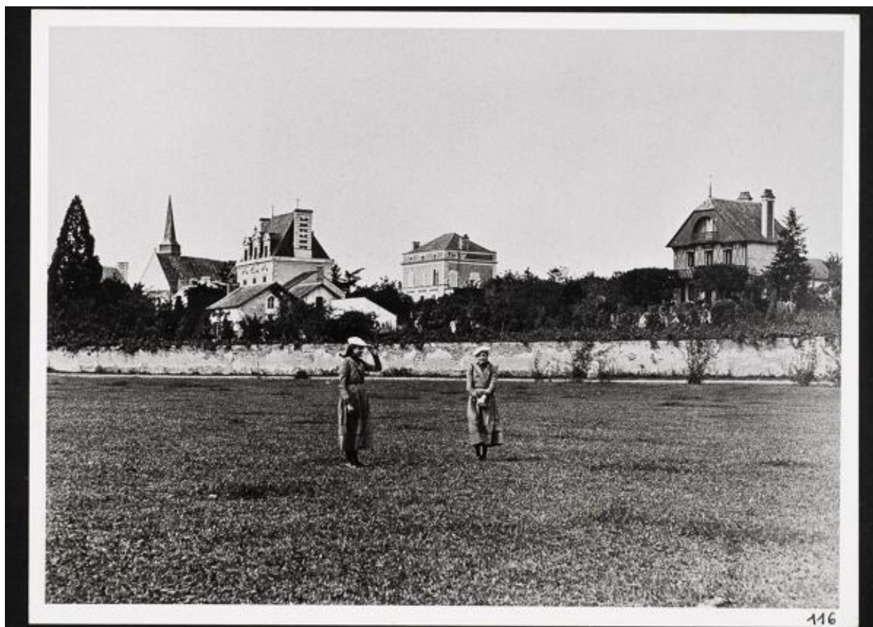
Vue du quai de la Noë. La villa Les Marguerites (à gauche) et Le Chalet (à droite). Photographie. Vers 1900.