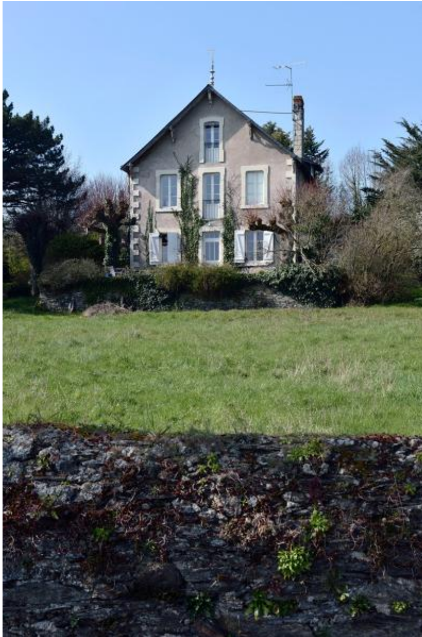
Maison dite le Chalet, 13 rue de la Noë.