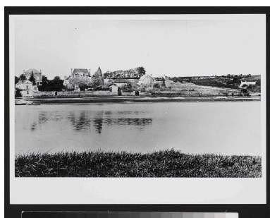
Vue du quai de la Noë. La villa Les Marguerites (au centre) et Le Chalet (à droite). Photographie. Vers 1900.