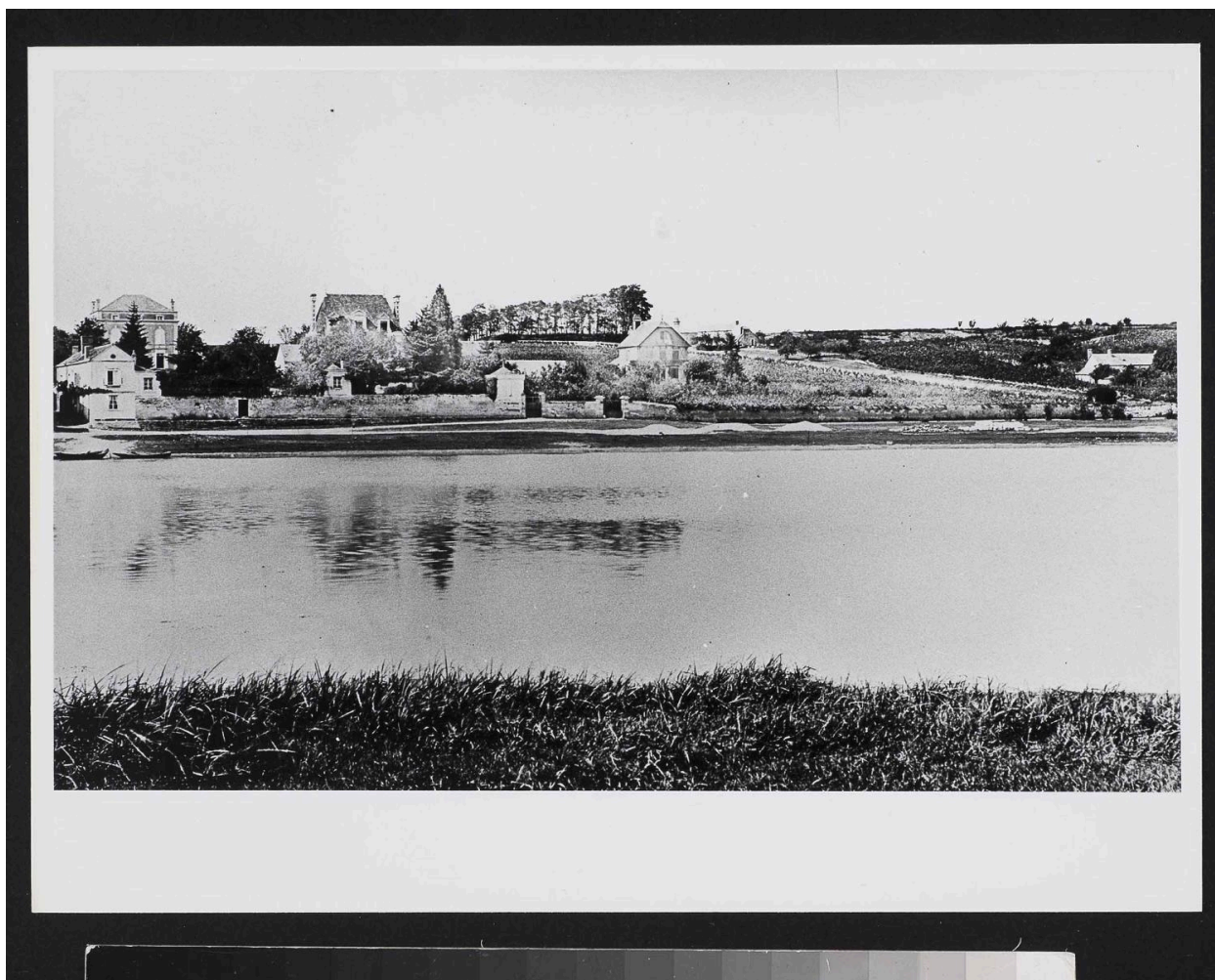
Vue du quai de la Noë. La villa Les Marguerites (au centre) et Le Chalet (à droite). Photographie. Vers 1900.