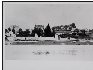
Vue du quai de la Noë. La villa Les Marguerites (au centre) et Le Chalet (à droite). Photographie. Vers 1900. IVR52_20194900707NUCA