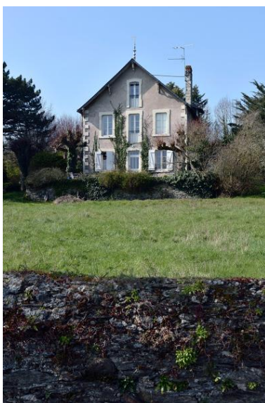
Maison dite le Chalet, 13 rue de la Noë.