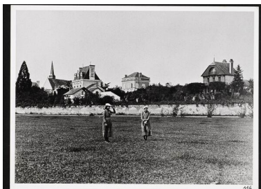
Vue du quai de la Noë. La villa Les Marguerites (à gauche) et Le Chalet (à droite). Photographie. Vers 1900. IVR52_20194900684NUCA