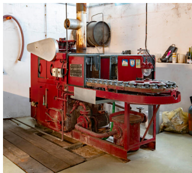
Laveuse à bouteilles dite "Girondine".