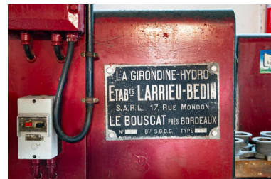
Détail de la plaque du fabricant.