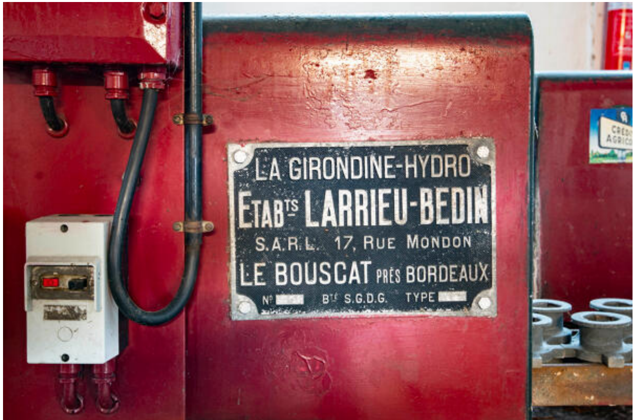
Détail de la plaque du fabricant.