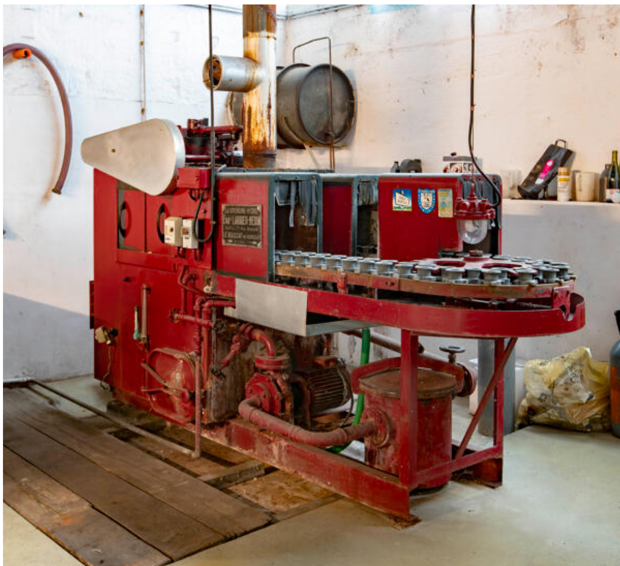
Laveuse à bouteilles dite "Girondine".