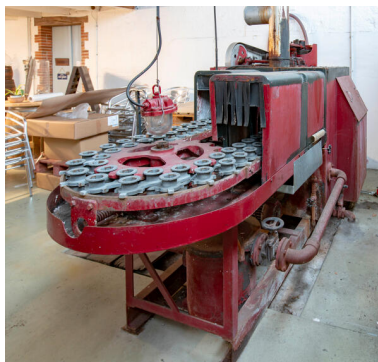
Laveuse à bouteilles dite "Girondine".