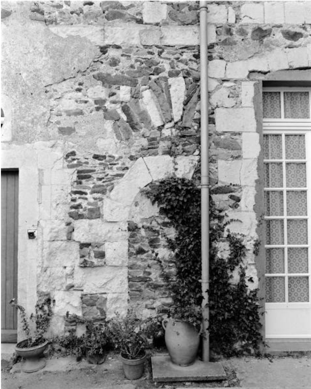
Façade antérieure du corps de logement, partie droite, détail d'ouvertures murées.