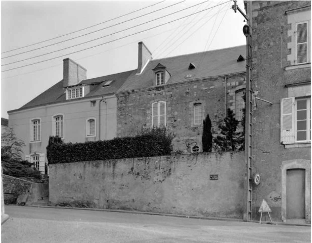
Vue d'ensemble, façades antérieures sur rue.