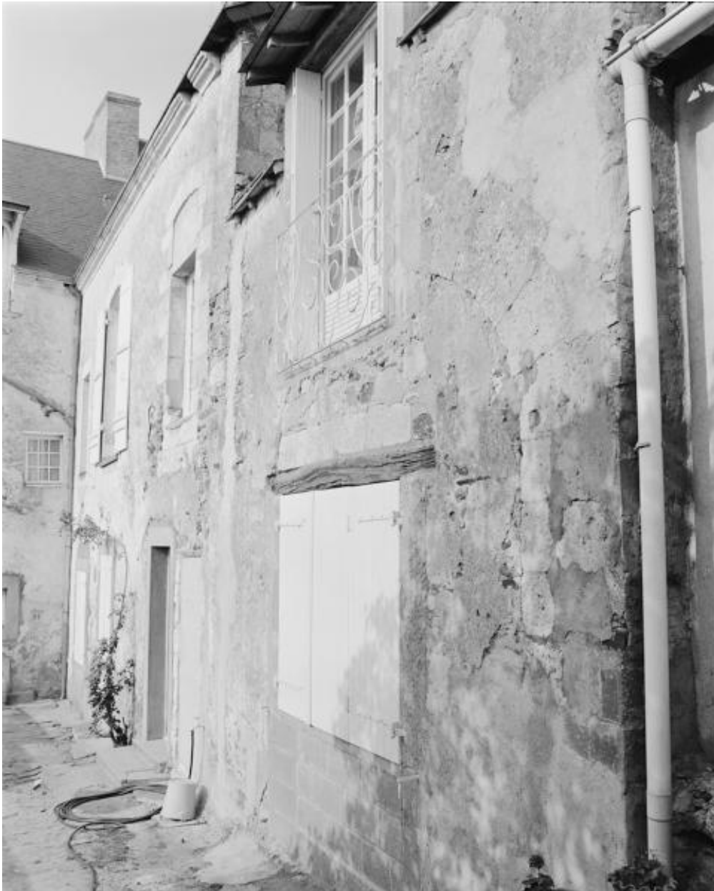
Façade postérieure de l'aile en retour de l'équerre nord.