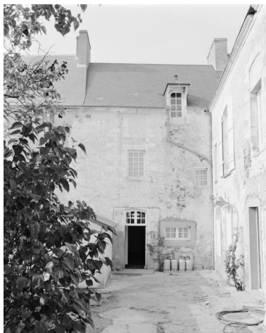
Façade postérieure, partie droite. IVR52_19854901793X