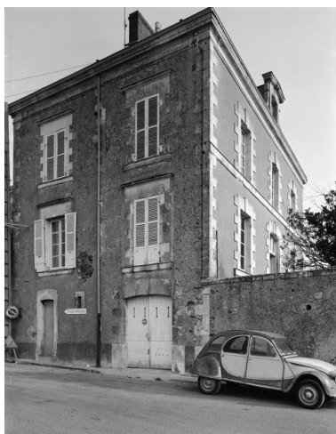
Vue de la façade antérieure et latérale droite de l'aile en retour d'équerre sur la rue Vieille-du-Château. IVR52_19854901817V