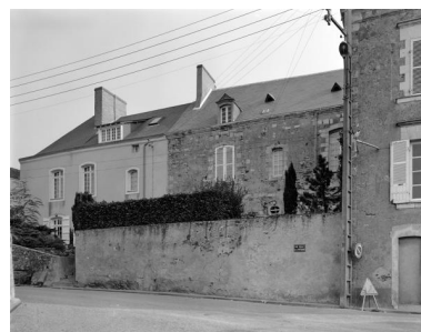
Vue d'ensemble, façades antérieures sur rue.