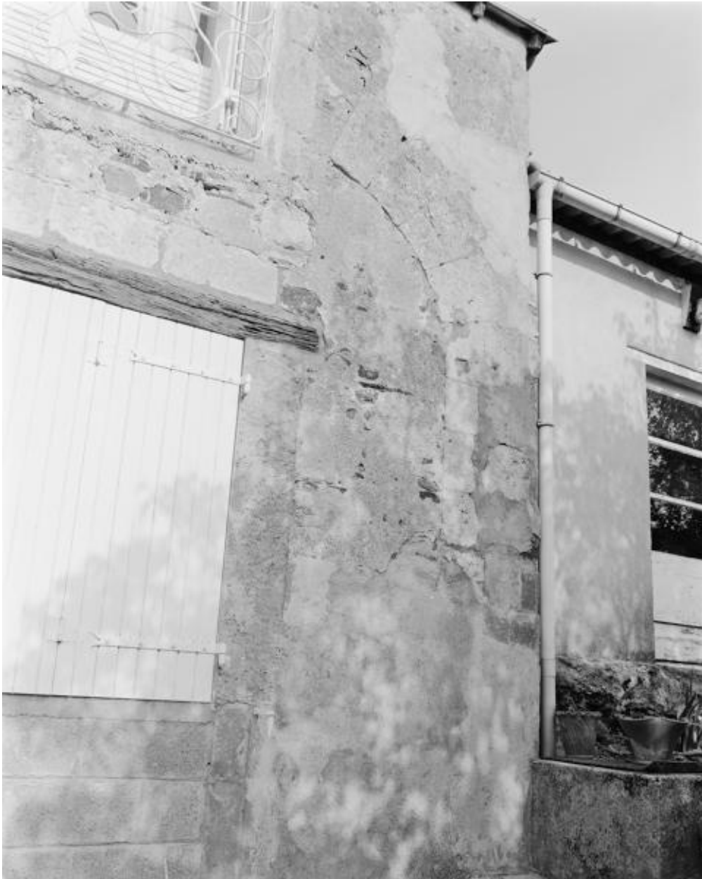
Façade postérieure de l'aile en retour d'équerre nord, détail d'un passage muré.