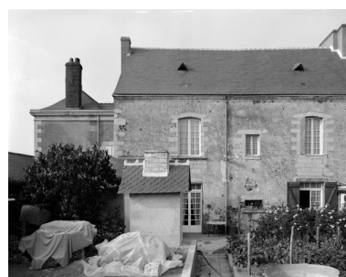
Façade postérieure, aile gauche, maison, 2, 4 rue Vieille du château