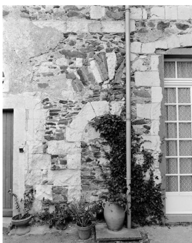
Façade antérieure du corps de logement, partie droite, détail d'ouvertures murées. IVR52_19854901792X