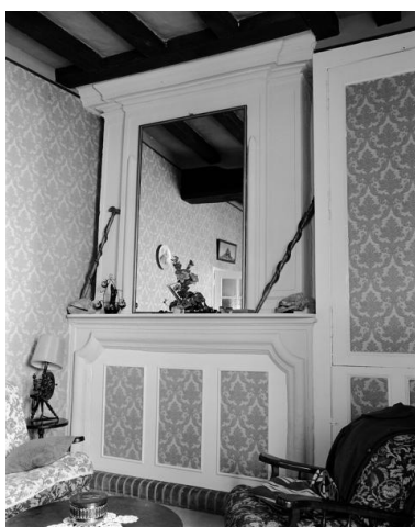
Vue d'ensemble de la cheminée du rez-de-chaussée du corps principal. IVR52_19854901789X