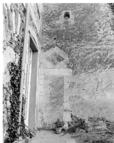
Aile en retour d'équerre, façade nord, détail d'une ouverture murée. IVR52_19854901791X