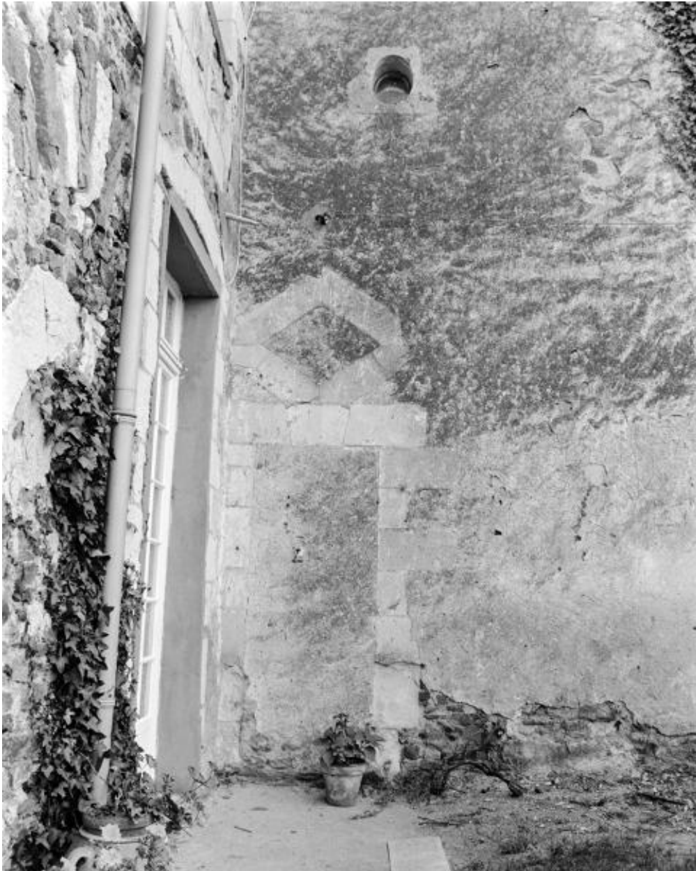
Aile en retour d'équerre, façade nord, détail d'une ouverture murée.