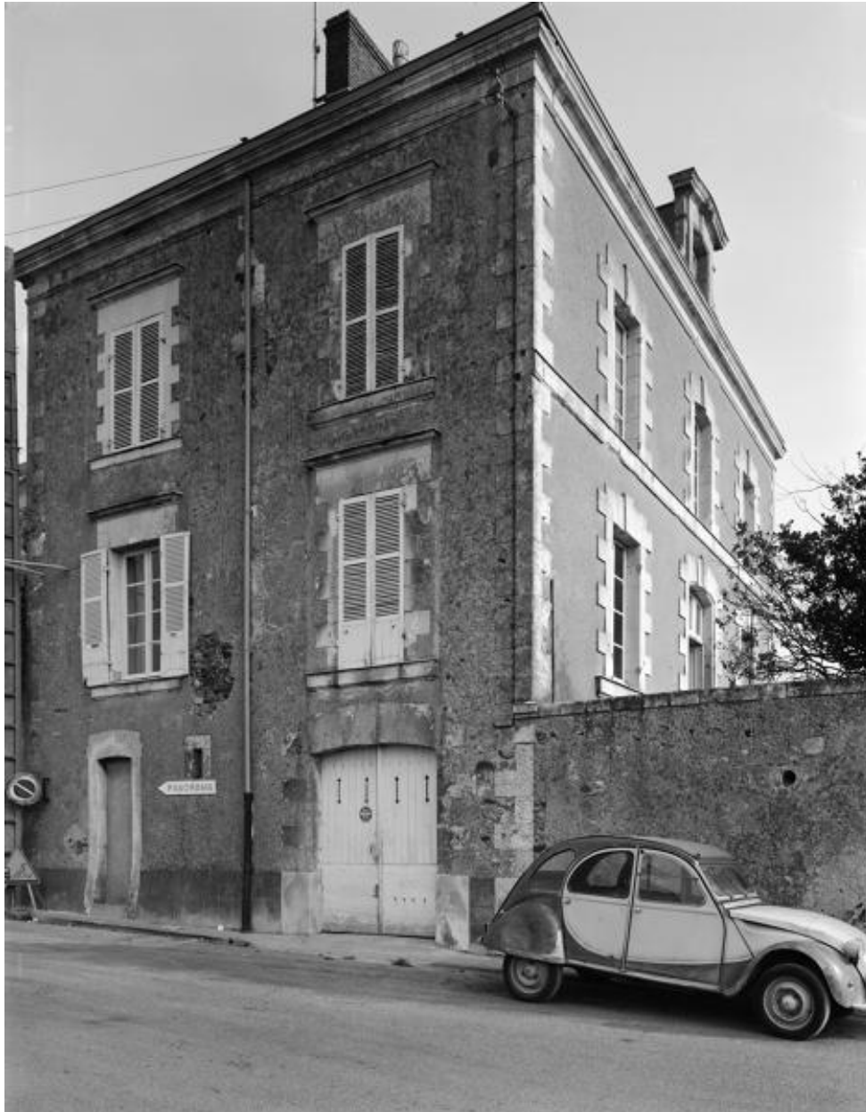
Vue de la façade antérieure et latérale droite de l'aide en retour d'équerre sur la rue Vieille-du-Château.