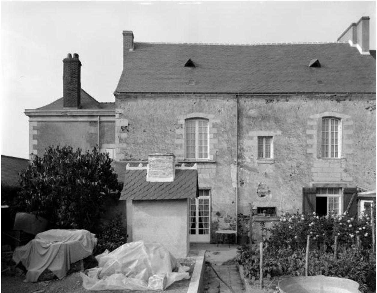
Façade postérieure, aile gauche, maison, 2, 4 rue Vieille du château