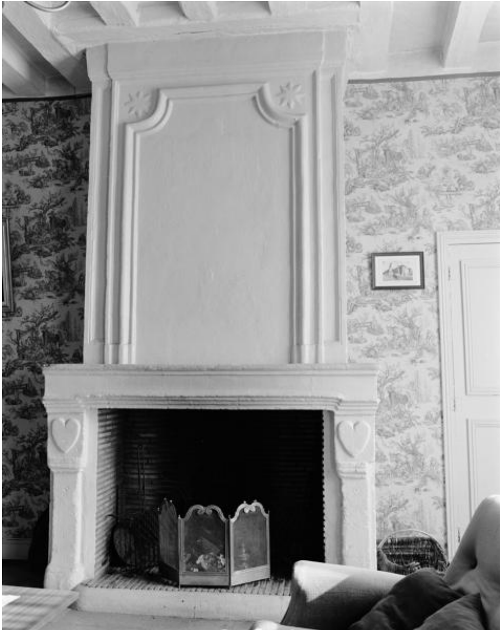
Vue d'ensemble de la cheminée du premier étage du corps en retour de l'équerre nord.