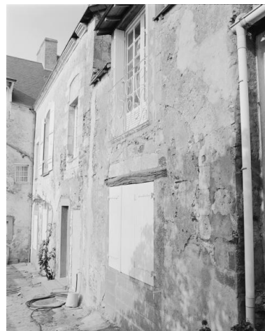
Façade postérieure de l'aile en retour de l'équerre nord.