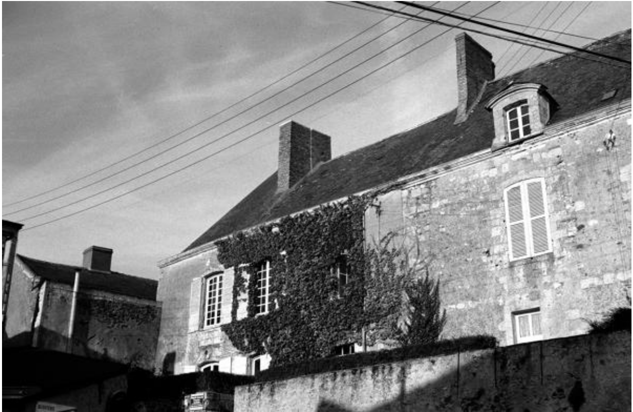
Maison dans le bourg, 2, 4 rue Vieille du château.