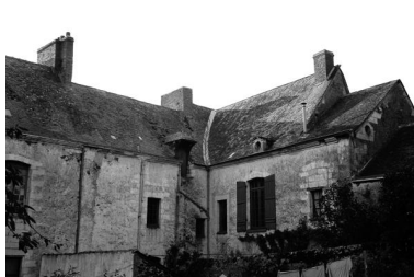
Maison dans le bourg, 2, 4 rue Vieille du château. IVR52_19724900364Z