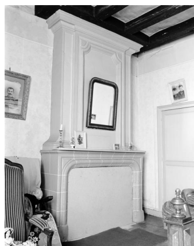
Vue d'ensemble de la cheminée du premier étage du corps de bâtiment principal.