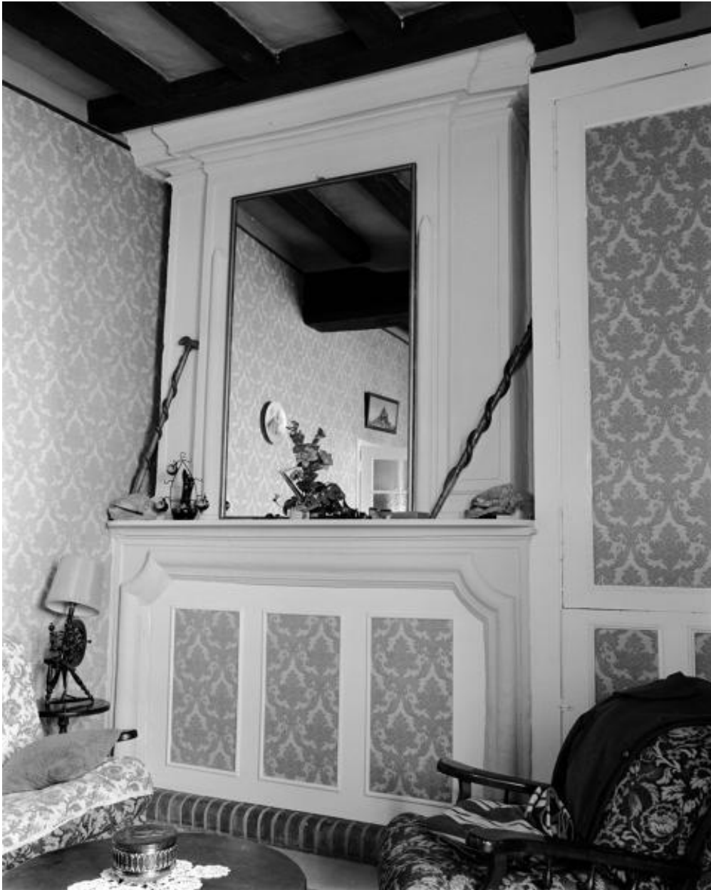
Vue d'ensemble de la cheminée du rez-de-chaussée du corps principal.