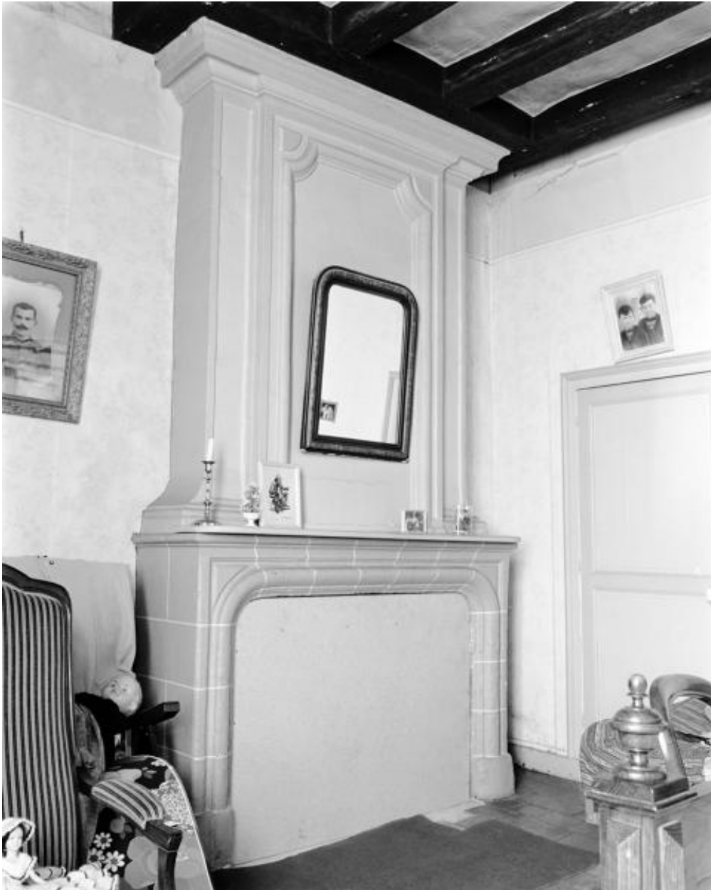
Vue d'ensemble de la cheminée du premier étage du corps de bâtiment principal.