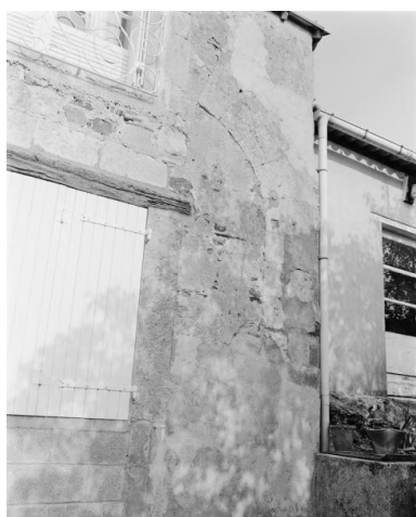
Façade postérieure de l'aile en retour d'équerre nord, détail d'un passage muré. IVR52_19854901795X