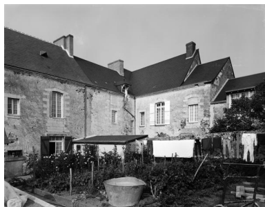
Façades postérieures, partie droite du corps principal, et aile en retour d'équerre sur la cour.