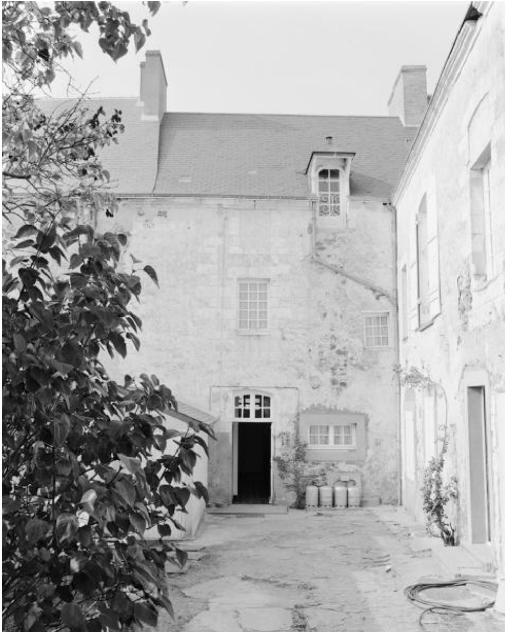
Façade postérieure, partie droite.