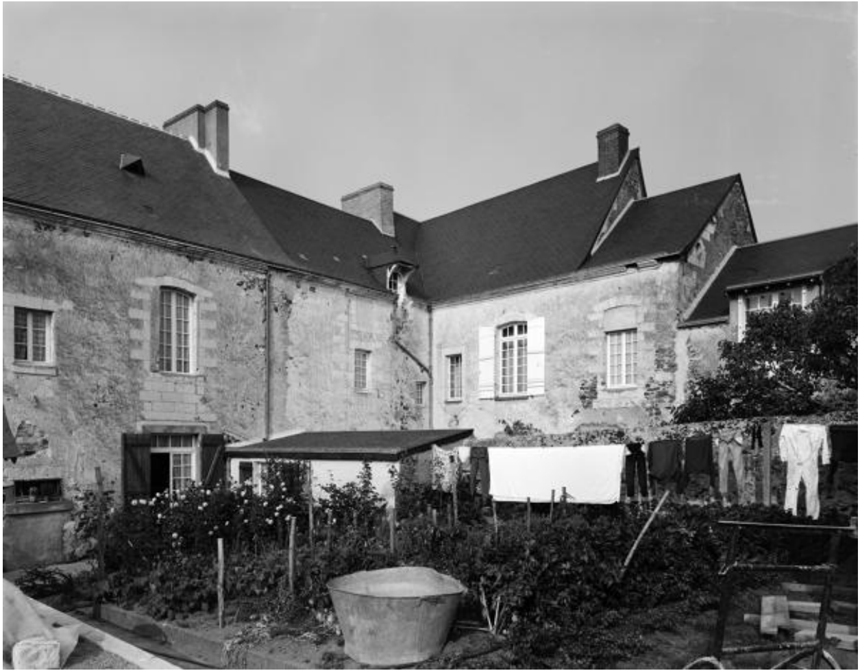
Façades postérieures, partie droite du corps principal, et aile en retour d'équerre sur la cour.