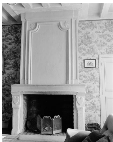
Vue d'ensemble de la cheminée du premier étage du corps en retour de l'équerre nord.