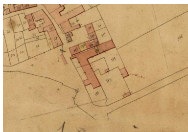
Maison, rue Vieille-du-Château. Extrait du plan cadastral de 1827, section D1, parcelles 387, 388, 389. IVR52_20244900852NUCA