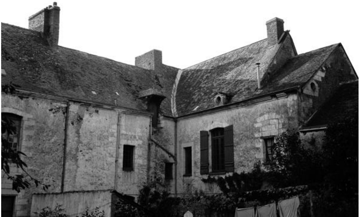
Maison dans le bourg, 2, 4 rue Vieille du château.