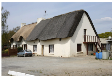
Vue d'ensemble depuis le sud-est. IVR52_20084401486NUCA