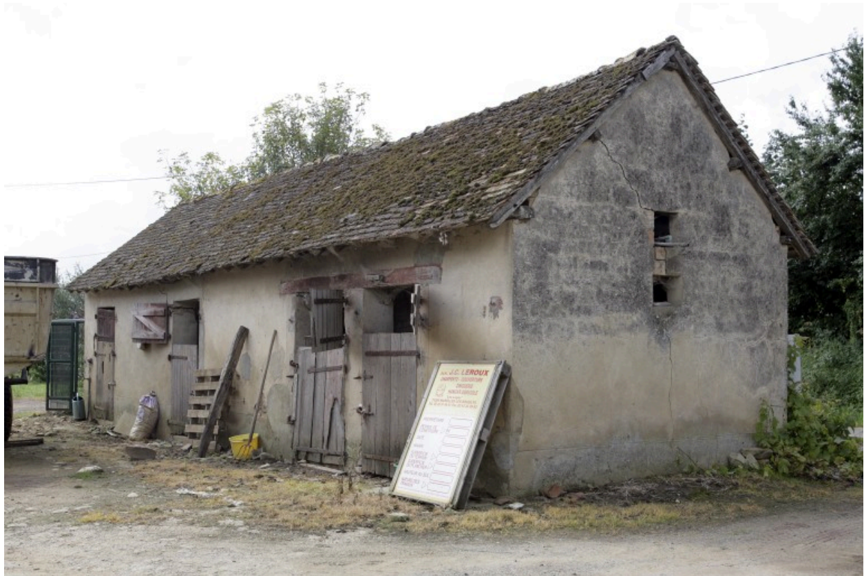
Porcheries vues depuis la cour.