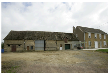
Vue générale. IVR52_20077200727NUCA