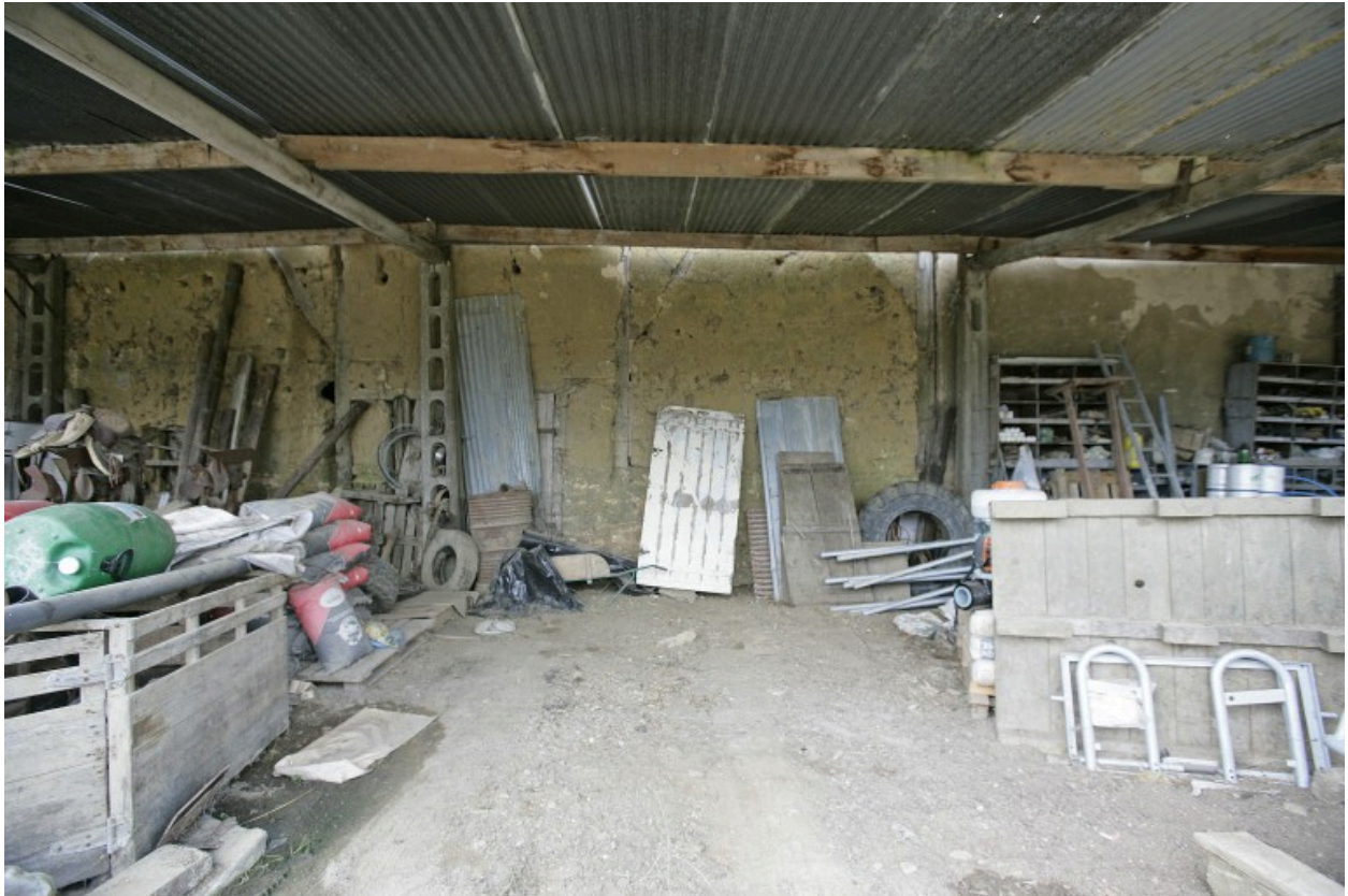
Grange : élévation postérieure en bauge.