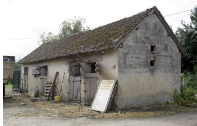
Porcheries vues depuis la cour. IVR52_20077200729NUCA