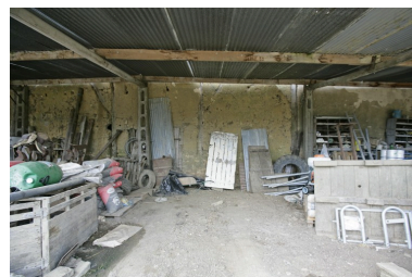
Grange : élévation postérieure en bauge.