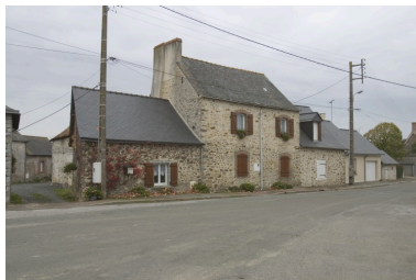
Vue depuis la rue. La maison est constituée des corps de bâtiment bas situés à droite.