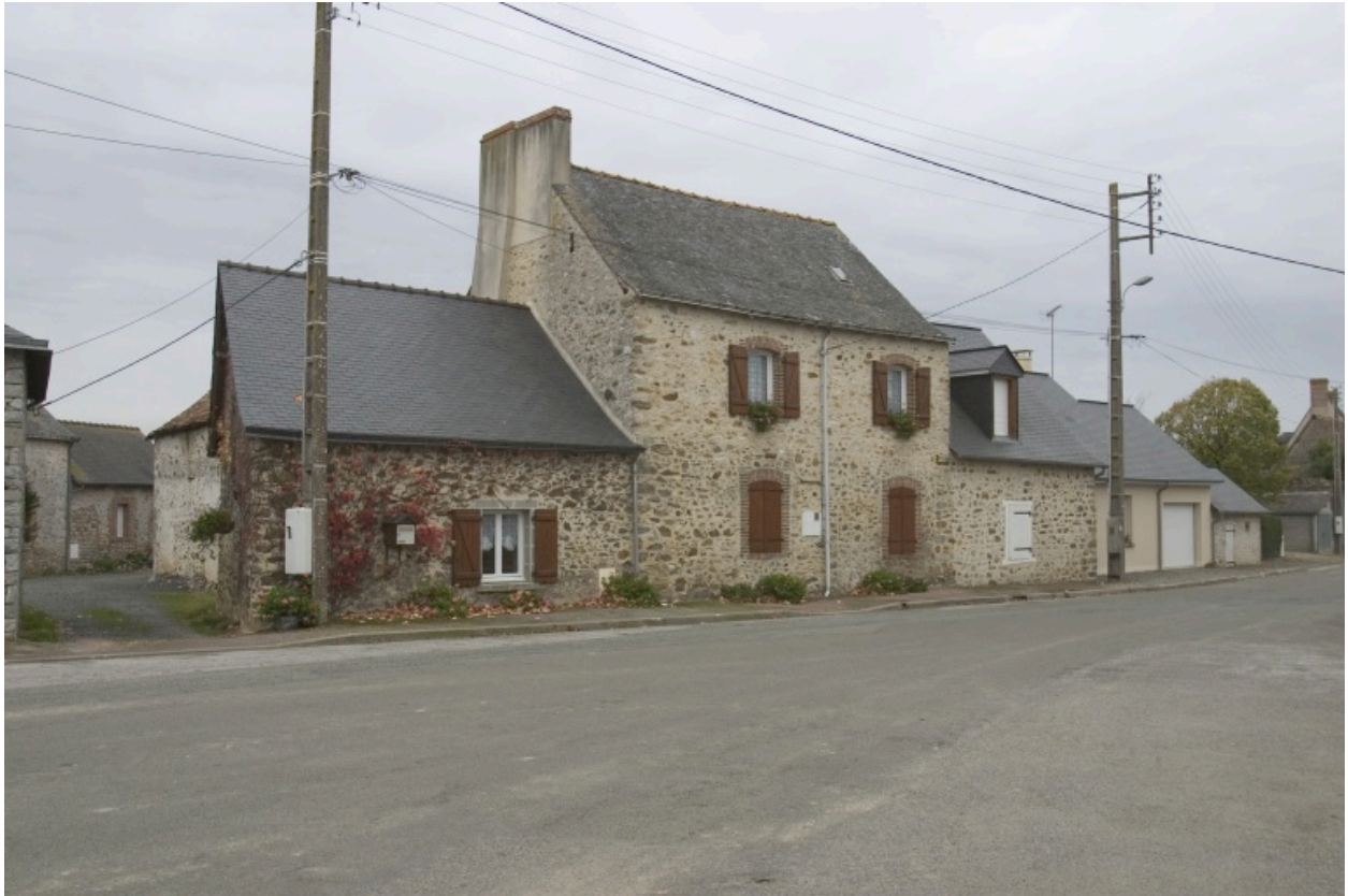
Vue depuis la rue. La maison est constituée des corps de bâtiment bas situés à droite.