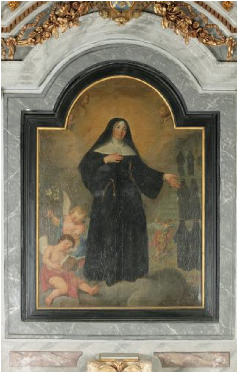
Tableau : Sainte Angèle Merici ; vue d'ensemble.