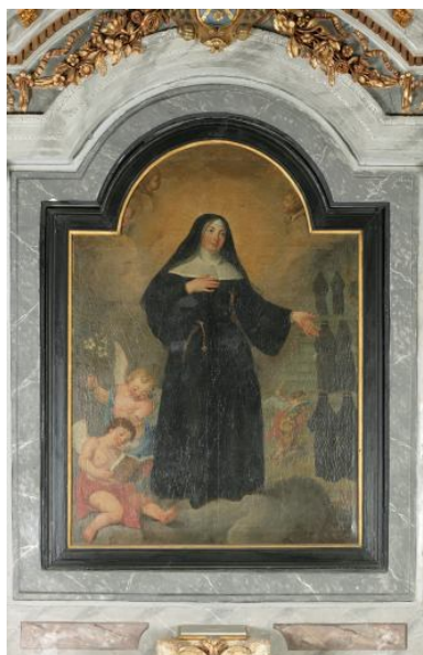
Tableau : Sainte Angèle Merici ; vue d'ensemble. IVR52_20068500067NUCA