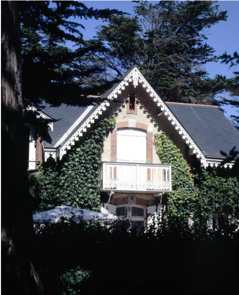
Pignon de l'élévation postérieure de la villa Les Pâquerettes.