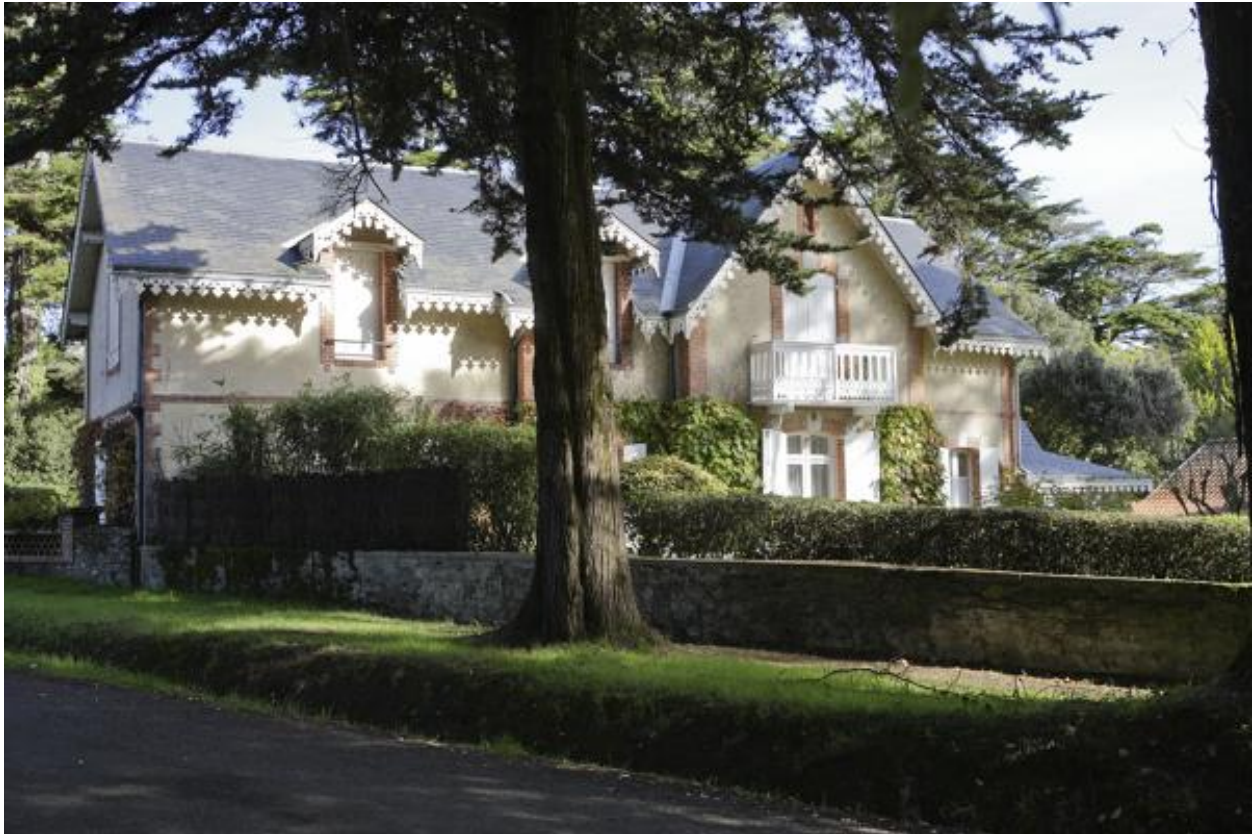
Vue d'ensemble de la villa Les Pâquerettes.