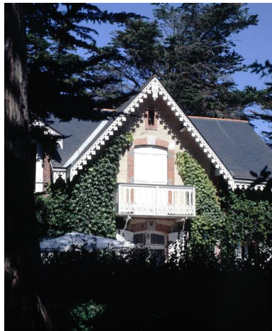
Pignon de l'élévation postérieure de la villa Les Pâquerettes.