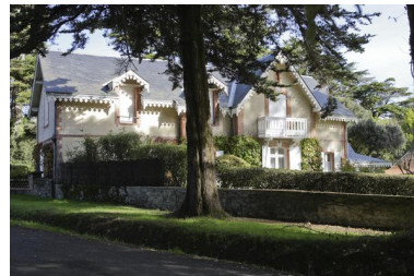
Vue d'ensemble de la villa Les Pâquerettes.