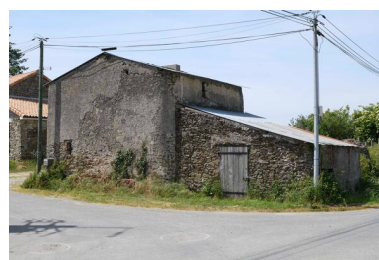
La Jolivetière. Vue de la ferme n° 2 depuis le sud-est.