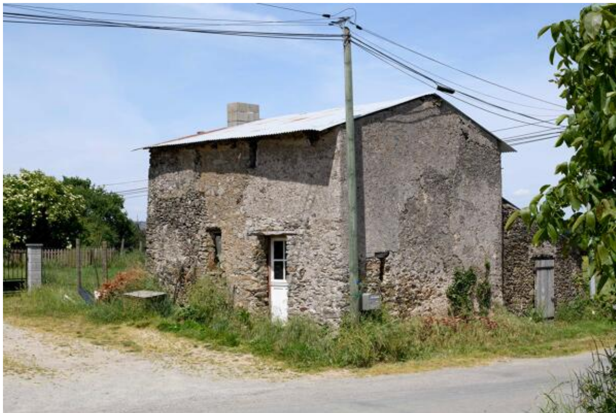
La Jolivière. Vue de la ferme n° 2 depuis l'ouest.