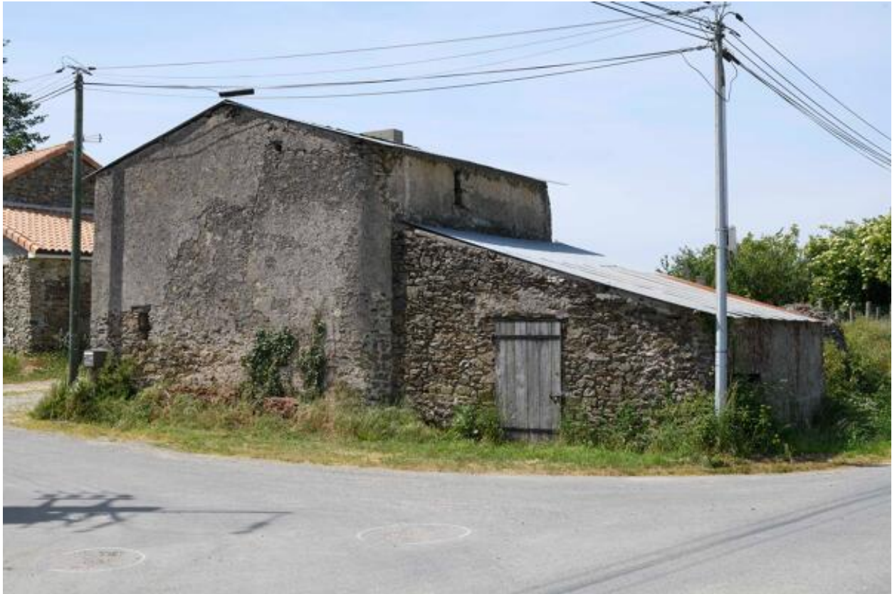
La Jolivière. Vue de la ferme n° 2 depuis le sud-est.