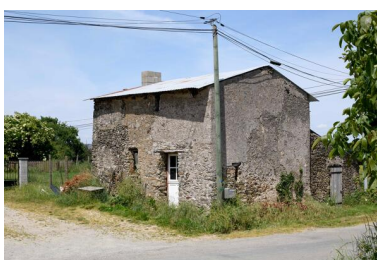
La Jolivetière. Vue de la ferme n° 2 depuis l'ouest.