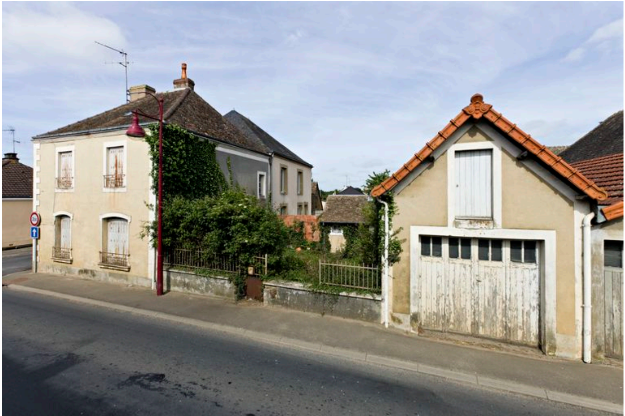
Vue générale depuis la rue principale