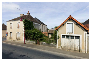
IVR52_20117200660NUCA