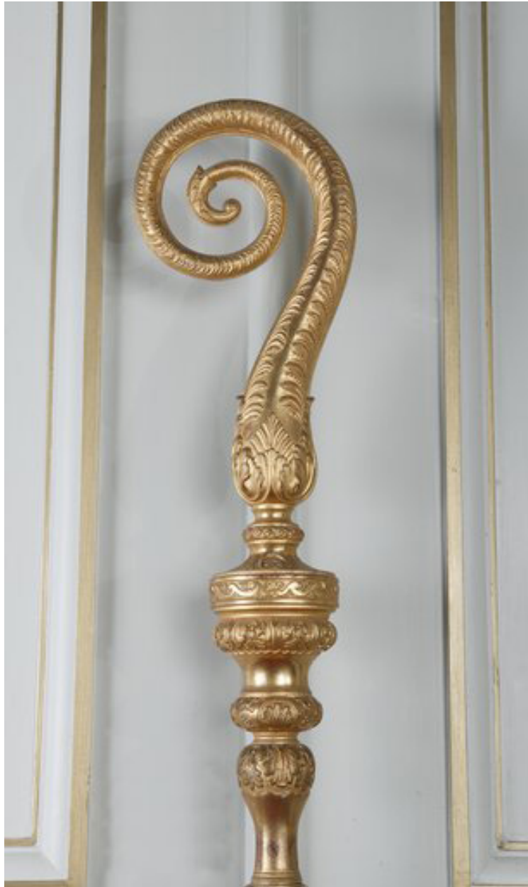
Détail du crosseron.