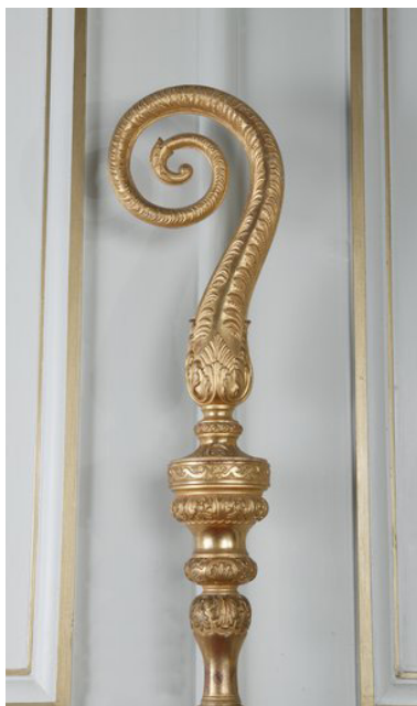
Détail du crosseron. IVR52_20088500013NUCA