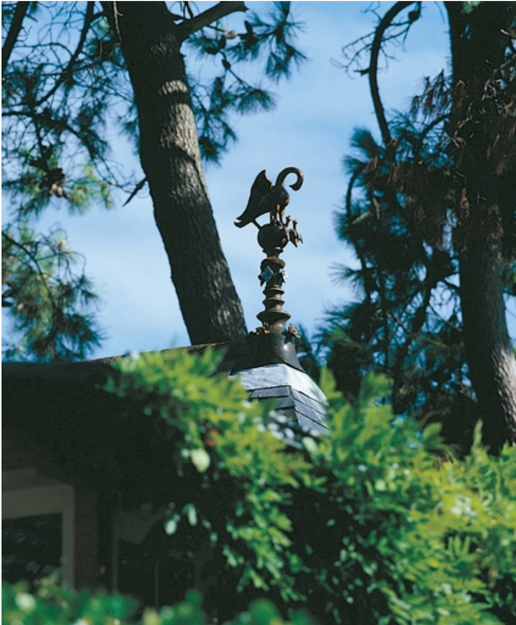
Epi de faîtage en céramique architecturale représentant un oiseau et ses petits sur la villa Symbole.