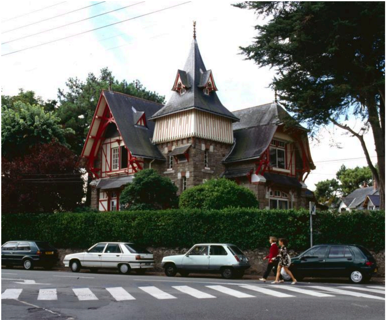
Villa de l'architecte Georges Lafont fondateur de la station balnéaire, vue de la place des Victoires.