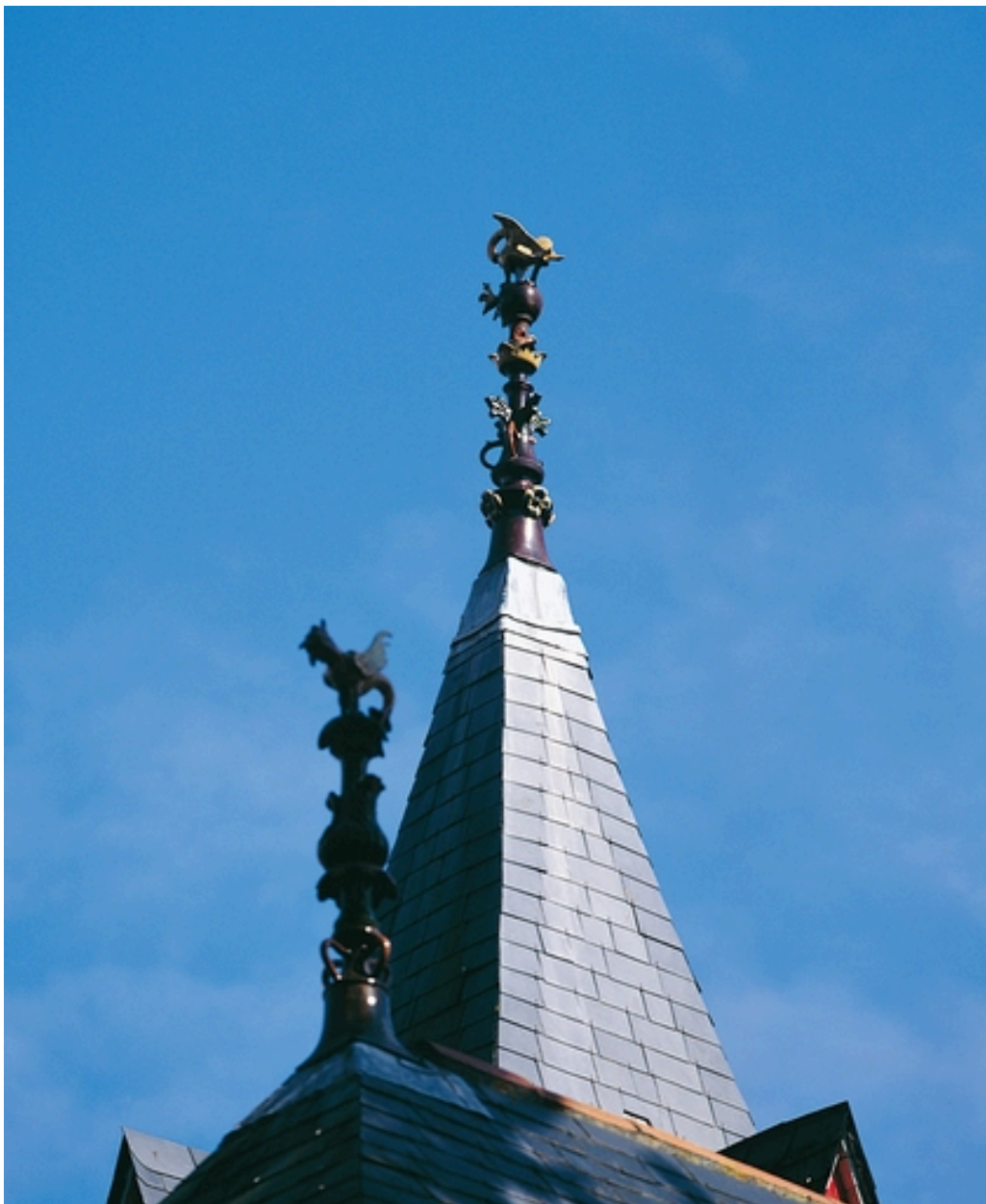
Epi de faîtage en céramique architecturale représentant un oiseau et ses petits et un griffon sur la villa Symbole.