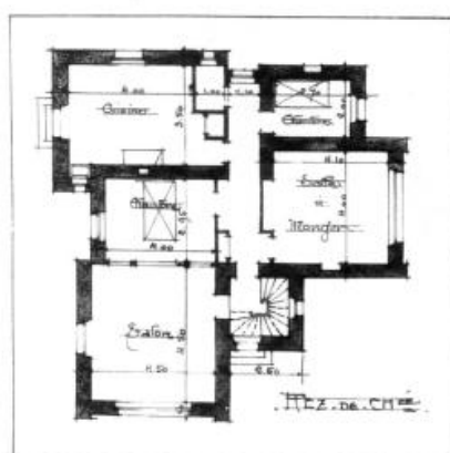
Bibliothèque de la Ville de Nantes