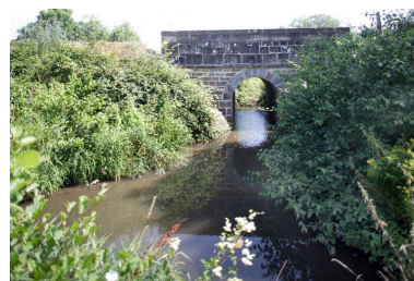
Le pont du ruisseau de Vienne. IVR52_20055300380NUCA