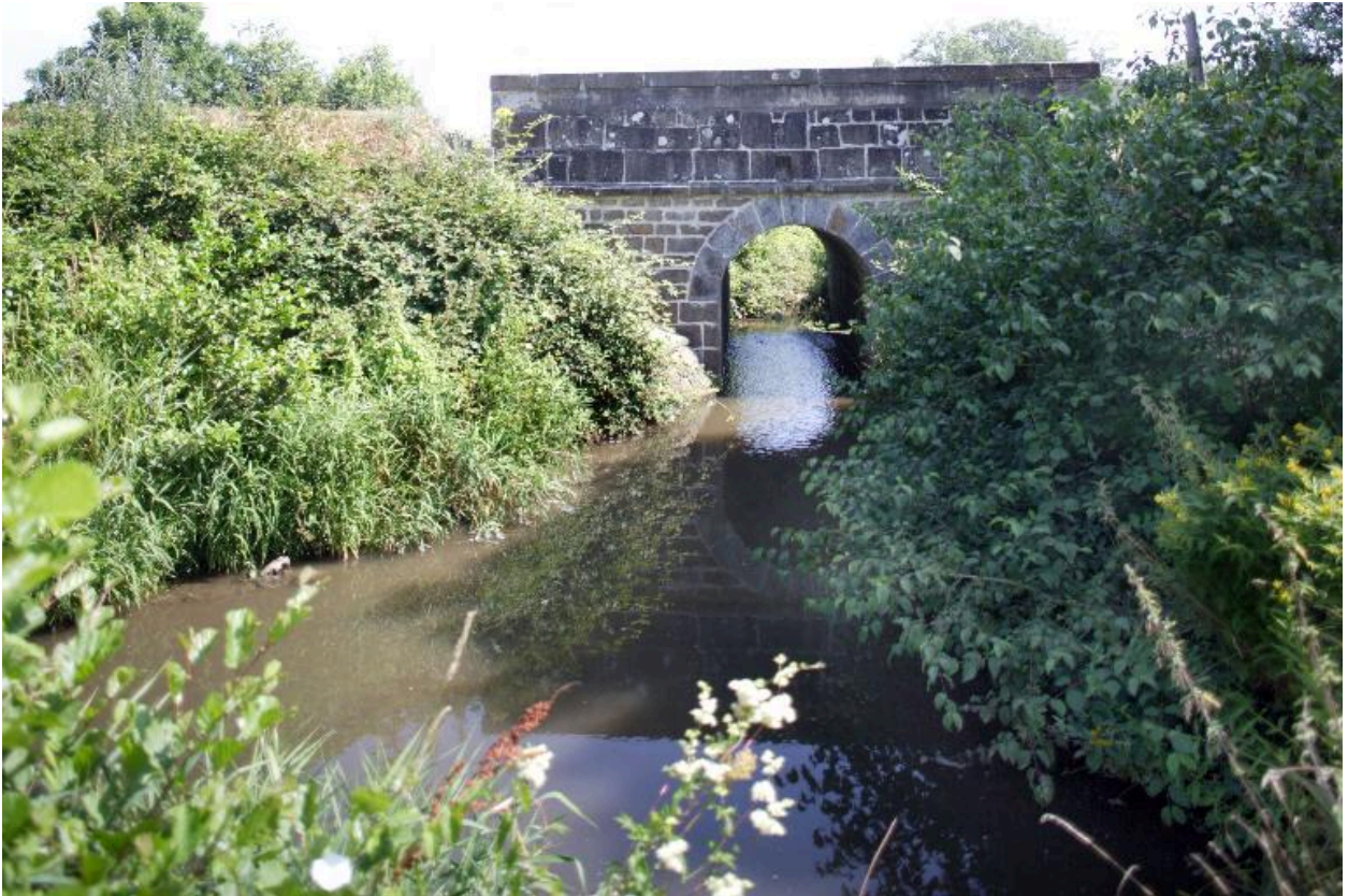
Le pont du ruisseau de Vienne.