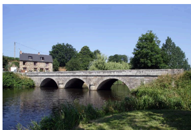
Le pont Landry vu depuis l'aval au sud.