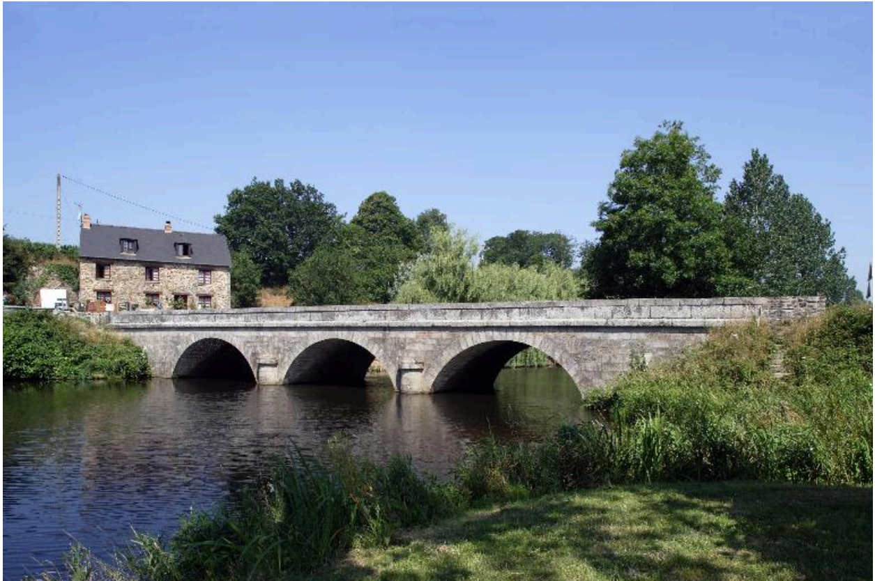
Le pont Landry vu depuis l'aval au sud.