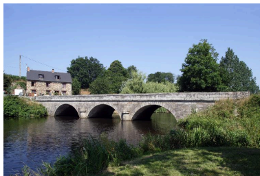
Le pont Landry vu depuis l'aval au sud.