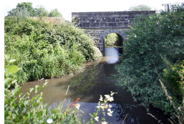
Le pont du ruisseau de Vienne.