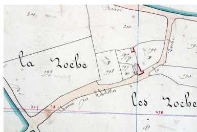
Extrait du plan cadastral de 1842, section E3.

Phot. François (reproduction) Lasa IVR52_20045302867NUCA