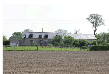
Vue d'ensemble depuis la route de Saint-Jean à l'ouest.

IVR52_20055301247NUCA