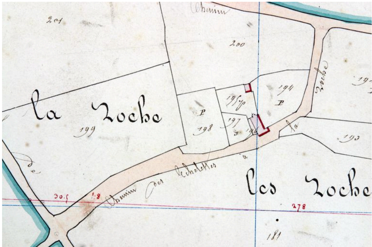
Extrait du plan cadastral de 1842,section E3.