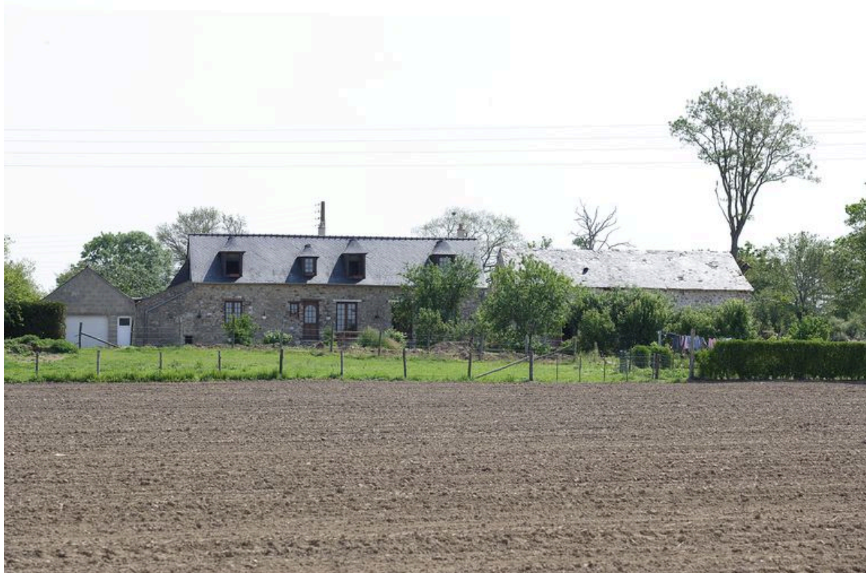
Vue d'ensemble depuis la route de Saint-Jean à l'ouest.