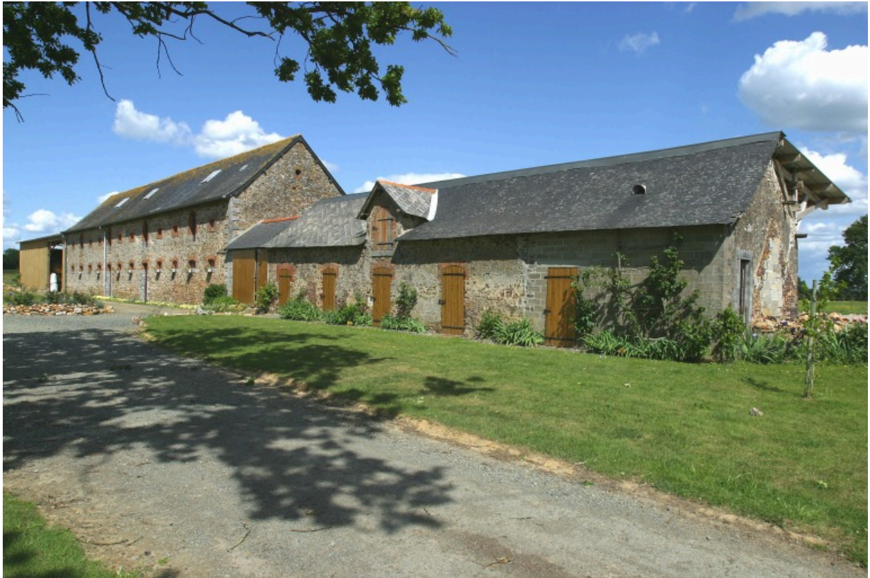
L'étable-grange et la porcherie.