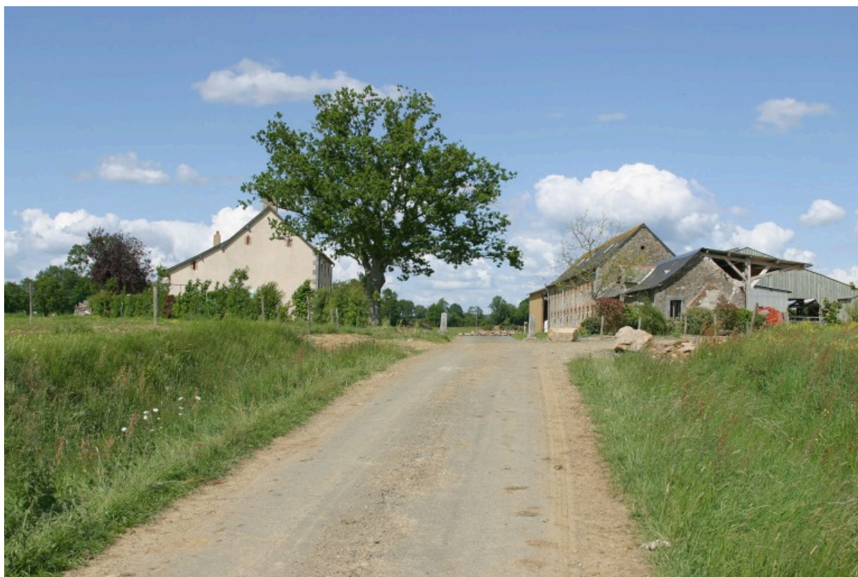
Vue d'ensemble depuis le sud-ouest.