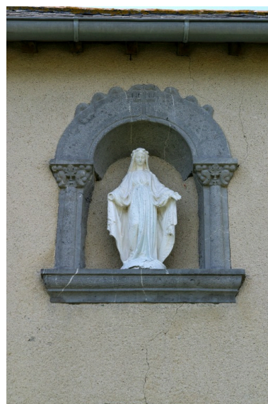
Détail de la façade principale du logis : la niche.