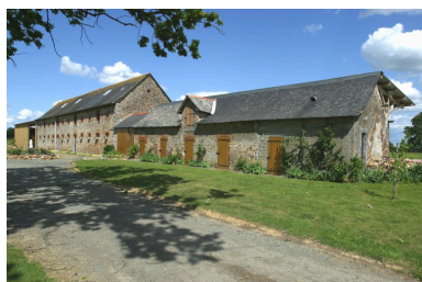
L'étable-grange et la porcherie. IVR52_20035301768NUCA