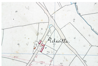
Extrait du plan cadastral de 1842, section E1.

Phot. François (reproduction) Lasa IVR52_20025301813NUCA