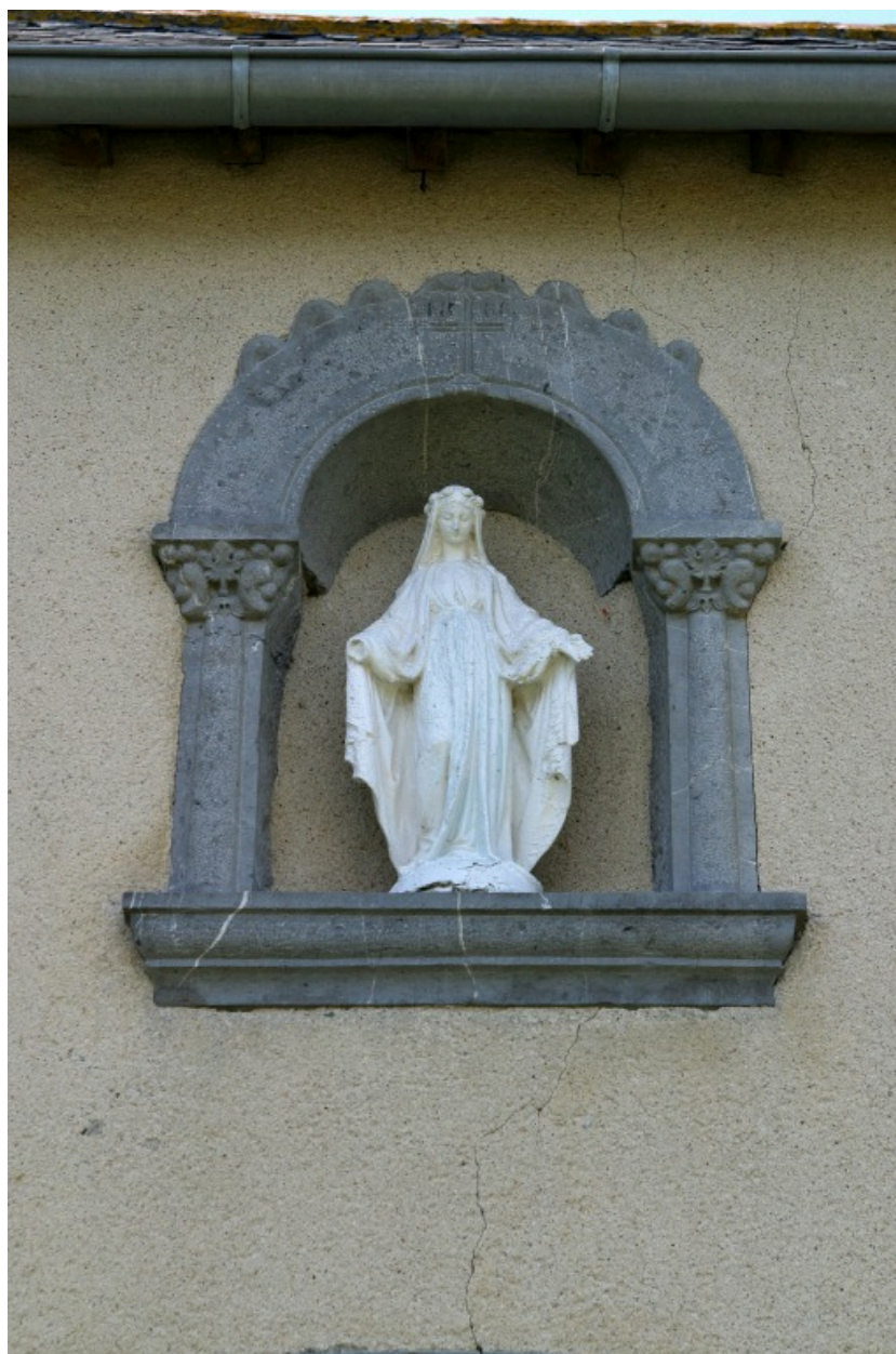
Détail de la façade principale du logis : la niche.