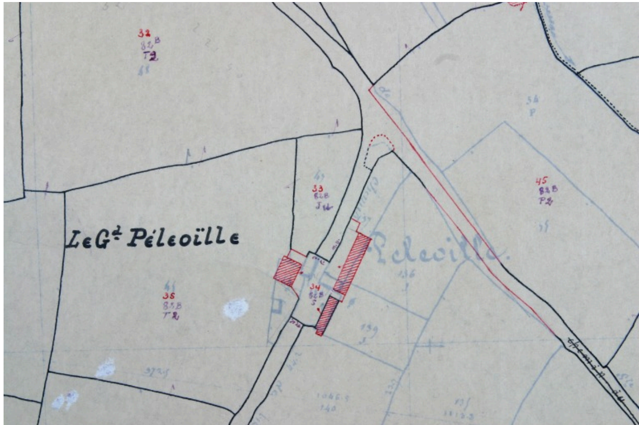
Extrait du plan cadastral de 1937, section E1.