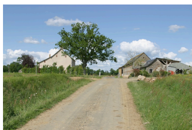
Vue d'ensemble depuis le sud-ouest. IVR52_20035301770NUCA