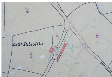
Extrait du plan cadastral de 1937, section E1.

IVR52_20025301813NUCA