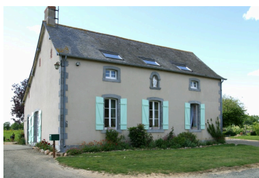
Le logis. IVR52_20035301767NUCA