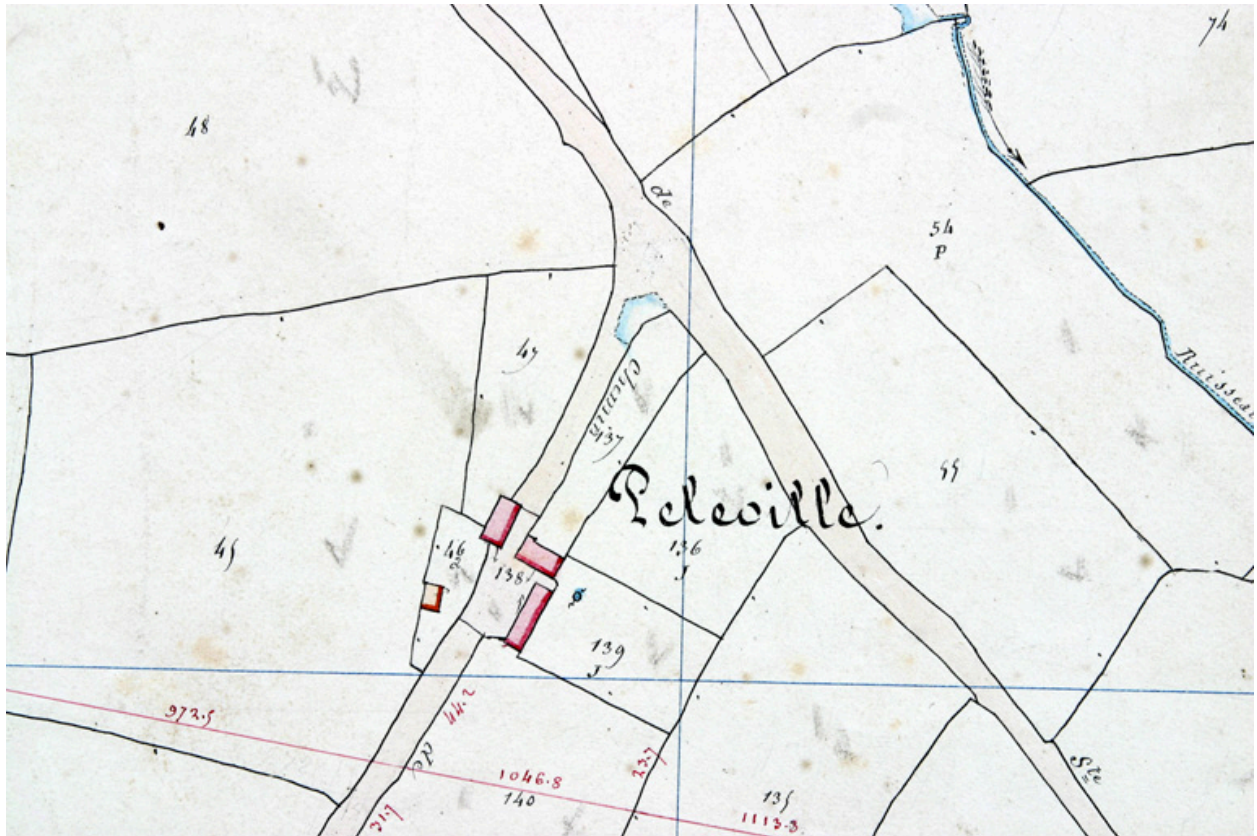
Extrait du plan cadastral de 1842, section E1.