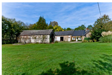
Ferme de la Basse-Cour, château du Bois-de-Maine, vue depuis le sud