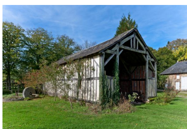
Entrée de la remise en pan de bois.