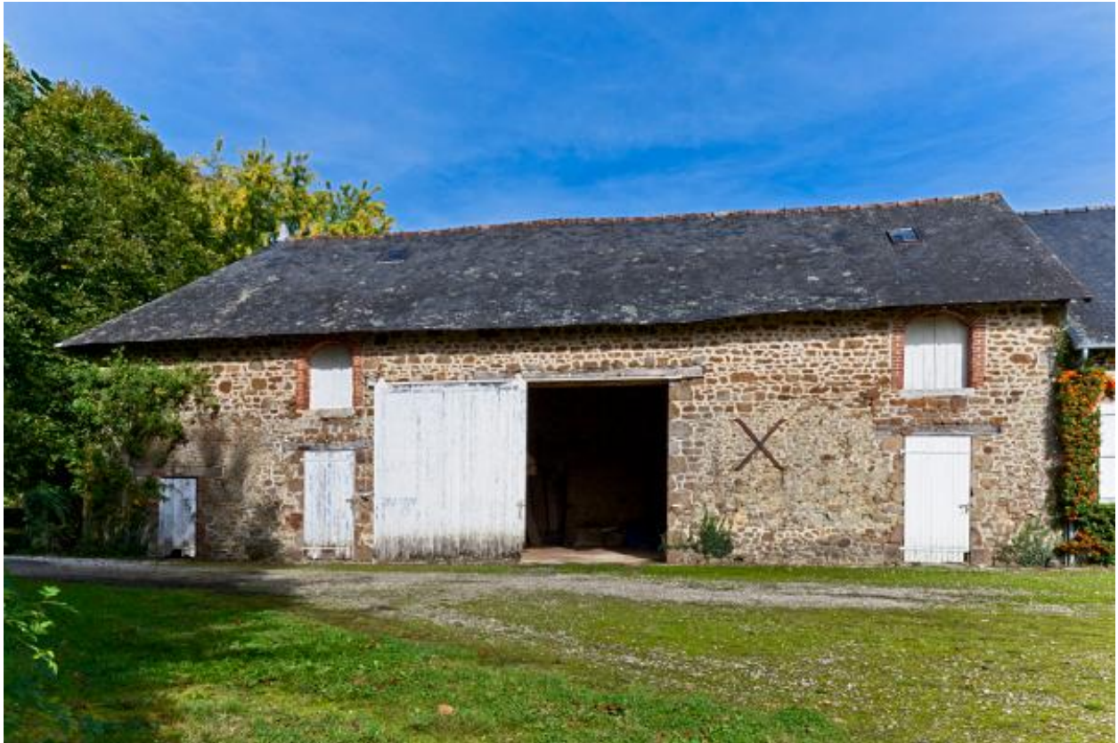
Grange-étable à fond de grange, mitoyenne de la maison.