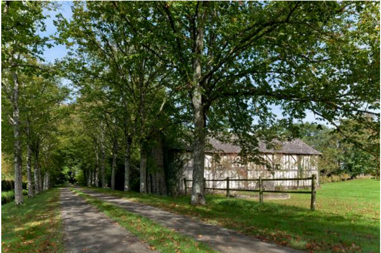
Allée d'arbres menant au château, remise et gadage.