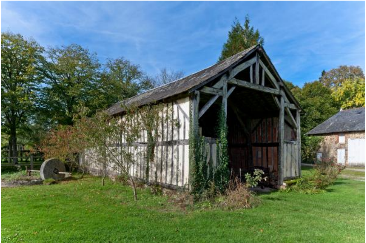
Entrée de la remise en pan de bois.