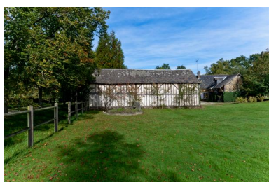
Remise en pan de bois et gadage, vus depuis le sud.