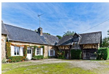
Maison et étable-grange de la ferme de la Basse-Cour IVR52_20175300212NUCA