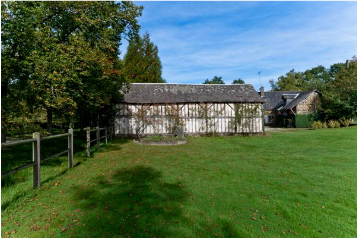
Remise en pan de bois et gadage, vus depuis le sud.