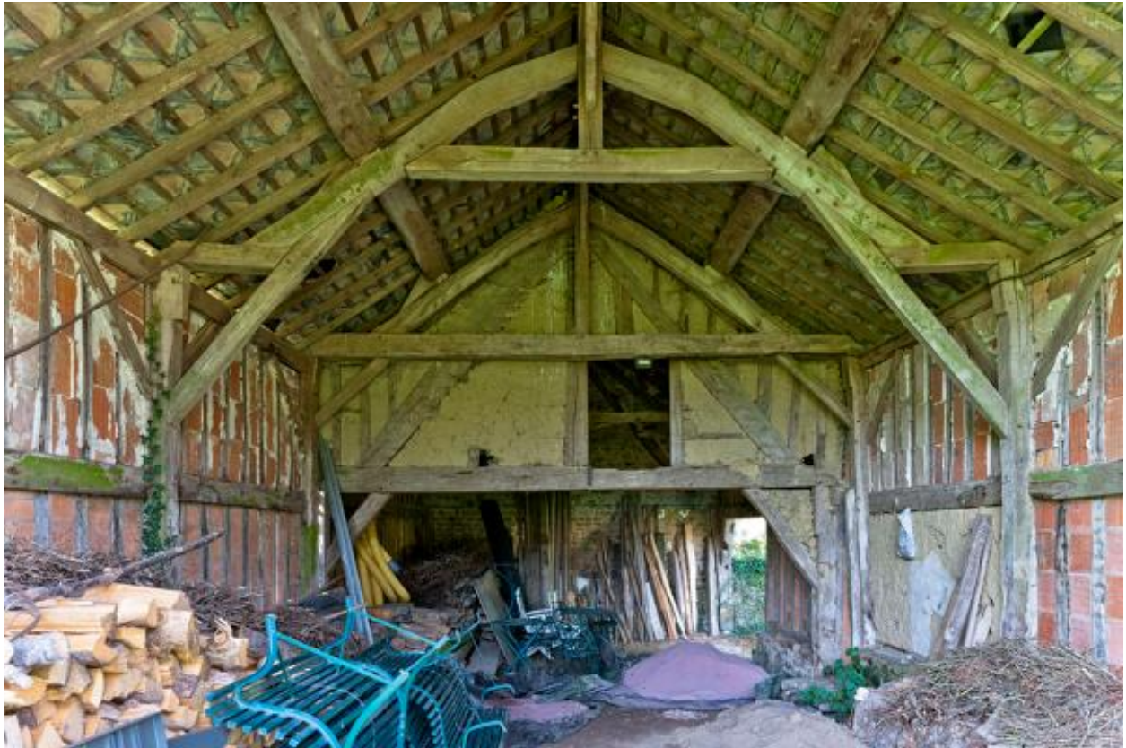
Intérieur de la remise en pan de bois ; au fond, une ferme sur poteaux ancienne.