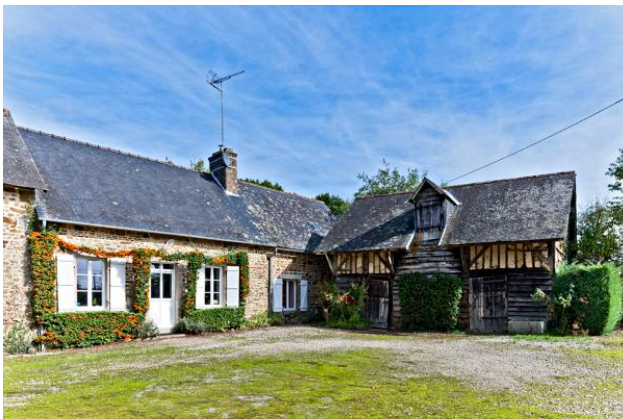
Maison et étable-grange de la ferme de la Basse-Cour