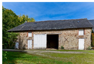
Grange-étable à fond de grange, mitoyenne de la maison. IVR52_20175300211NUCA