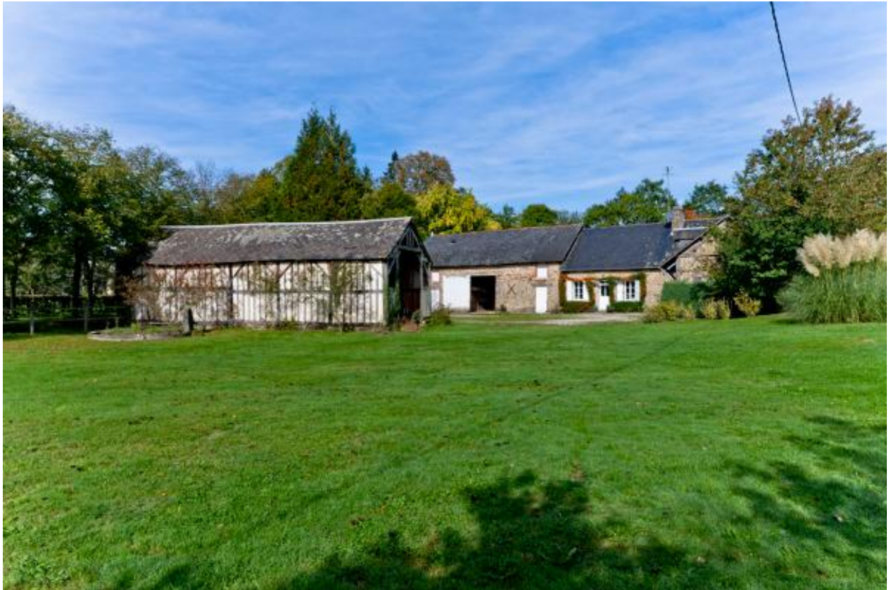
Ferme de la Basse-Cour, château du Bois-de-Maine, vue depuis le sud