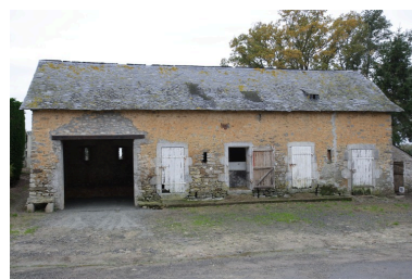
La porcherie vue depuis le nord.