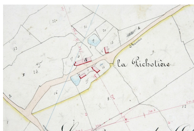
Extrait du plan cadastral de 1838, section A2.