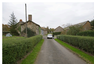
Vue d'ensemble depuis le chemin d'accès au nord-ouest : au premier plan, les pignons du fournil et de la porcherie ; au second, ceux du logis- étable-grange et de l'étable-grange.