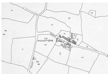
Extrait du plan cadastral révisé en 1966, réédité en 1982 et régulièrement mis à jour entre 1982 et 2006, section A2. IVR52_20065302396NUCA