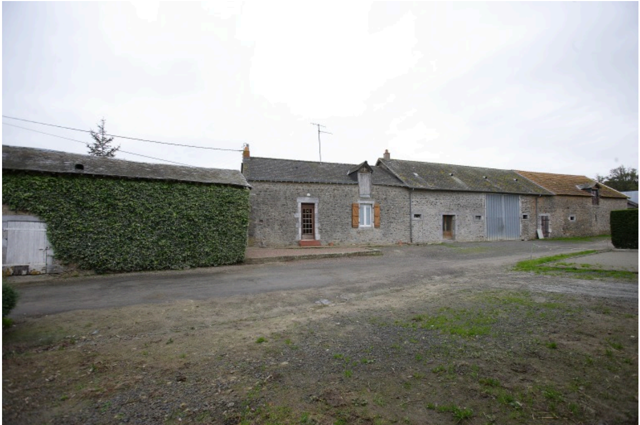
Le fournil et le logis-étable-grange vus depuis la cour au sud.