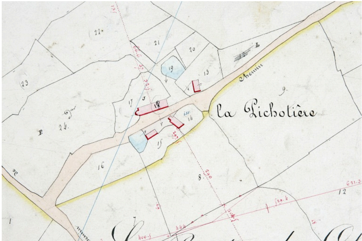
Extrait du plan cadastral de 1838, section A2.