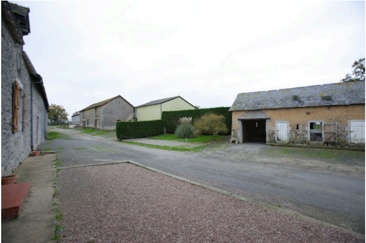
Vue d'ensemble depuis la cour au nord-ouest : à gauche, le logis-étable-grange ; au fond, l'étable-grange ; à droite, la porcherie.