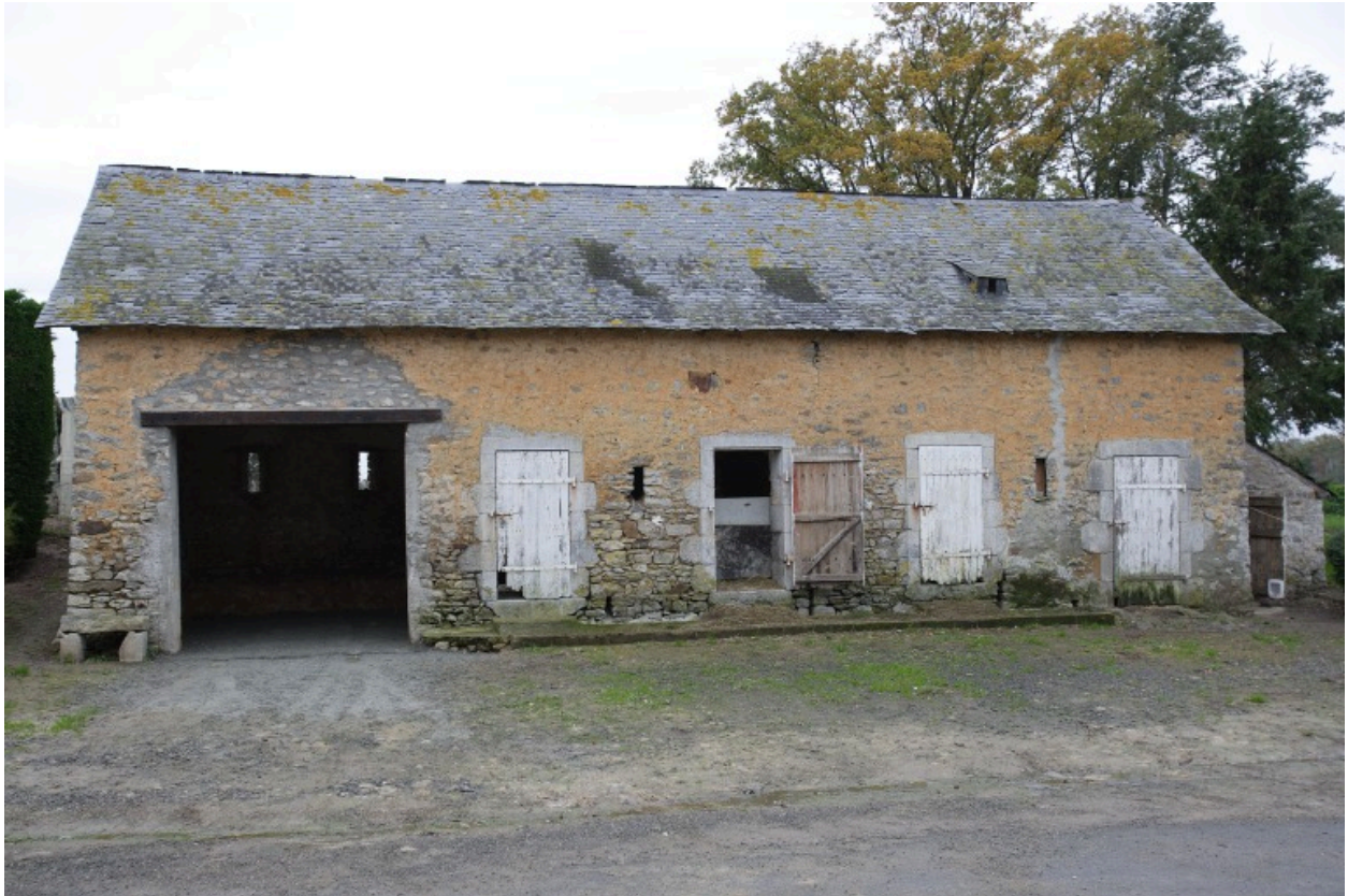
La porcherie vue depuis le nord.