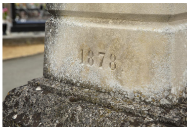
La date portée sur la croix de cimetière.