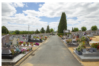
L'intérieur du cimetière.