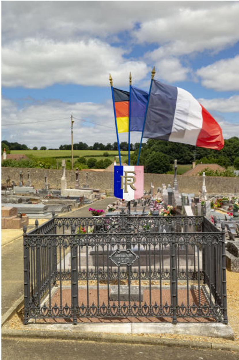
Le carré des morts de la guerre de 1870.