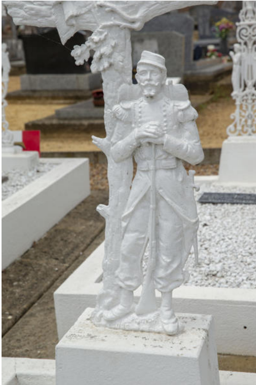
Un détail d'une tombe de soldat de la Première Guerre mondiale.