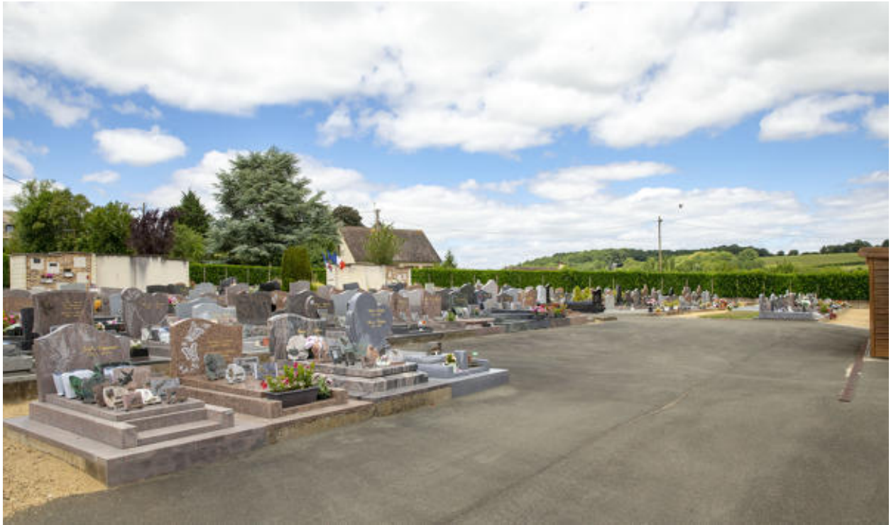
L'intérieur du cimetière.