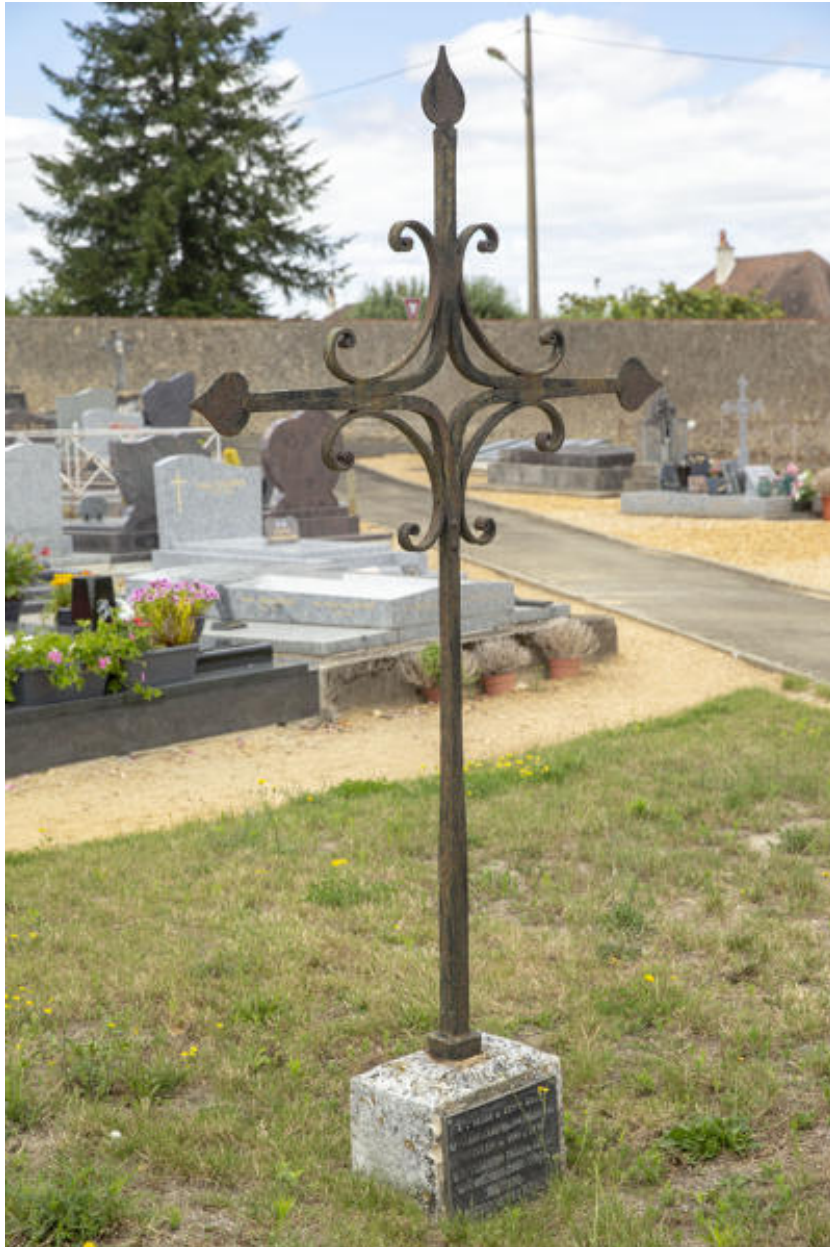
L'ancienne croix de cimetière.