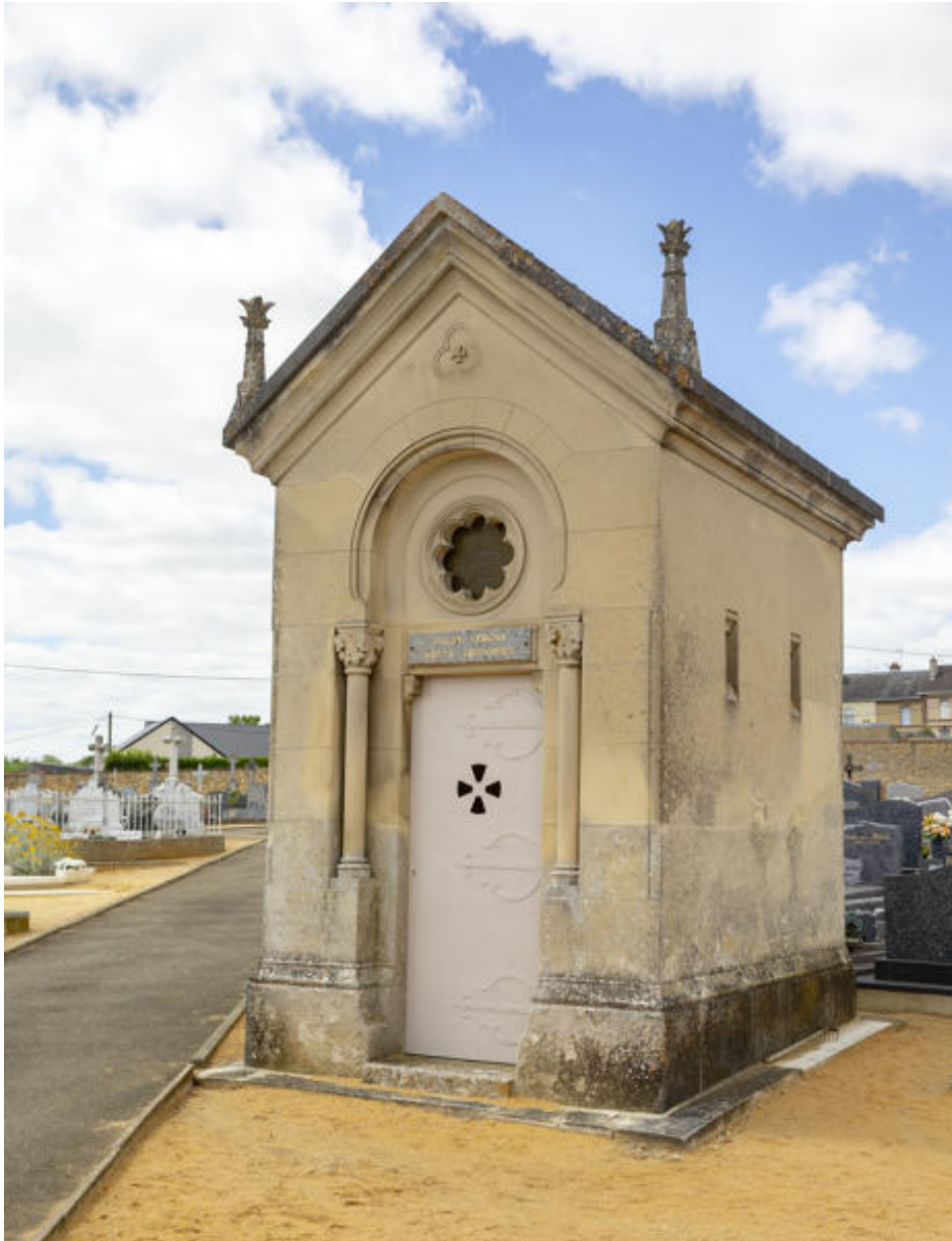
Une chapelle funéraire.