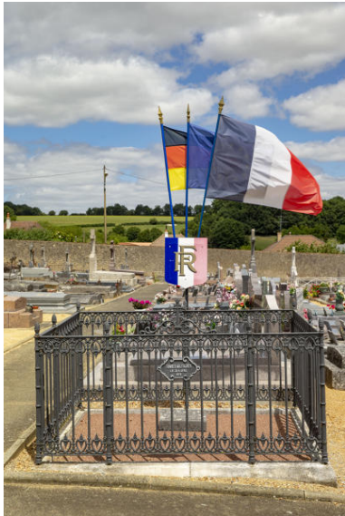
Le carré des morts de la guerre de 1870.