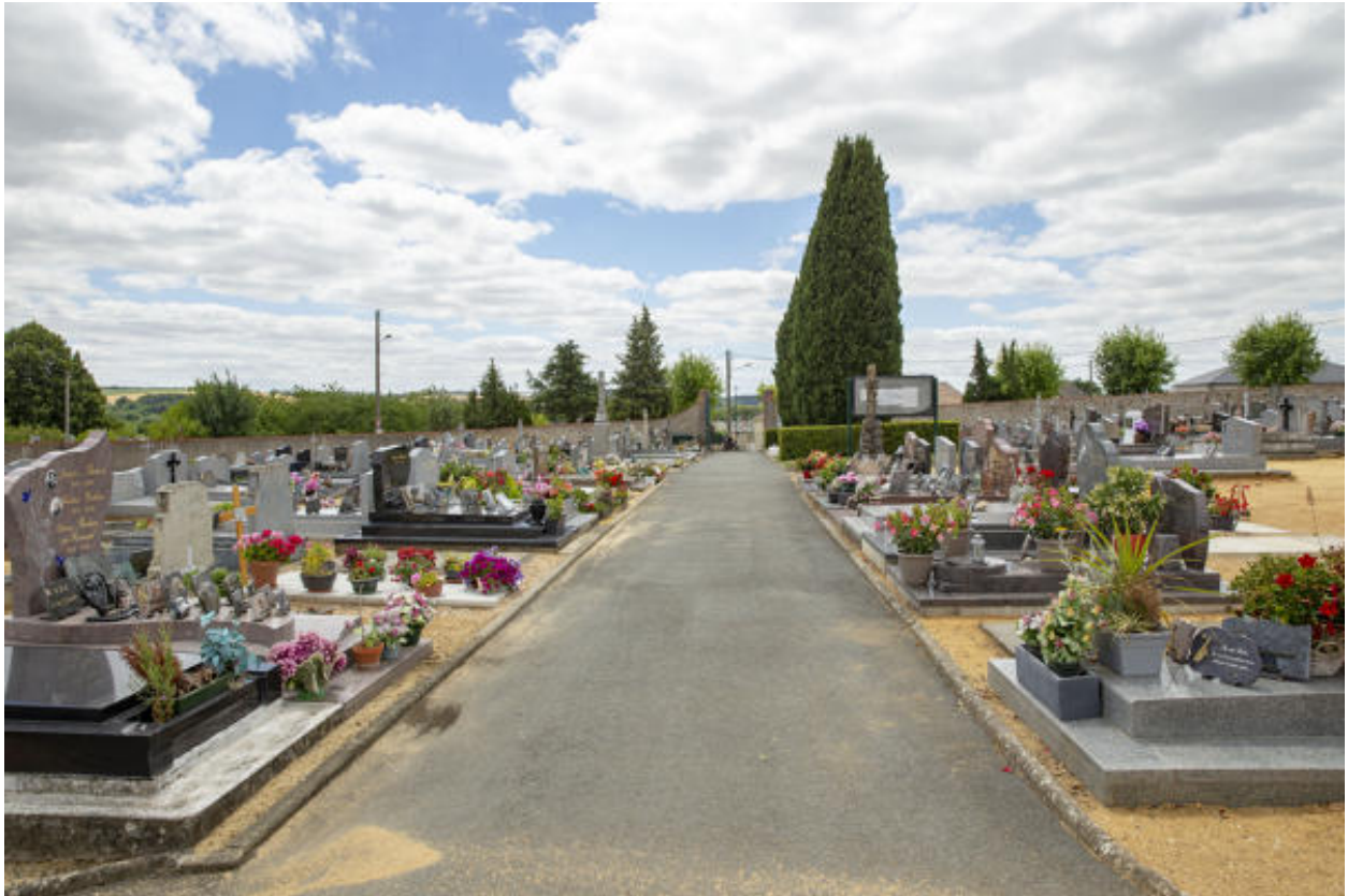
L'intérieur du cimetière.