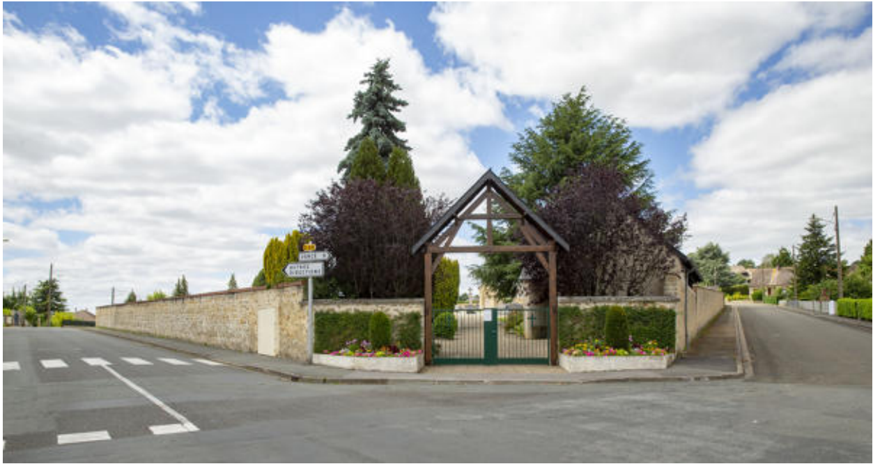
L'entrée principale du cimetière.