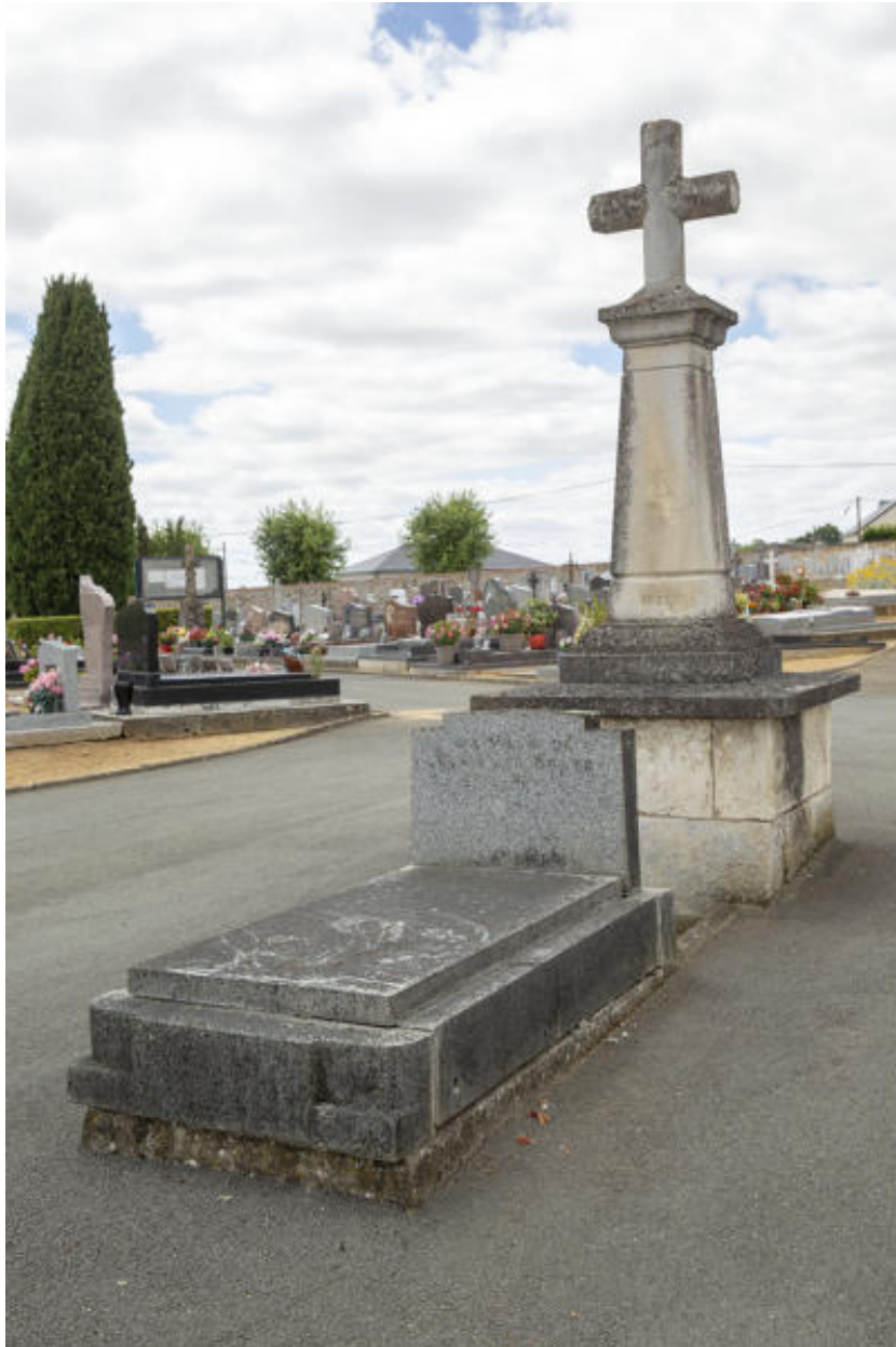
La croix de cimetière.