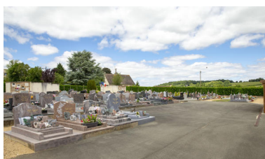
L'intérieur du cimetière.