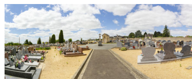
L'intérieur du cimetière. IVR52_20207200435NUCA