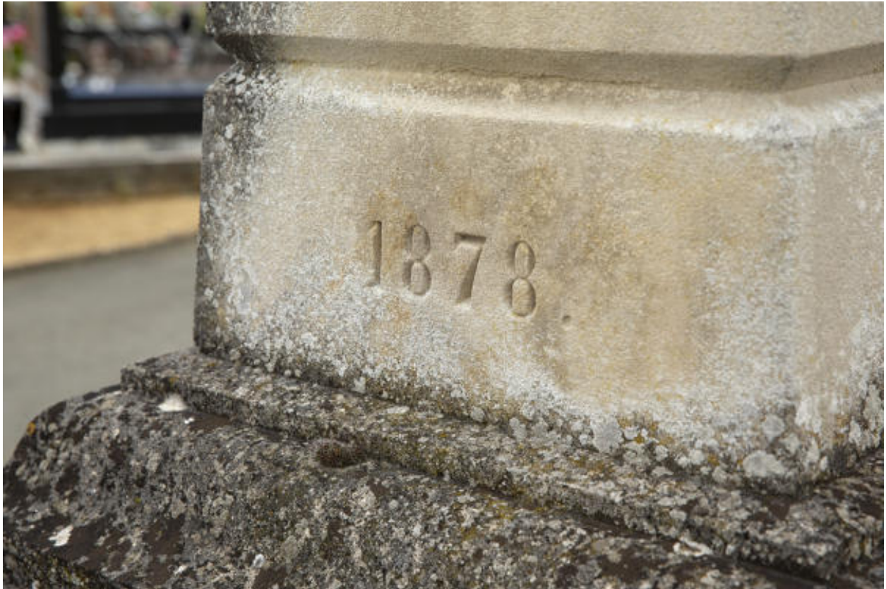
La date portée sur la croix de cimetière.