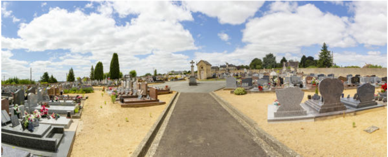
L'intérieur du cimetière.