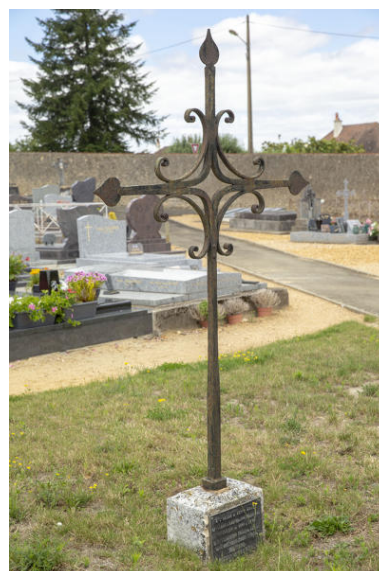
L'ancienne croix de cimetière. IVR52_20207200438NUCA