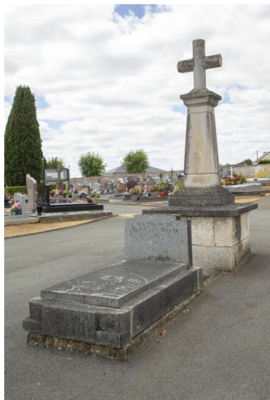
La croix de cimetière.