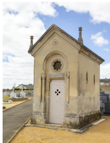
Une chapelle funéraire.