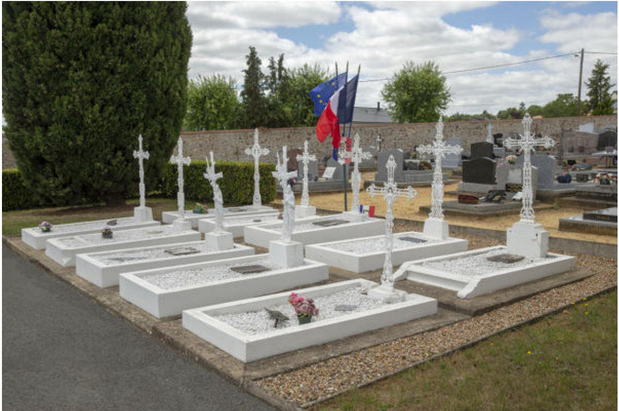
Les tombes des soldats de la Première Guerre mondiale.