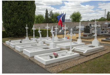
Les tombes des soldats de la Première Guerre mondiale.