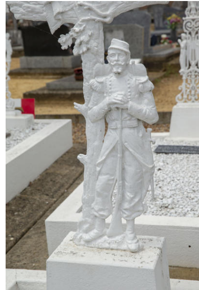
Un détail d'une tombe de soldat de la Première Guerre mondiale.