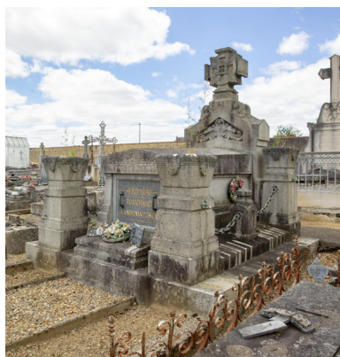
Un tombeau. IVR52_20207200455NUCA