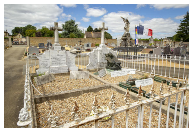
Un tombeau. IVR52_20207200459NUCA