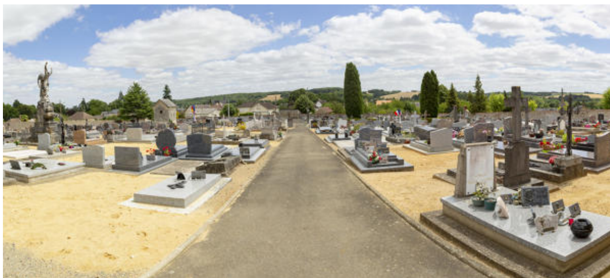
L'intérieur du cimetière.