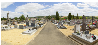
L'intérieur du cimetière. IVR52_20207200457NUCA