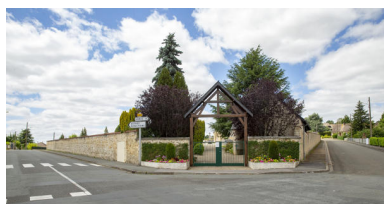
L'entrée principale du cimetière. IVR52_20207200434NUCA