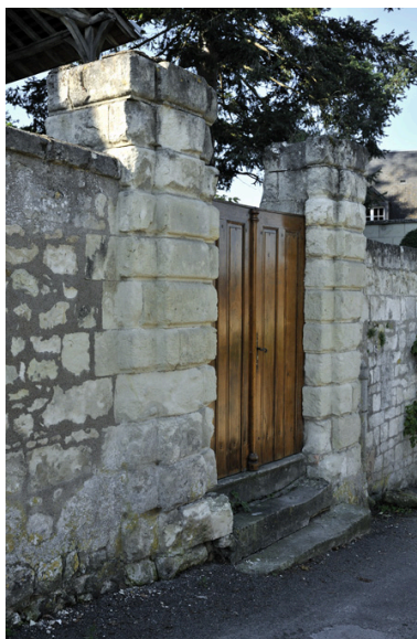
Portail à bossage. IVR52_20114902640NUCA