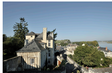
Vue d'ensemble de la maison et de sa situation. IVR52_20114902631NUCA