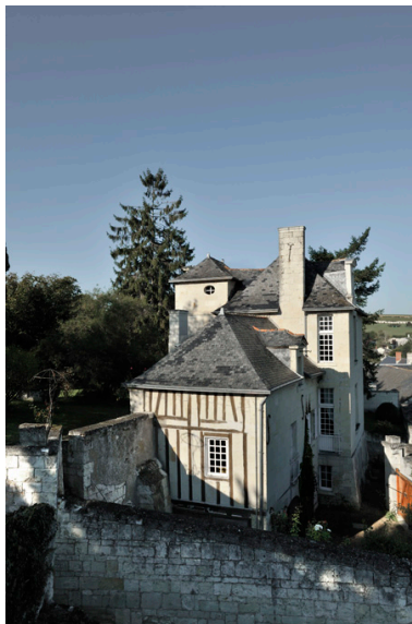
Vue d'ensemble depuis le coteau. IVR52_20114902630NUCA