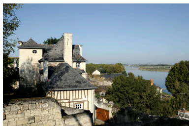
Façade est. IVR52_20114902635NUCA