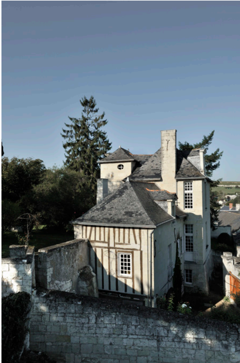
Vue d'ensemble depuis le coteau.