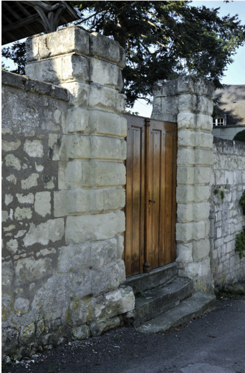
Portail à bossage.