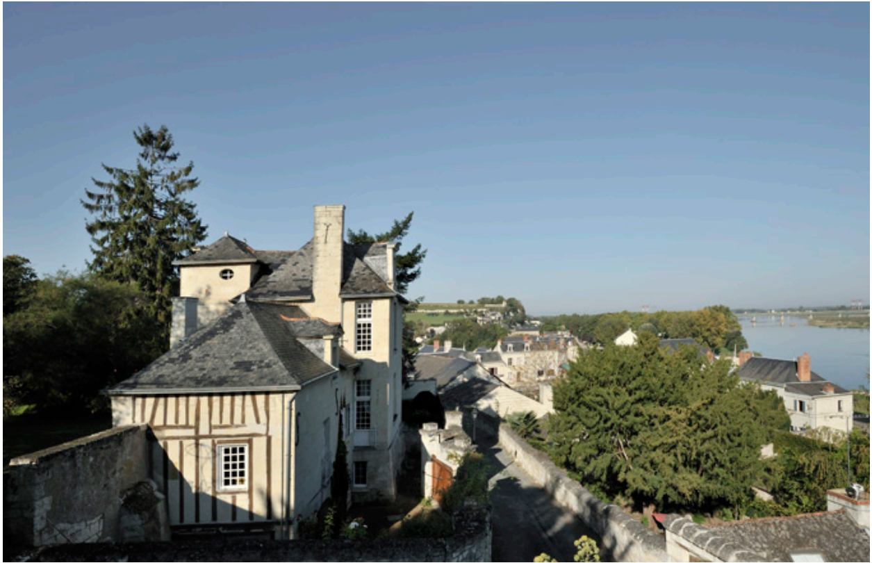
Vue d'ensemble de la maison et de sa situation.