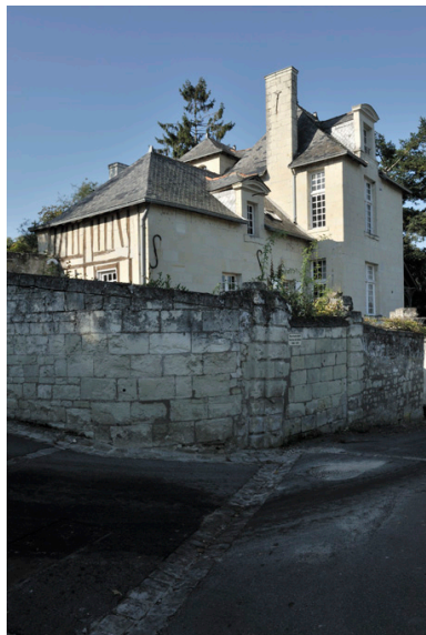
Vue générale. IVR52_20114902638NUCA