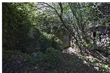
La maison avec, à gauche, son appentis détruit.