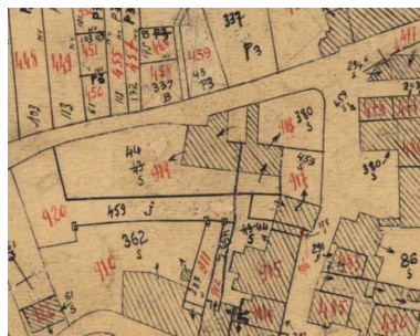
Cadastre rénové 1952. IVR52_20114400493NUCA