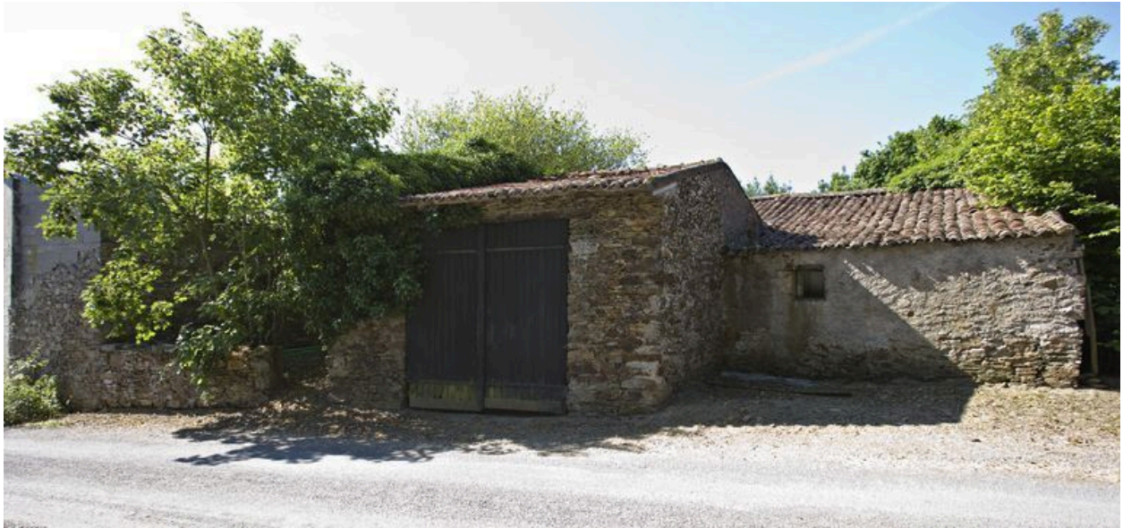
Façade sur voie : le muret de la cour, l'écurie et le cellier.