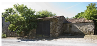
Façade sur voie : le muret de la cour, l'écurie et le cellier.