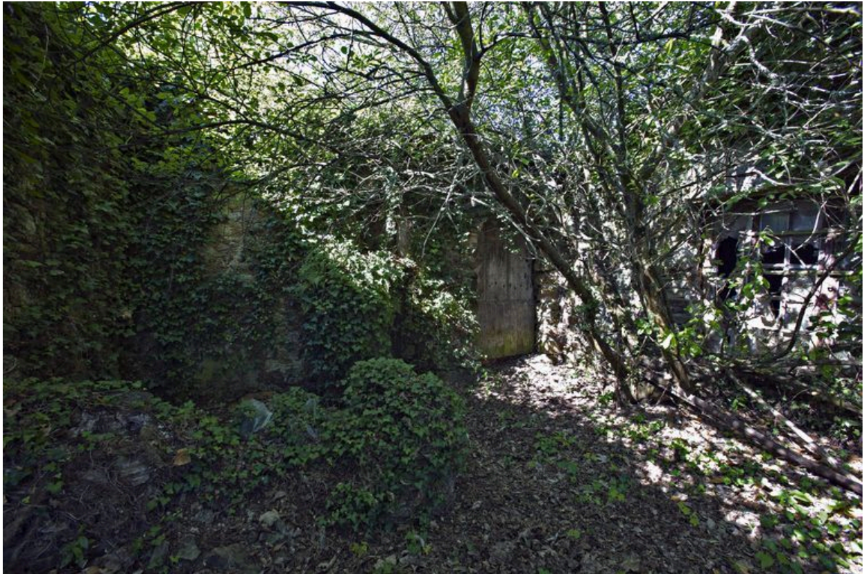
La maison avec, à gauche, son appentis détruit.