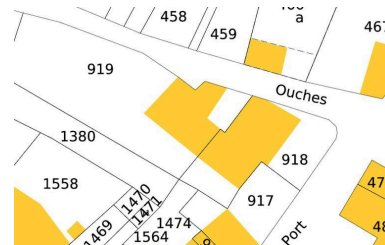
Cadastre 2011. IVR52_20114400494NUCA