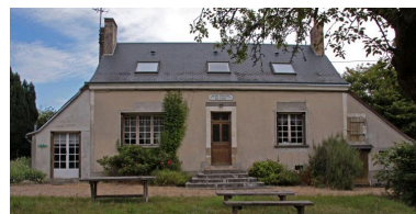
Maison forestière : façade antérieure. IVR52_20107201385NUCA