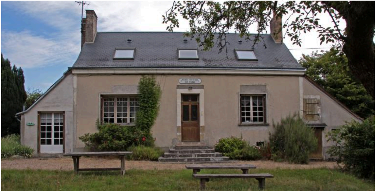
Maison forestière : façade antérieure.