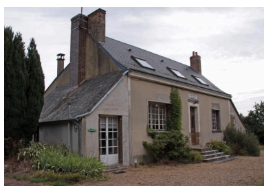
Vue de volume. IVR52_20107201386NUCA