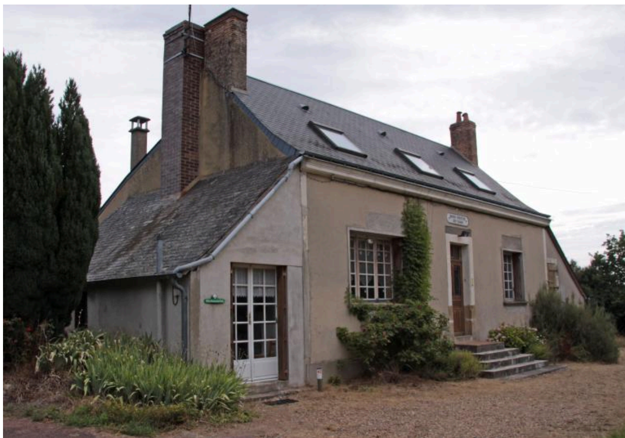
Vue de volume.