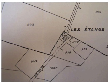
Extrait du plan cadastral de 1987. IVR52_20097201352NUCA