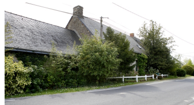
Vue d'ensemble depuis l'est. IVR52_20084401538NUCA