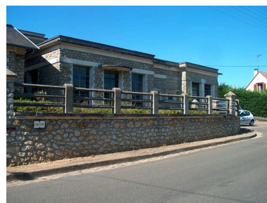
Elévation antérieure de la station d'épuration. IVR52_20057200654NUCA