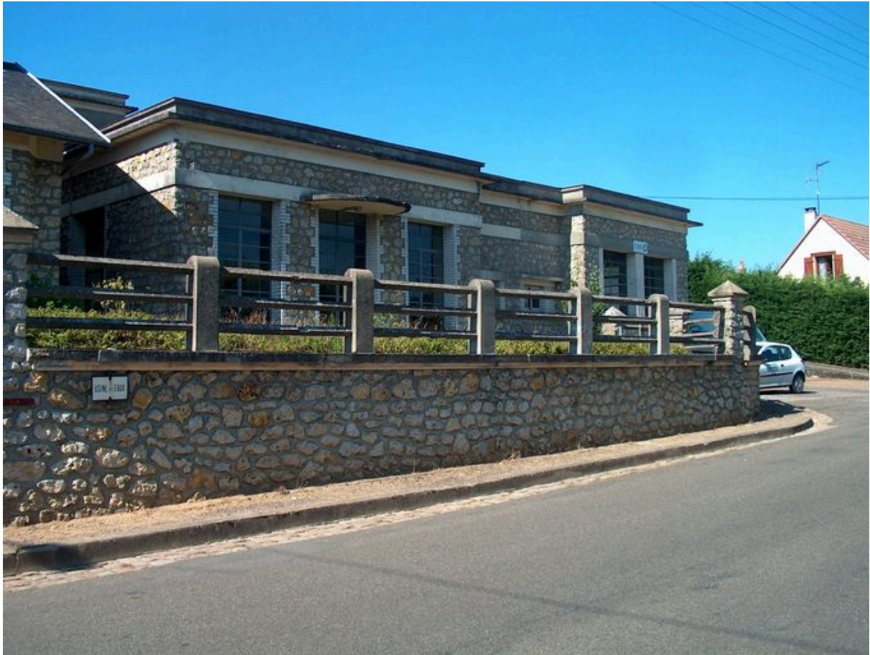
Elévation antérieure de la station d'épuration.