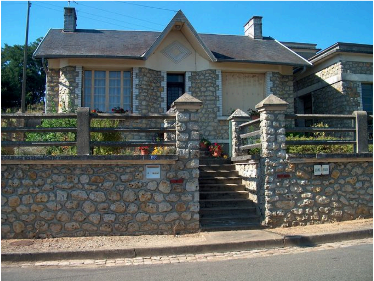
Elévation antérieure du logement.