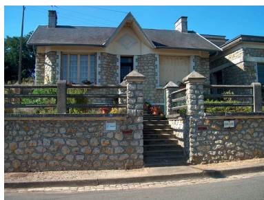
Elévation antérieure du logement.