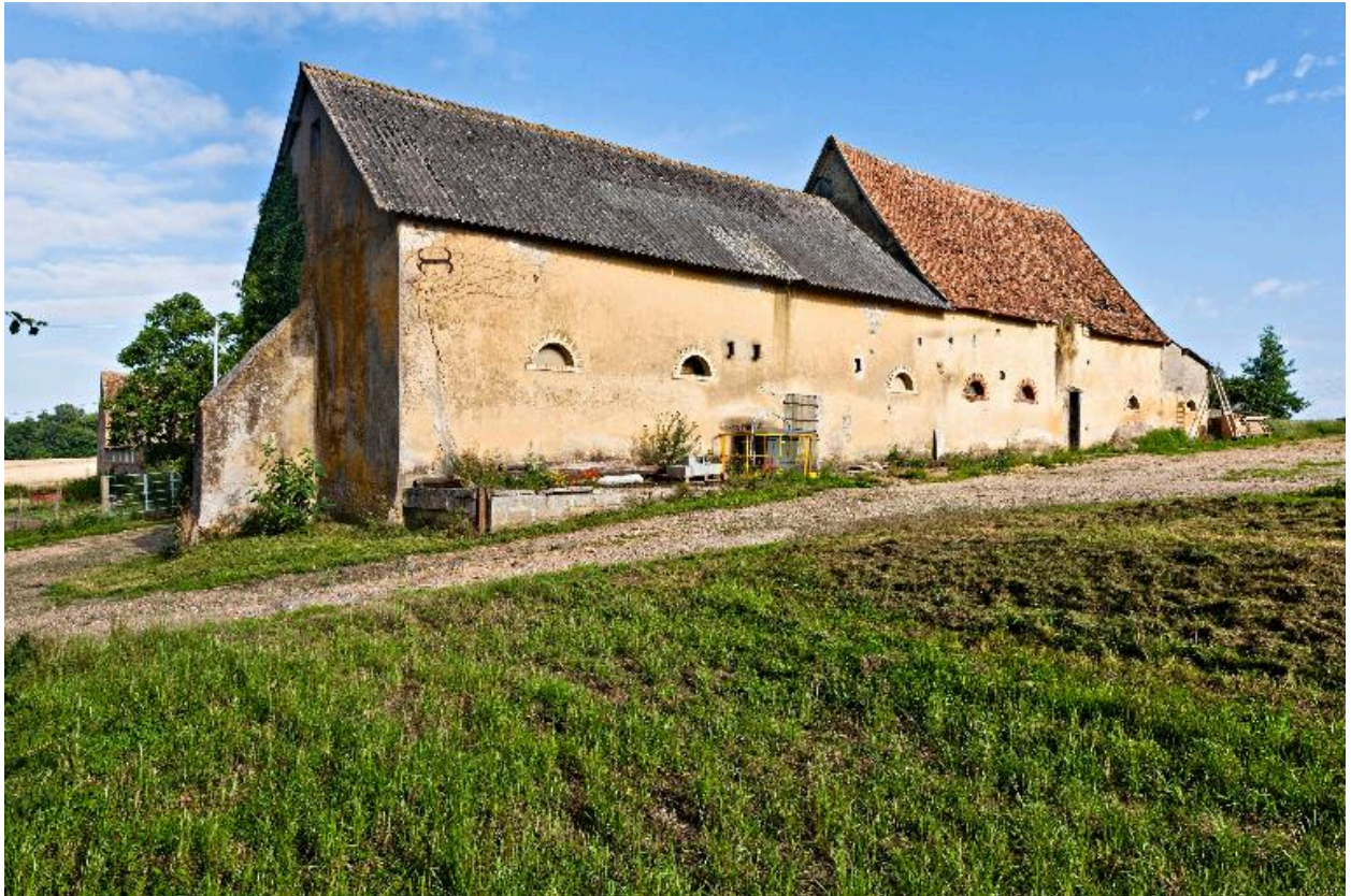
Elévations postérieures de la grange-étable et des étables.