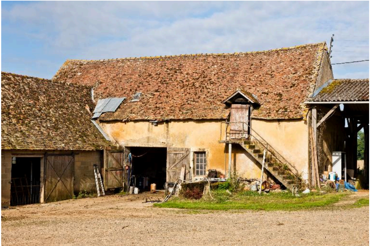
Elévation antérieure du cellier et du logement (?)