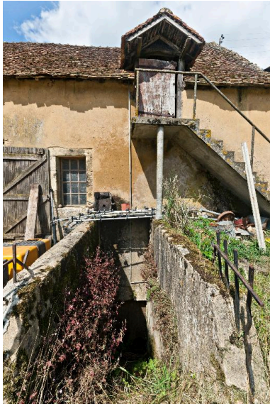
Escalier du cellier.

Elévation antérieure du cellier et du logement (?)