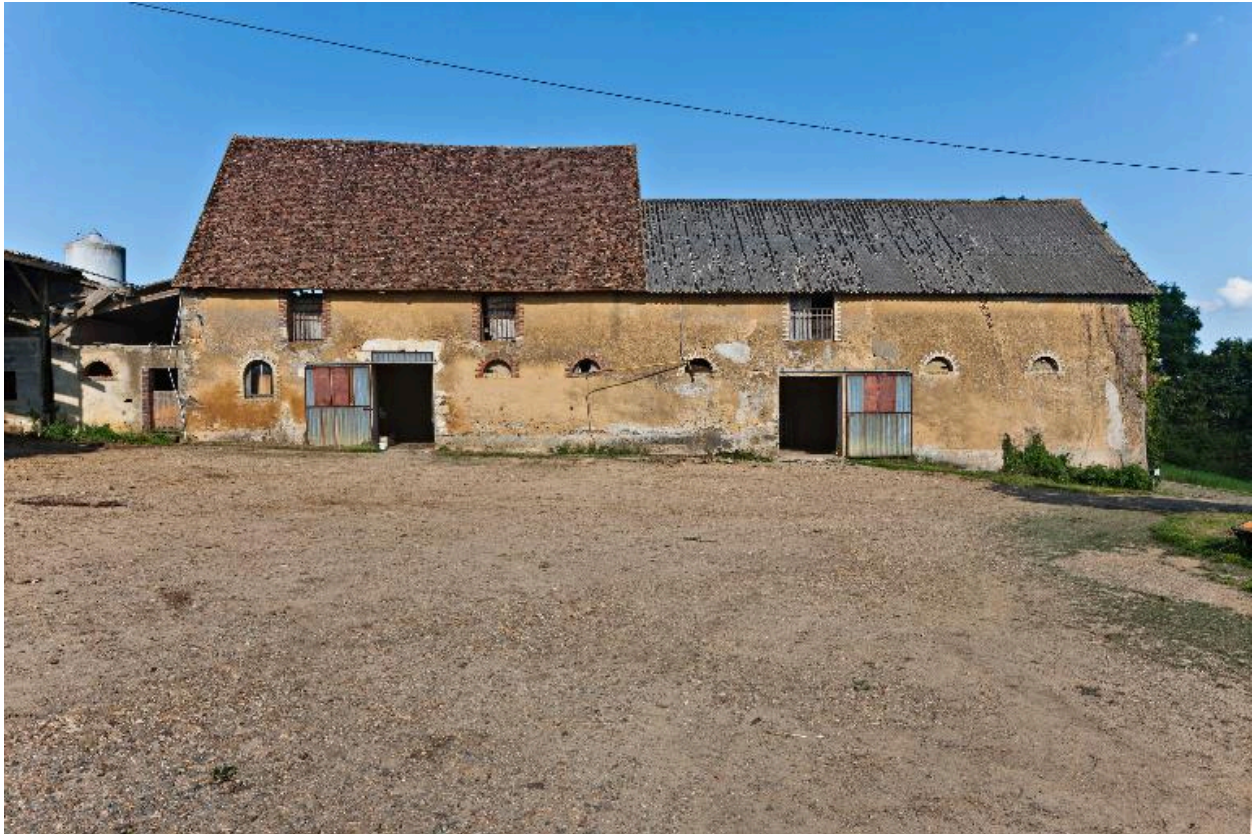
Elévations antérieures de la grange-étable et des étables.