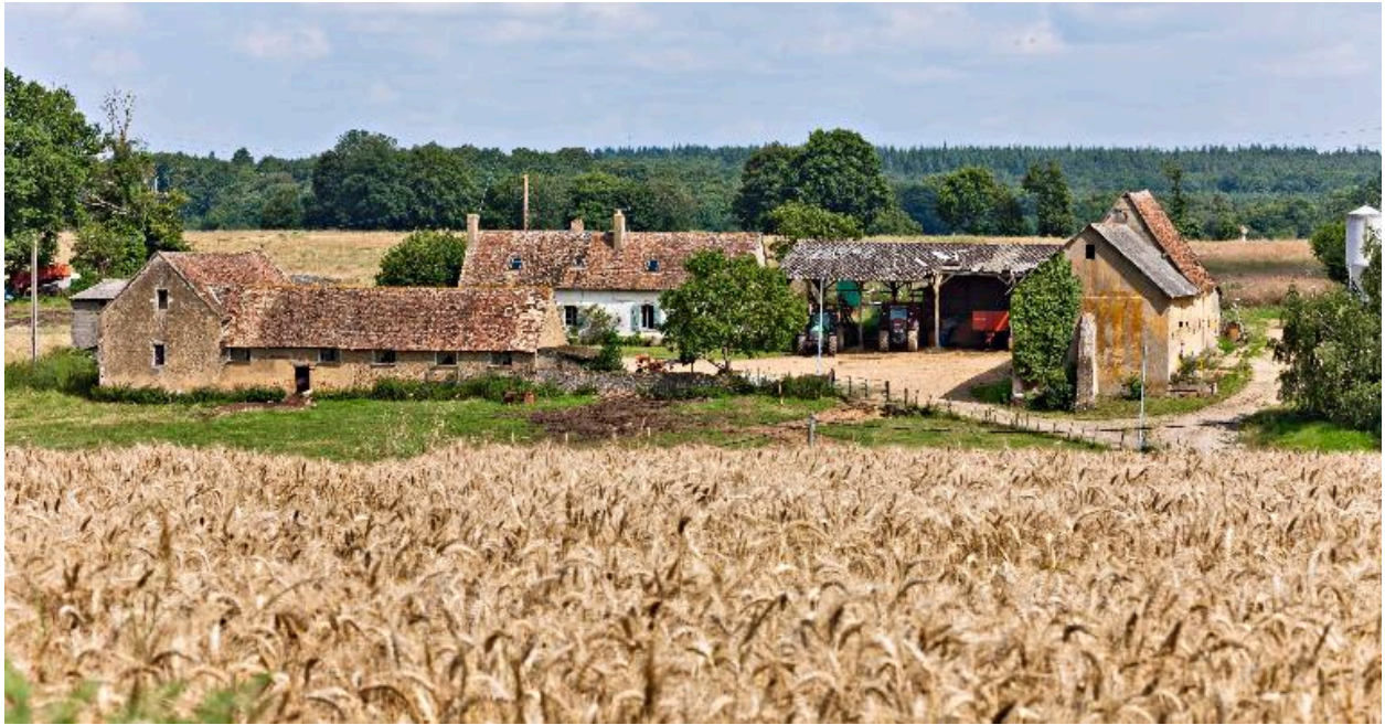
Vue générale de la ferme depuis le sud.