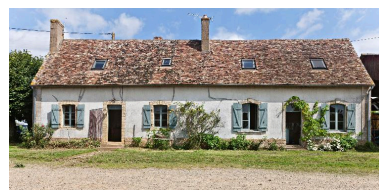
Élévation antérieure du logis. IVR52_20147201848NUCA