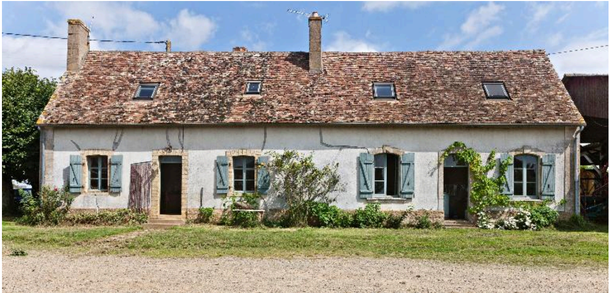
Elévation antérieure du logis.