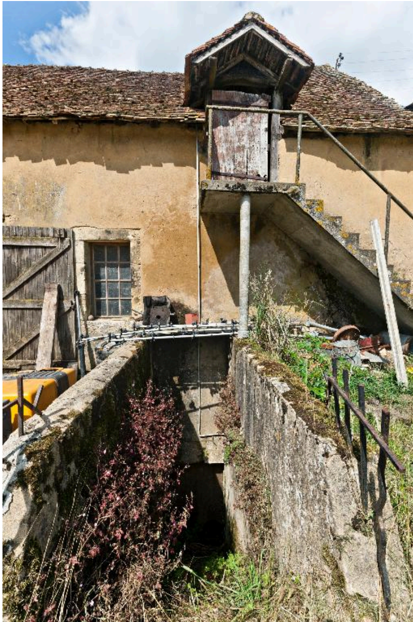
Escalier du cellier.