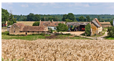
Vue générale de la ferme depuis le sud.