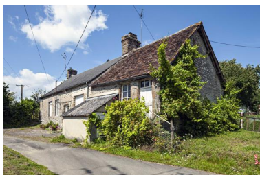
Maison, 23-25 rue des Aubépines (2023 B 423-424). IVR52_20215300904NUCA