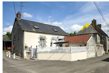
Maison, 12 rue des Aubépines (2023 ZB 410). IVR52_20215300903NUCA