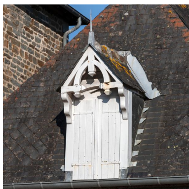
Maison, 23 rue Réaumur. IVR52_20195300524NUCA