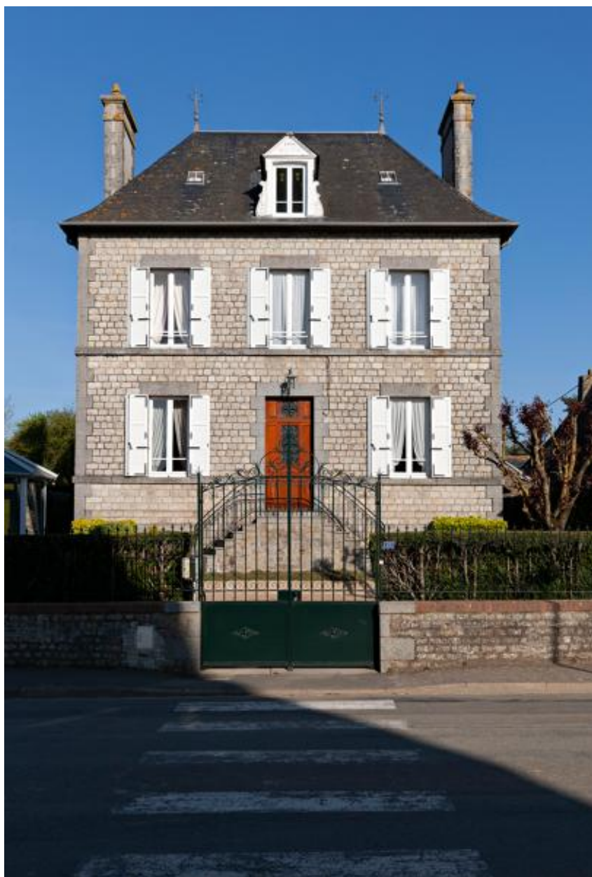
Maison, 23 rue Réaumur.