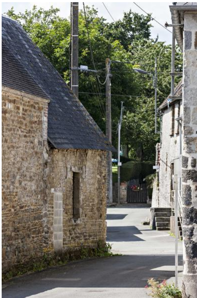
Rue des Aubépines.