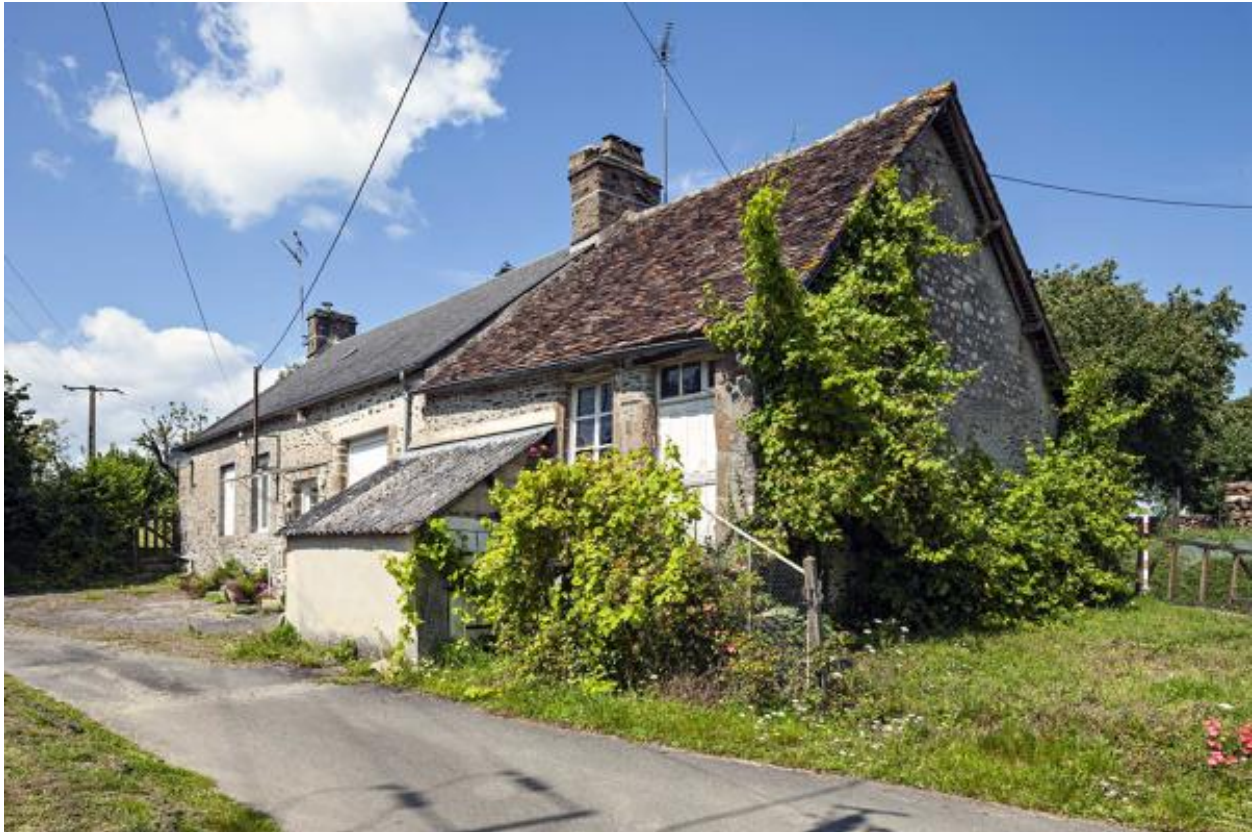
Maison, 23-25 rue des Aubépines (2023 B 423-424).