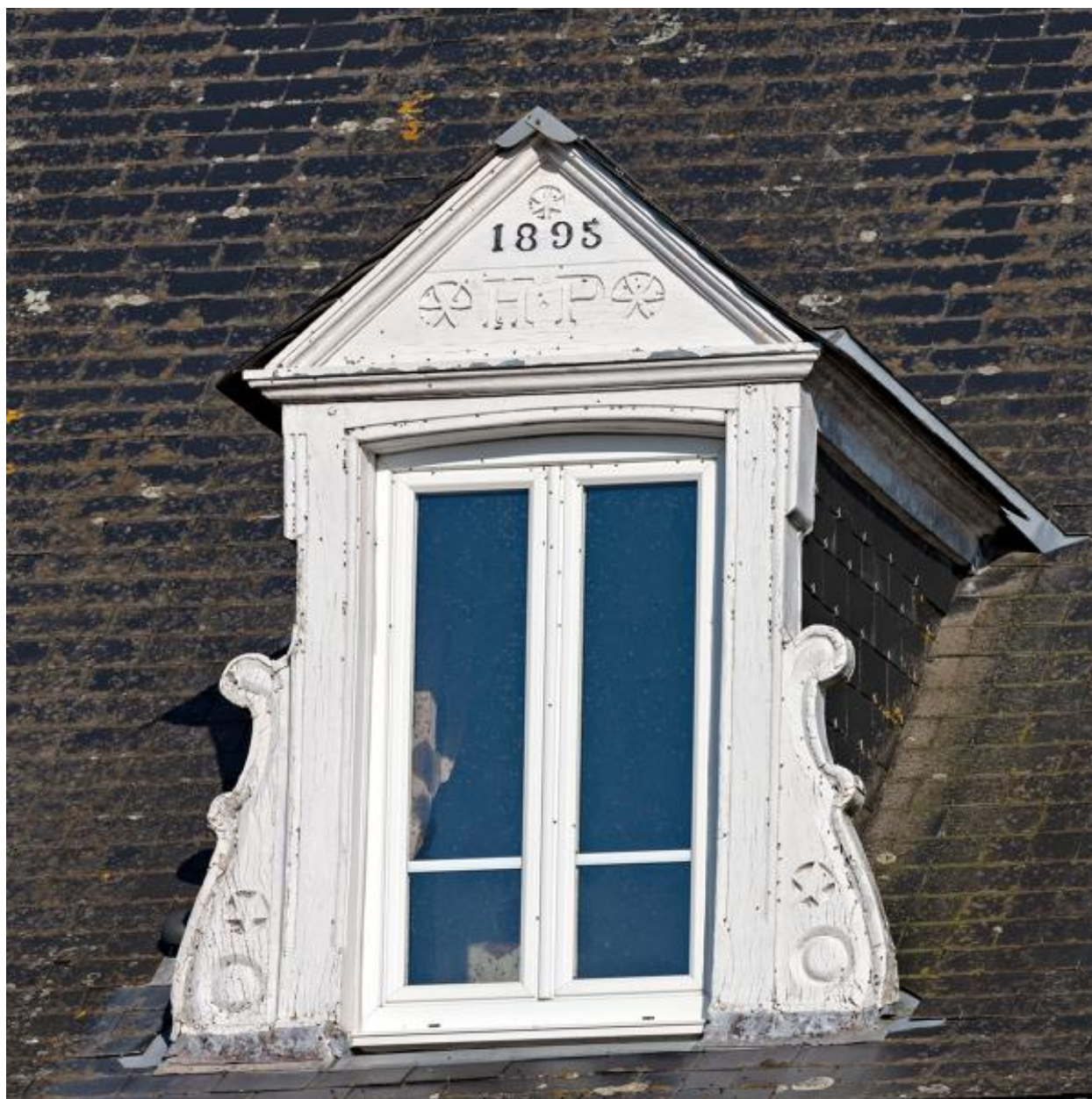
Maison, 23 rue Réaumur.