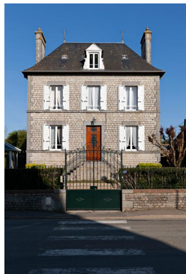
Maison, 23 rue Réaumur.