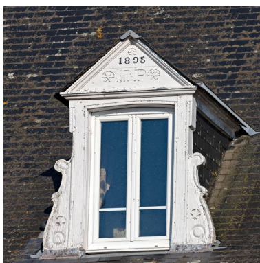
Maison, 23 rue Réaumur.