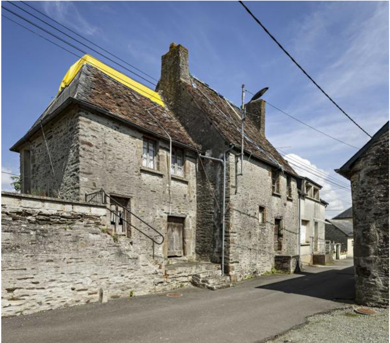
Maison, 8 bis rue des Aubépines (2023 B 403).