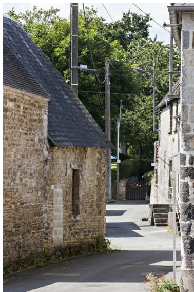
Rue des Aubépines. IVR52_20215300905NUCA