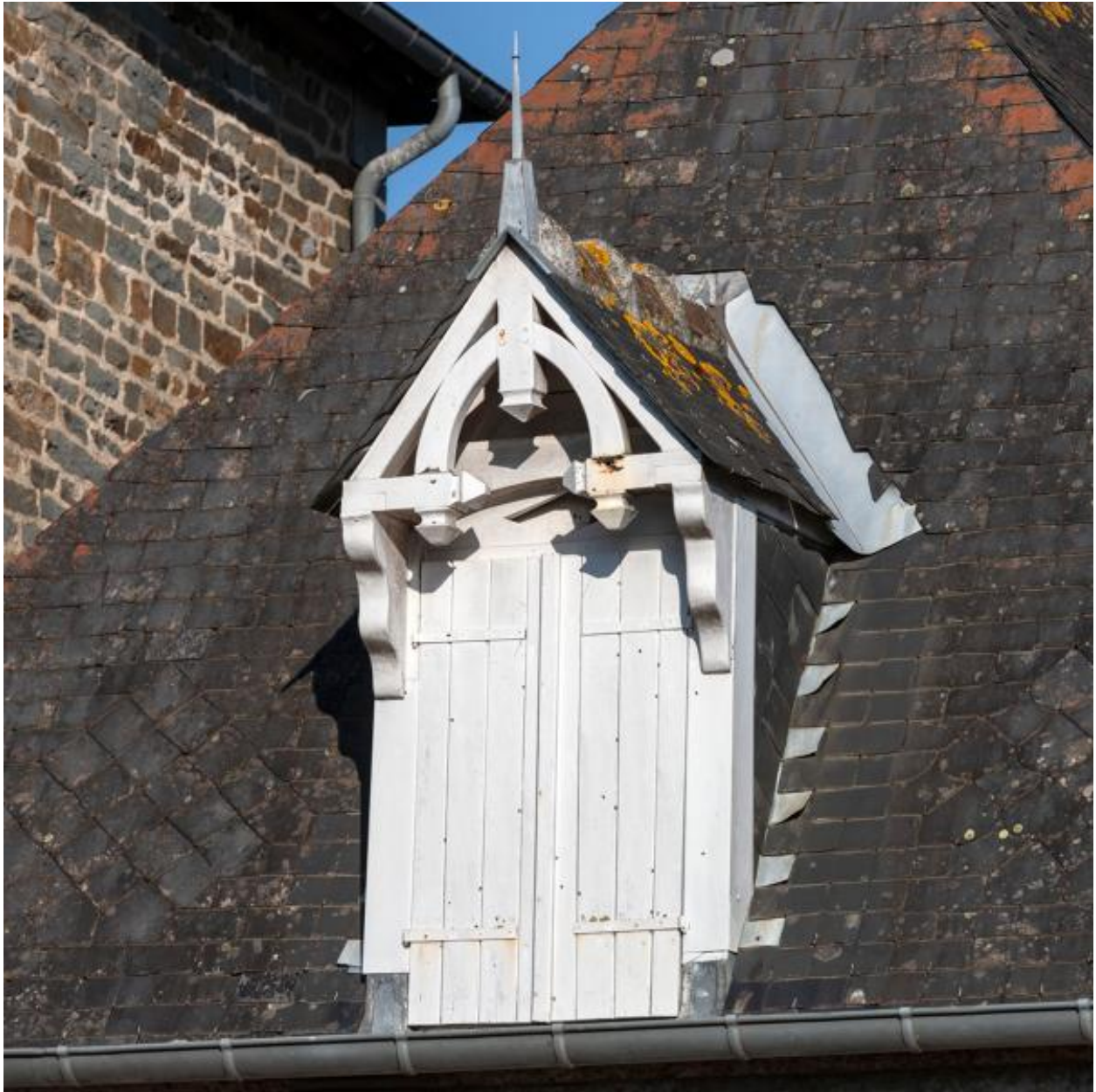
Maison, 23 rue Réaumur.