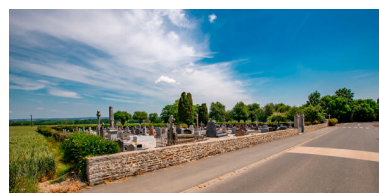
Cimetière. IVR52_20235300862NUCA