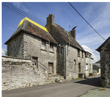
Maison, 8 bis rue des Aubépines (2023 B 403). IVR52_20215300902NUCA