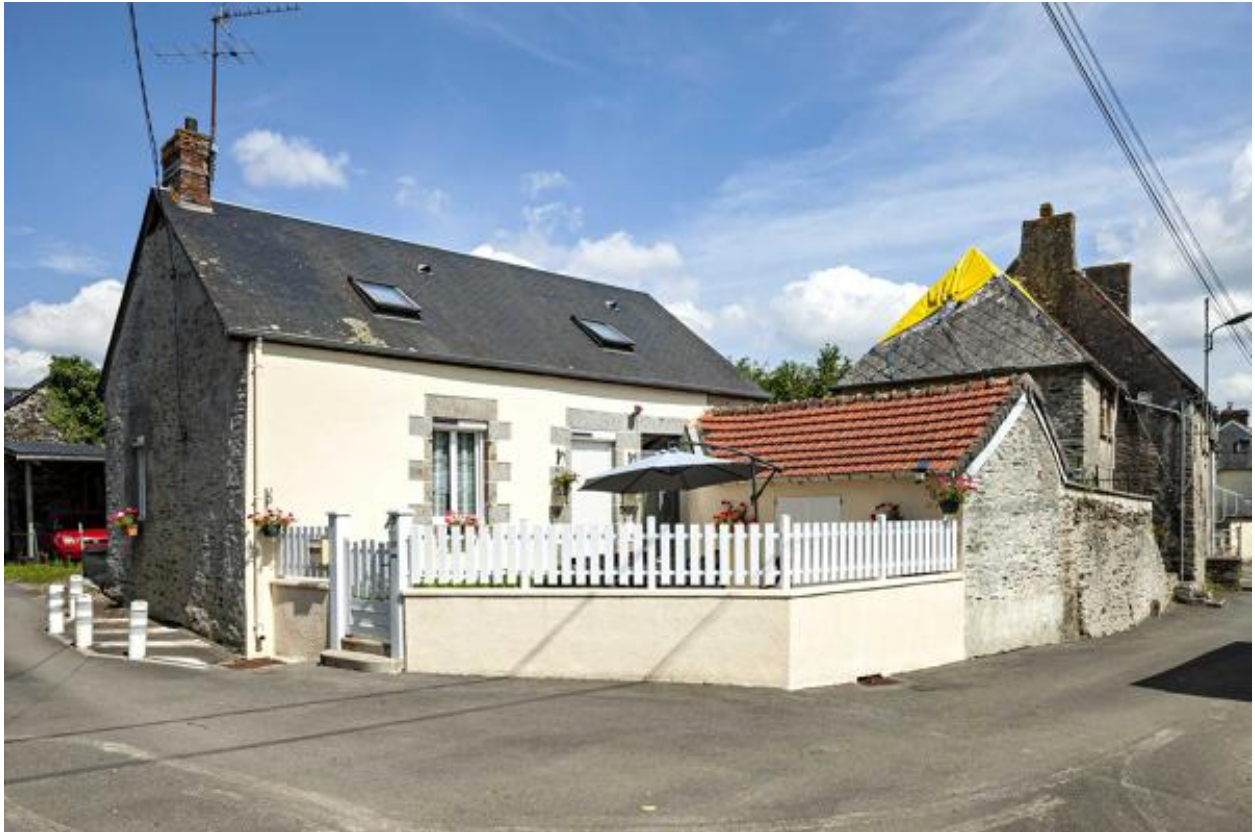
Maison, 12 rue des Aubépines (2023 ZB 410).