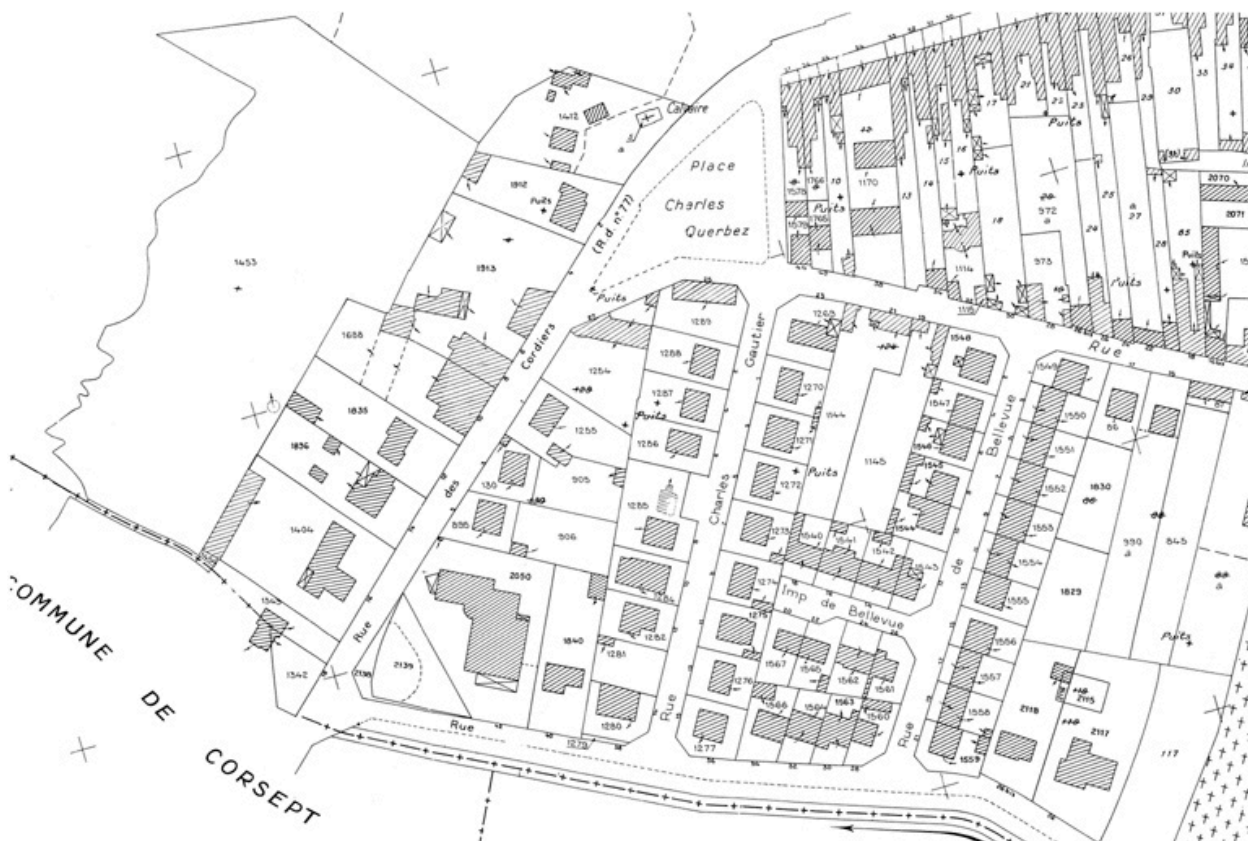
Plan cadastral, 1999, extrait.