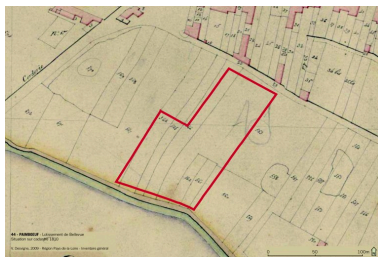
Situation sur cadastre 1810. IVR52_20094400541NUDA