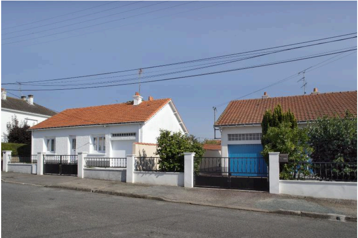
Un pavillon de type V4, rue de Bellevue.