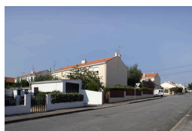
La rue de Bellevue. IVR52_20054401527NUCA