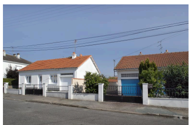
Un pavillon de type V4, rue de Bellevue. IVR52_20054401524NUCA