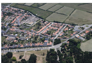
Vue aérienne de la pointe aval de la commune, à droite du cimetière, la rue de Bellevue.