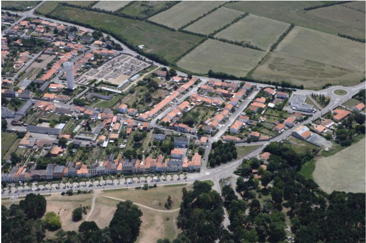
Vue aérienne de la pointe aval de la commune, à droite du cimetière, la rue de Bellevue.