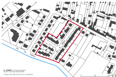
Situation sur données cadastrales 2008. IVR52_20094400542NUDA