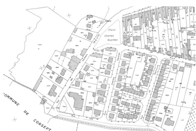
Plan cadastral, 1999, extrait.