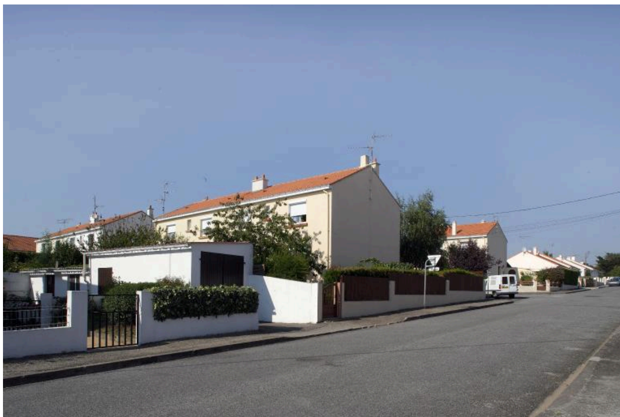
La rue de Bellevue.