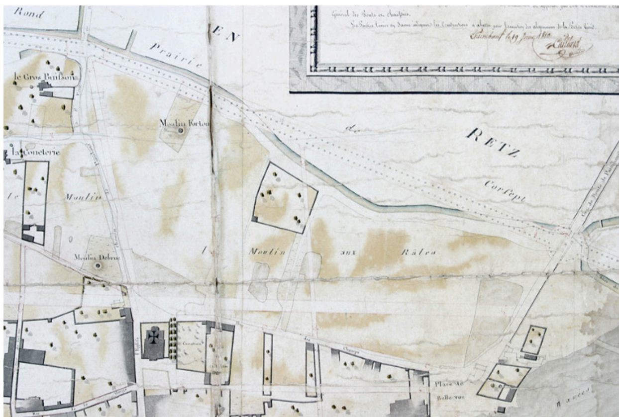
Plan d'alignement, 1810, extrait.