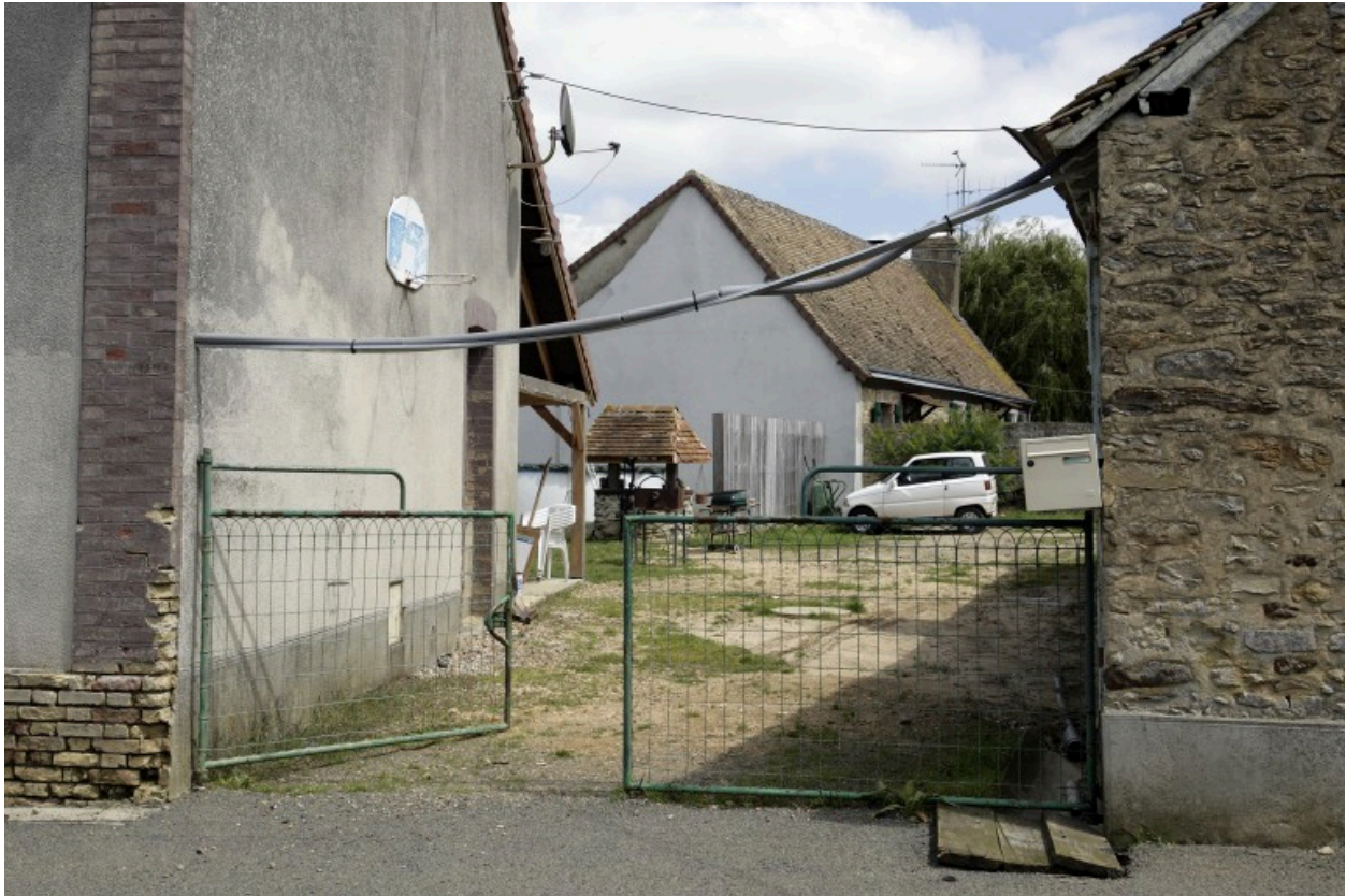
Vue générale. Au fond, la partie subsistante du bâtiment nord.