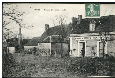
Le café au début du XXe siècle. IVR52_20077200585NUCA