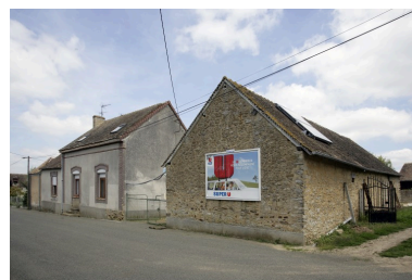
Ensemble depuis le sud. IVR52_20077200774NUCA