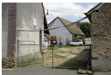
Vue générale. Au fond, la partie subsistante du bâtiment nord. IVR52_20077200773NUCA