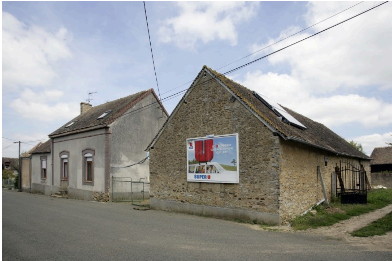
Ensemble depuis le sud.