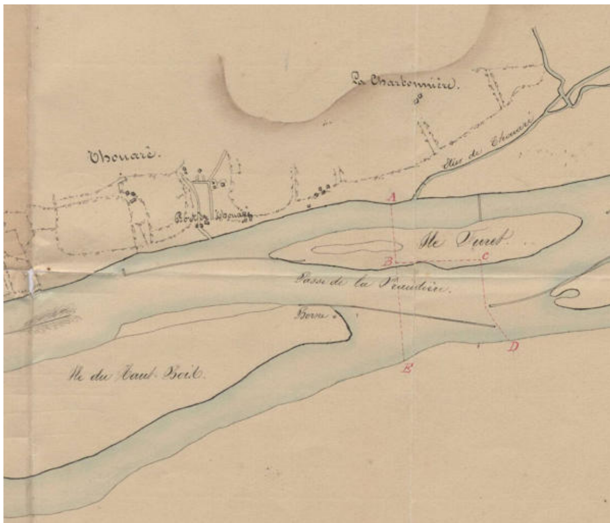
Plan du cours de la Loire comprenant les passages d'eau de Thouaré, l'Officière et Bellevue. Détail du port de Thouaré, 1840.