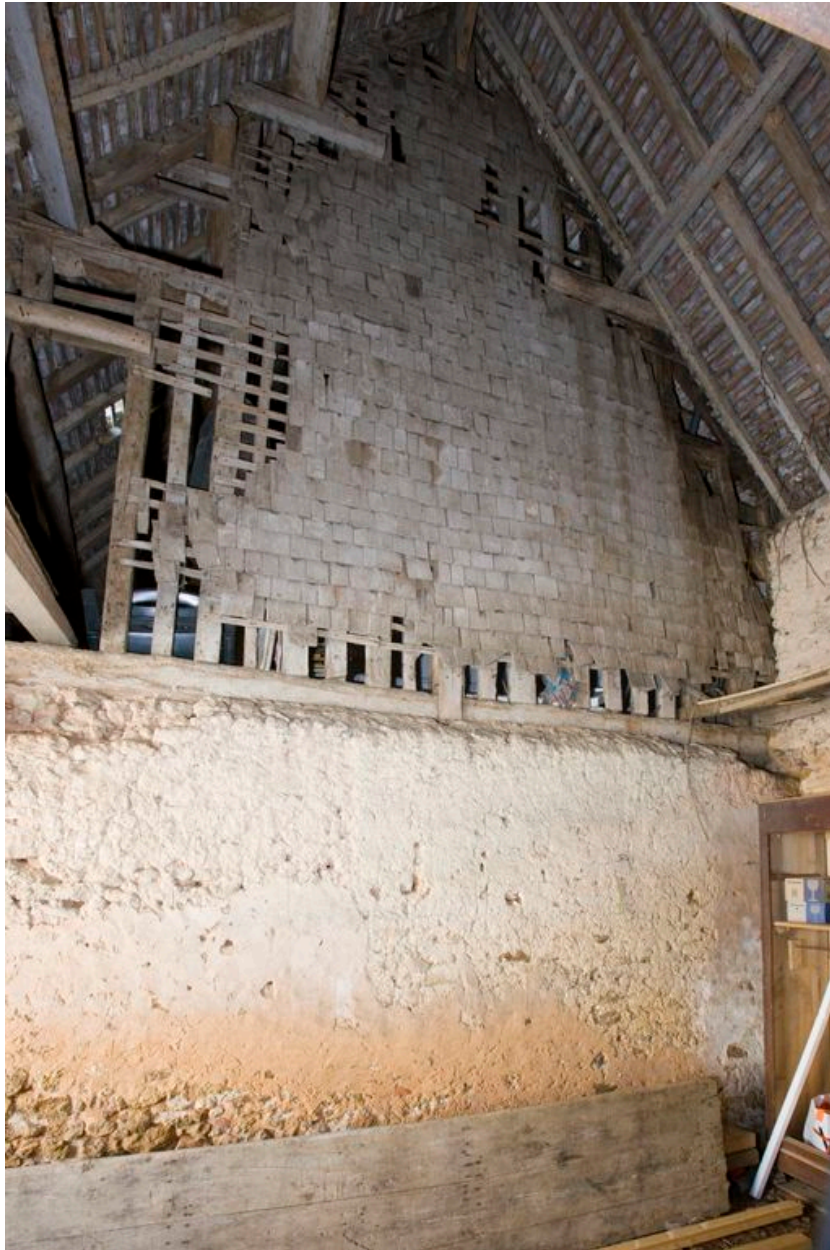
Pignon essenté de bardeaux du logement, vu depuis la grange.