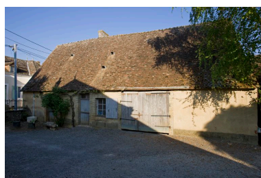
Elevation sur cour du logement et de la grange. IVR52_20117200515NUCA