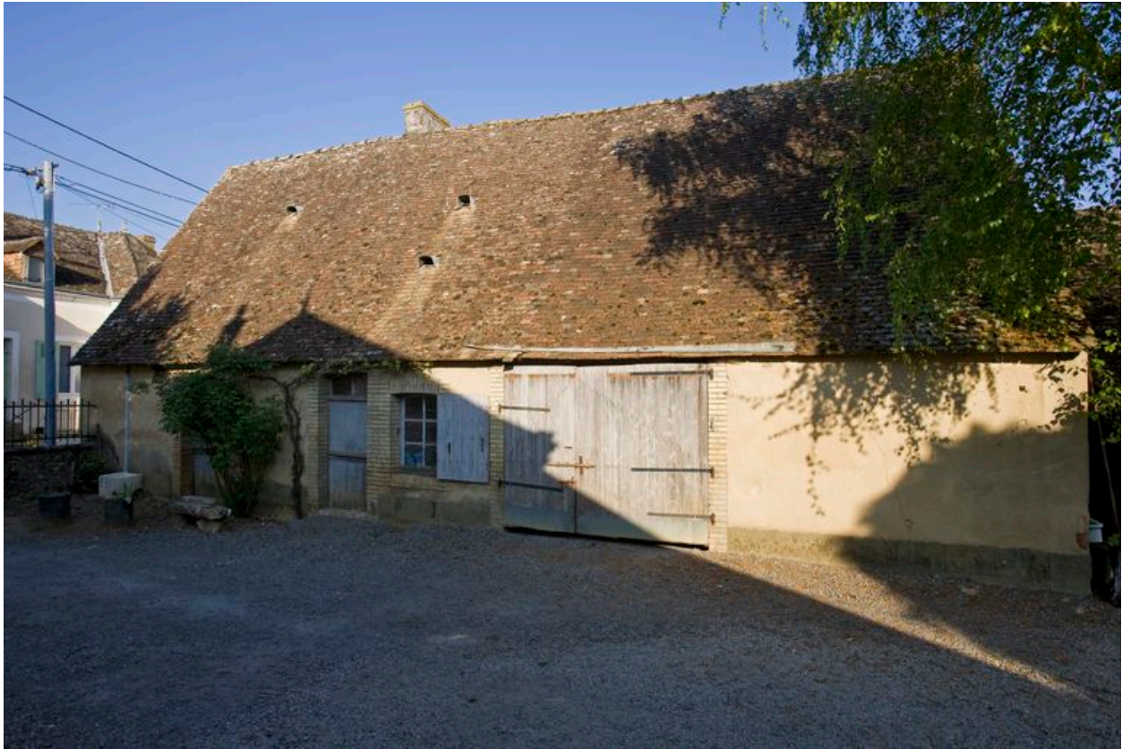
Elevation sur cour du logement et de la grange.