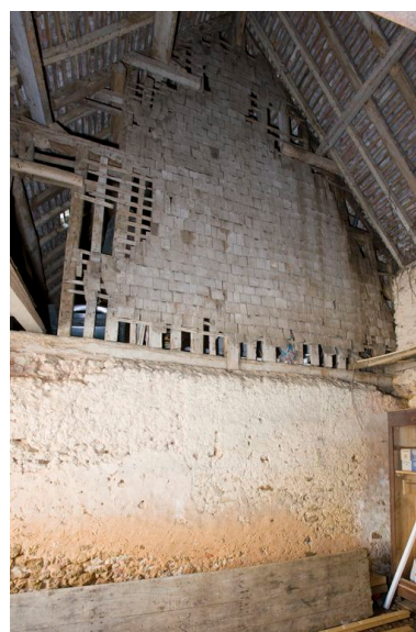
Pignon essenté de bardeaux du logement, vu depuis la grange.