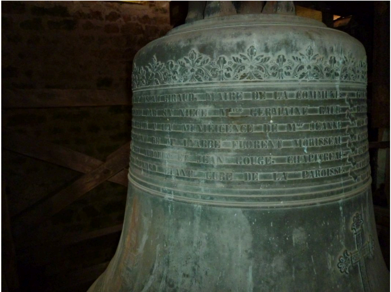
Détail des inscriptions sur la partie supérieure de la robe.