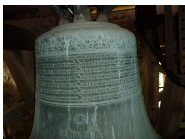
Détail des inscriptions sur la partie supérieure de la robe. IVR52_20188501016NUCA