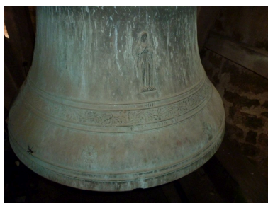
Détail : décor et inscriptions à la base de la robe.