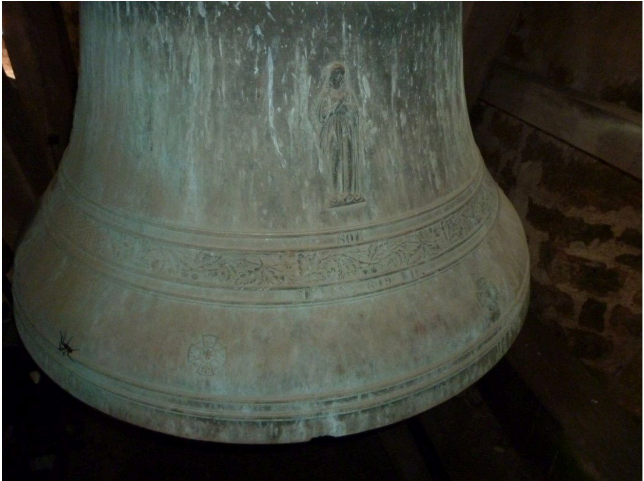
Détail : décor et inscriptions à la base de la robe.