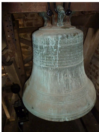
Vue d'ensemble. IVR52_20188501013NUCA