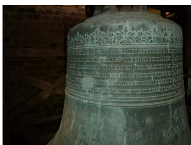
Détail des inscriptions sur la partie supérieure de la robe.