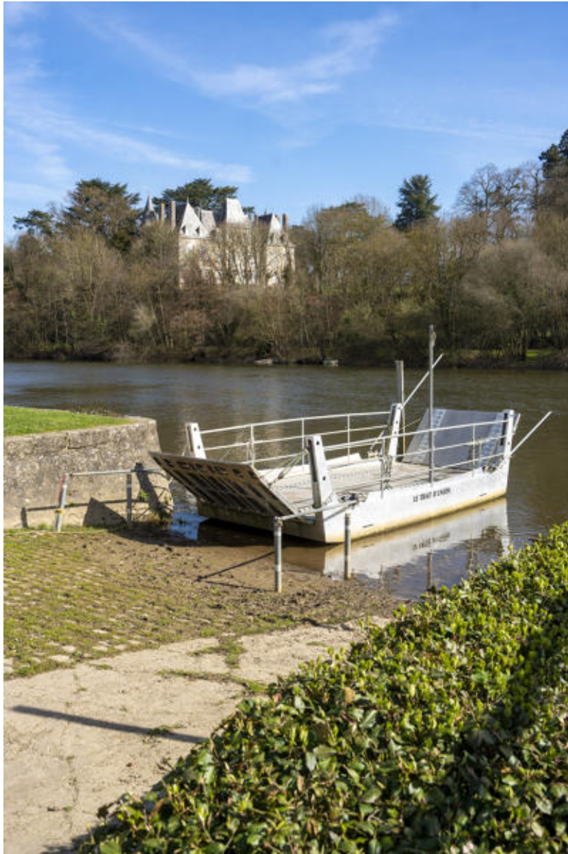
Le bac et le château de la Porte en arrière-plan.