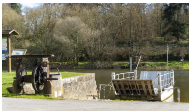
La barge et le treuil.