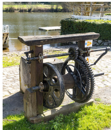
Le treuil.