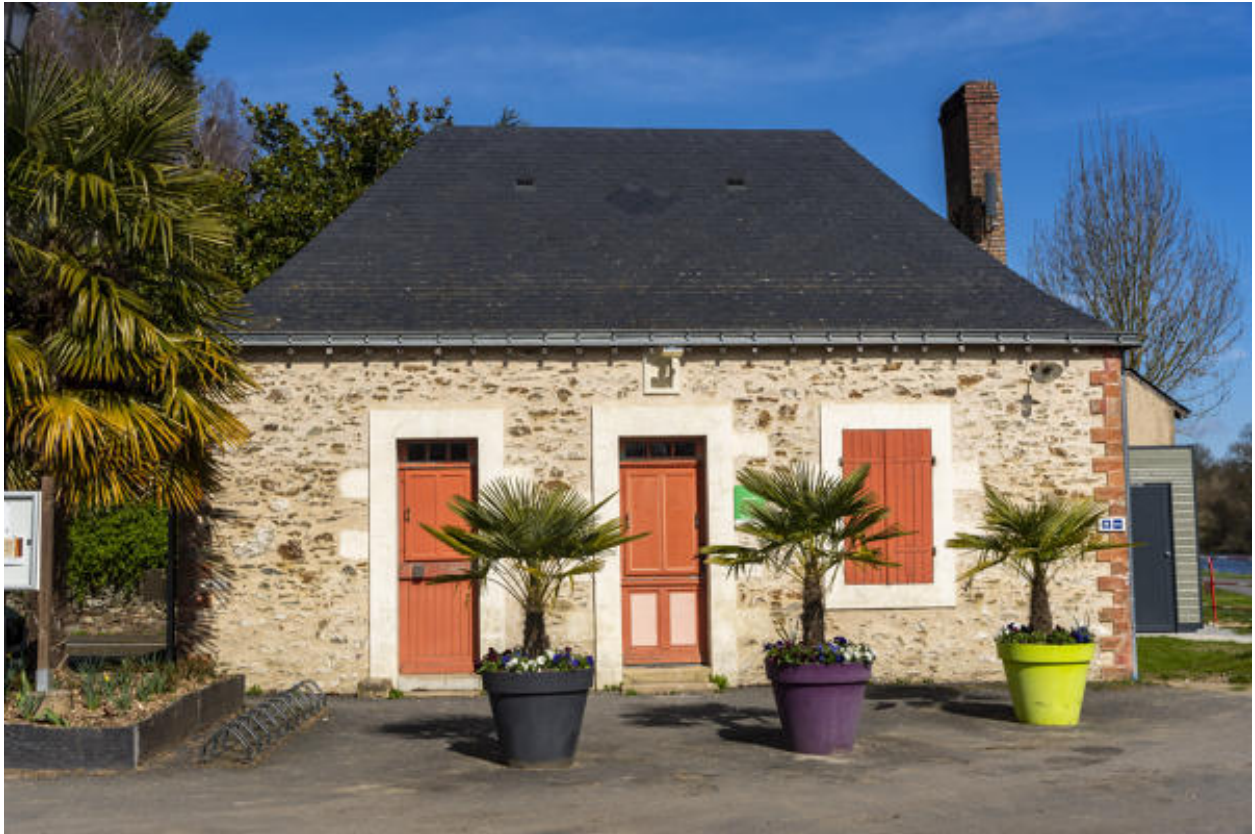
L'ancienne maison du passeur.