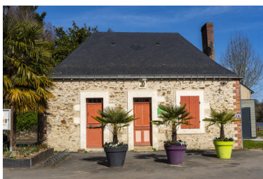
L'ancienne maison du passeur.