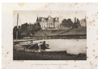
Le bac et le château de la Porte, photographie de la fin du XIXe siècle. IVR52_20225300207NUCA