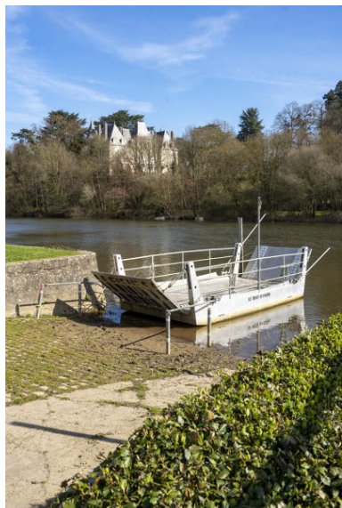
Le bac et le château de la Porte en arrière-plan. IVR52_20225300260NUCA