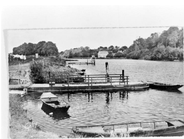
Le bac de Ménéil, photographie du 3e quart du XXe siècle.