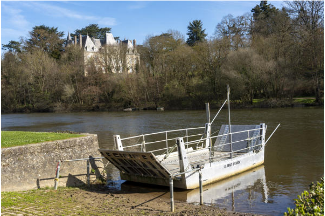
Le bac et le château de la Porte en arrière-plan.