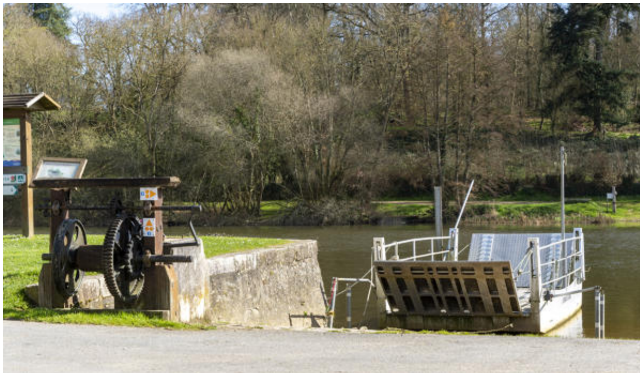
La barge et le treuil.