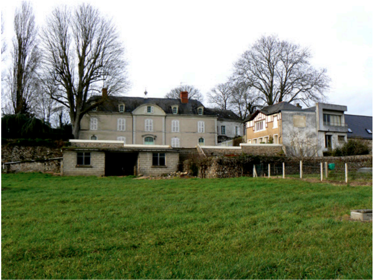
Façade donnant sur la Sarthe.