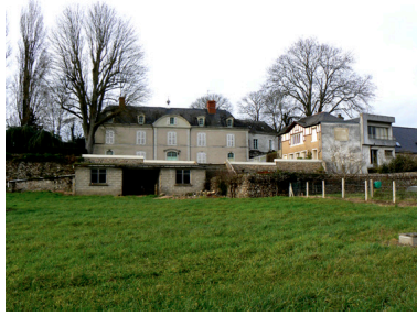
Façade donnant sur la Sarthe. IVR52_20074900269NUCA