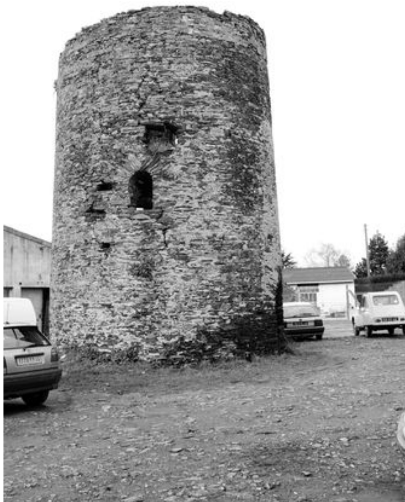
Moulin Meslier, 36 route de Loiré, vue d'ensemble depuis le sud-est.